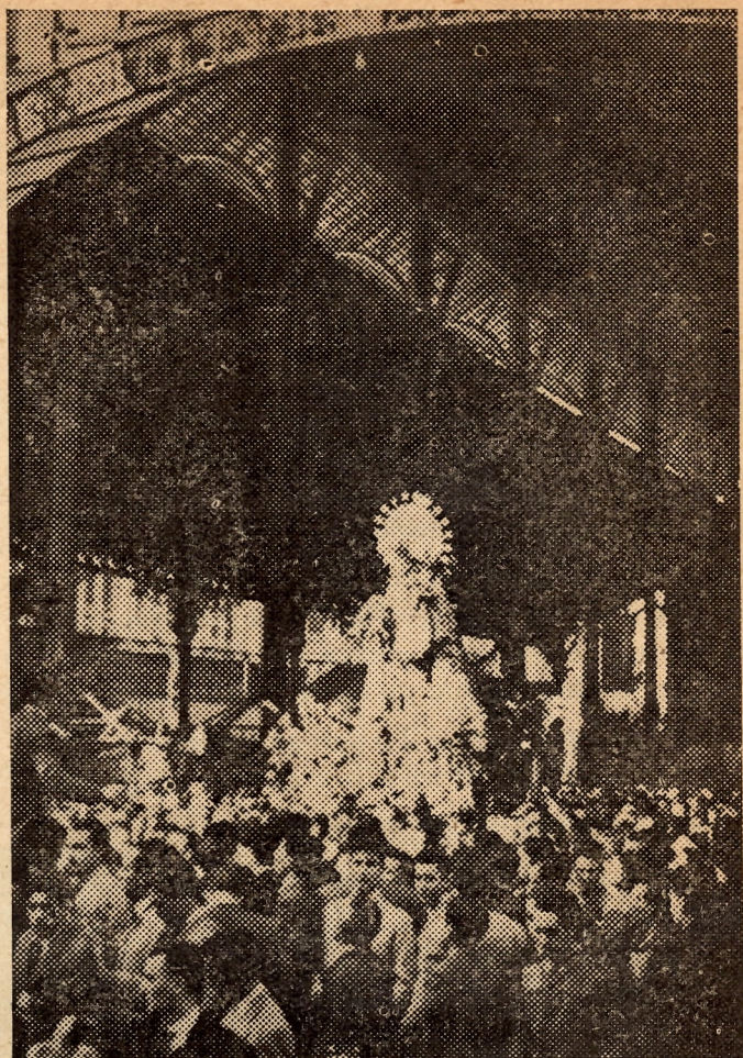
Entre los vitores y aplausos de la muchedumbre nuestra Patrona sale del Mercado de Colón - mayo 1948

Pronto sonará la hora del júbilo; el entusiasmo creciente en los rostros y los vaivenes aprensados los anuncian ya. La Cruz Parroquial con su acompañamiento salió de la Iglesia. La muchedumbre le sigue. La gente se agolpa, se precipita, se adelanta. Los pañuelos se agitan al aire y de repente un grito, veinte... ¡Ya está aquí! Mare..., ¡¡Mare!! ¡no puede ser, es totalmente imposible! El corazón late