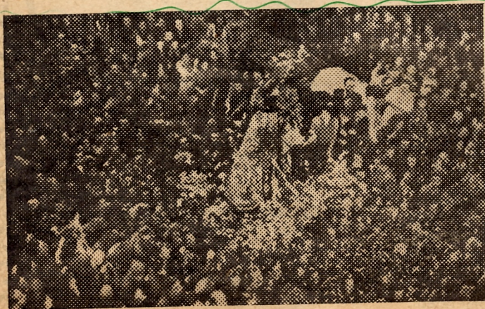
Las vendedoras del Mercado rinden un homenaje apoteósico a la Madre de los valencianos