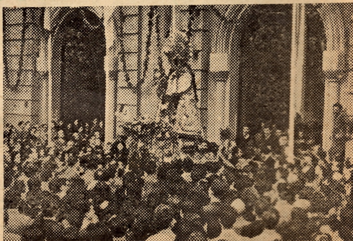
Nuestra Señora de los Desamparados entra en la Iglesia parroquial de San Juan y San Vicente entre la emoción indescriptible de sus miles de seguidores.