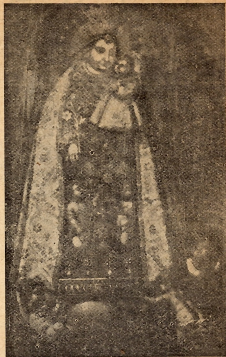
Uno de los numerosos lienzos de nuestra Patrona que se conservan en las dependencias del Santo Hospital de Valencia y que debiera ser restaurado de nuevo.

De las cuatro de talla --(celosamente guardadas en esta Casa de Dolor vemos en el crucero de la Sala Principal la más antigua y simbólica ya que la misma Cofradía entregara al llevarse la verdadera; la que preside la Iglesia; otra en las dependencias de la Comunidad y otra en la Sala de los niños abandonados)—tenemos siete lienzos culminando el grandioso que representa el laborar silencioso de los angeles labrando y decorando dentro del Capitulo en 1409 la Principal Imagen de Ntra. Señora Sancta Dona dels Inocents. Acaso el más fiel parecido es este otro que sobre el presbiterio de la Iglesia— del Hospital —en bellísimo encuadre vemos. De una dulzura expresiva con pocas alhajas y aún sin manto es sin duda alguna la más antiquísima interpretación, tanto que cierto Sr. Canónigo de la Catedral en