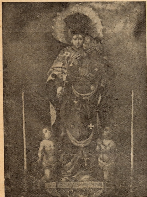
Bella y antigua pintura de Ntra. Sra. de los Desamparados en su primitiva figura o sea, sin el manto actual. Se conserva en la Parroquia de San Pedro Pascual.