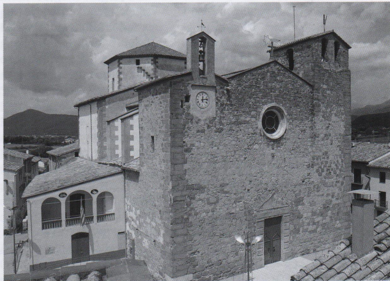
Església de Santa Maria de Tortellà amb els dos campanars.