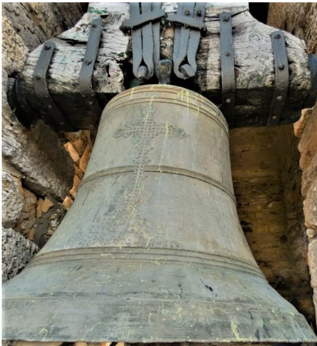
Campá maior situada no campanario de Santa María A Real do Cebreiro, Lugo.