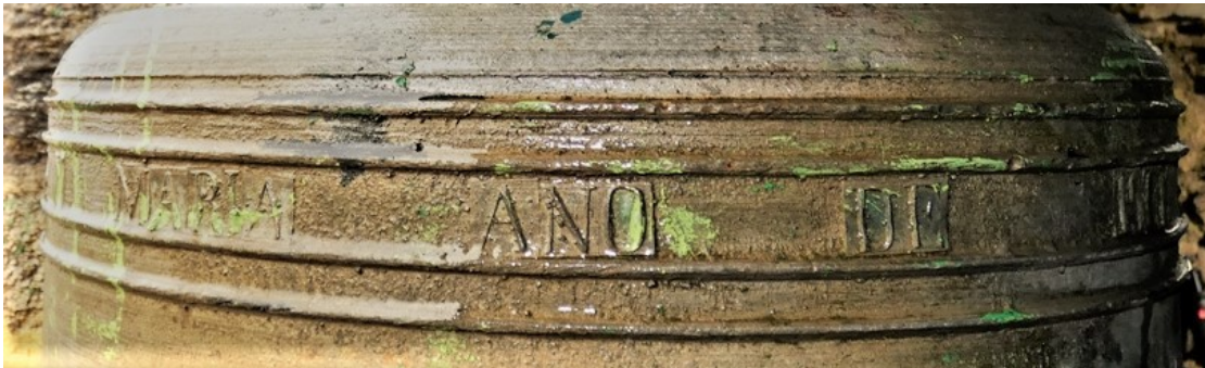
Inscripción da campá maior de Santa María A Real do Cebreiro: "(JHS) Y MARIA ANO DE 19(01)."