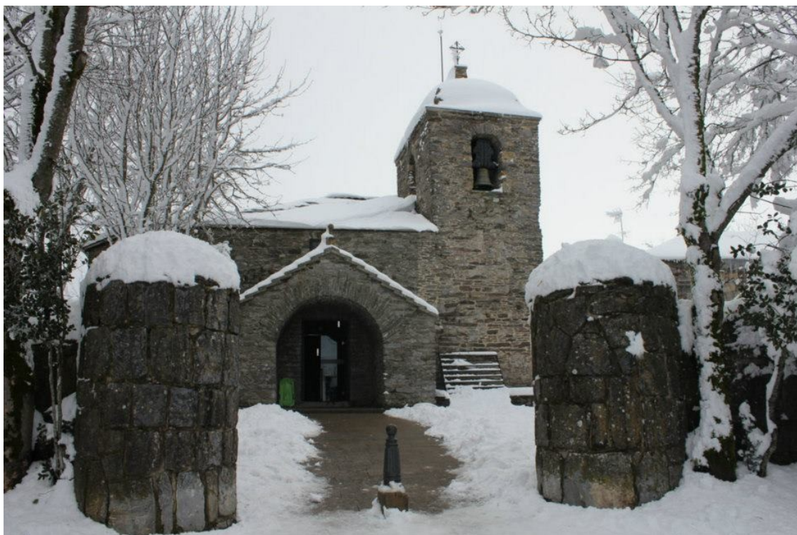
Santuario de Santa María A Real no Cebreiro, Lugo.

O templo de Santa María A Real foi fundado polo conde de Aurillac; pertencente á orde de Cluny, é o monumento máis antigo da ruta xacobeana integralmente conservado, aínda que cabe sinalar que a actual fachada non é a orixinal. Ten un pórtico en arco de medio punto e na súa esquerda sitúase unha pequena torre con catro ocos en arco de medio punto onde se sitúan as campás que a continuación pasamos a describir.