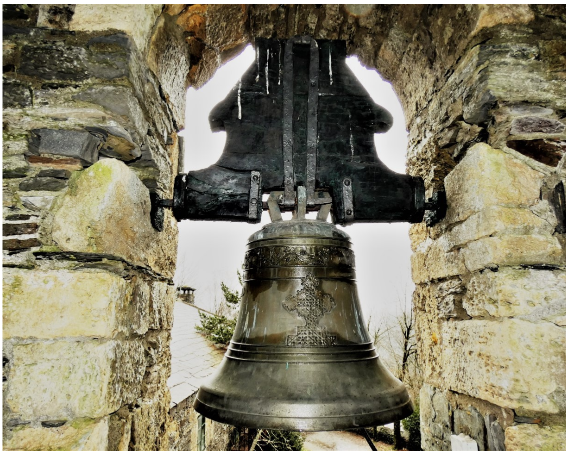
Campá menor de Santa María A Real do Cebreiro, fundida por “Campanas Quintana” en 1984.

No “Medio Pé” (MP), van tres cordóns e rematando a decoración cun cordón no “Pé” (P).