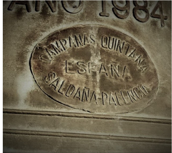
Dúas fotografías da campá menor de Santa María A Real do Cebreiro, Lugo, fundida en 1984.