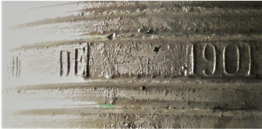
Data da campá maior de Santa María A Real do Cebreiro: "(A)NO DE 1901"