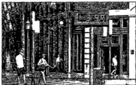
Las calles de Valencia estaban casi desiertas.

■ Las temperaturas diurnas caerán hoy entre 5 y 10 grados al cortarse el poniente ◉ 9