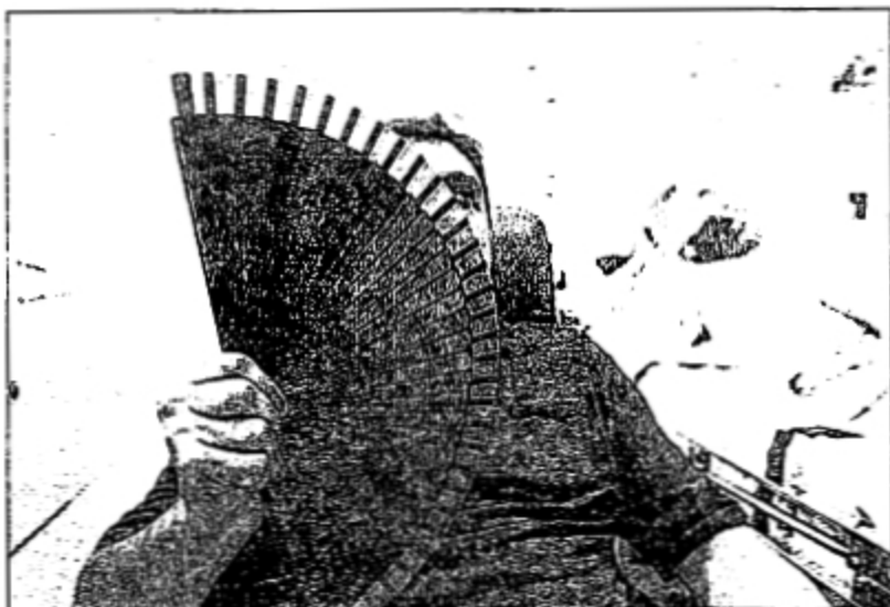
El abanico se ha vuelto imprescindible en el hospital Clínico de Valencia.

«La situación es igual que el sábado, calor y sudor», se queja otro paciente del centro hospitalario que cuenta con sorpresa como su nuevo compañero de habitación que ingresó ayer «ha llegado con un gran ventilador