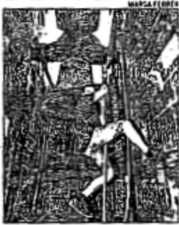
Volteo después del «repret». MARCA FOTOF

LOS CAMPANEROS DE VALENCIA REAJUSTAN LOS YUGOS APROVECHANDO EL CALOR, SEGÚN MANDA LA TRADICIÓN DESDE LA EDAD MEDIA ◉ 13