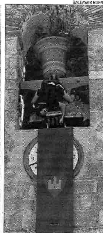
Un joven voltea una campana.

El único cuidado a tener en cuenta es que la cabeza del volteador no sobresalga mucho del yugo y roce en la ventana de la campana y que los que la empujan en ese momento lo hagan con tino, al ritmo adecuado. Lo habitual es dar media docena de