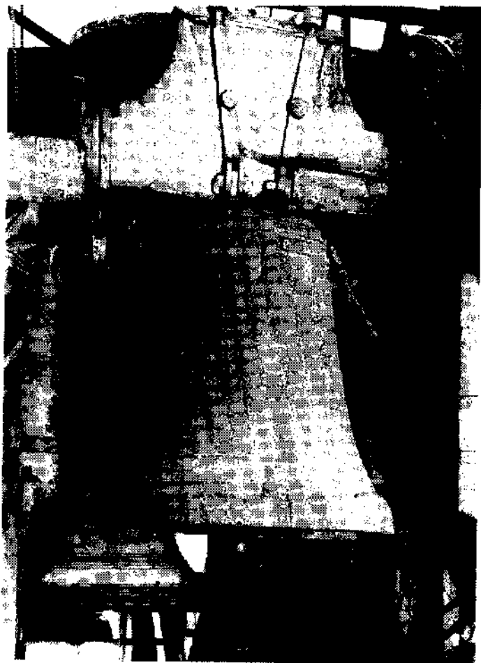
FIG. 2 Roma, Basilica di San Pietro in Vaticano. Campana della Rota (1353?)