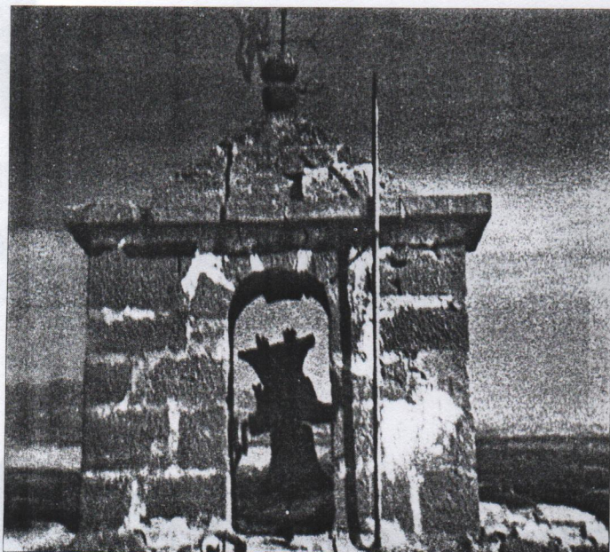
Campanario de San Miguel hacia 1982