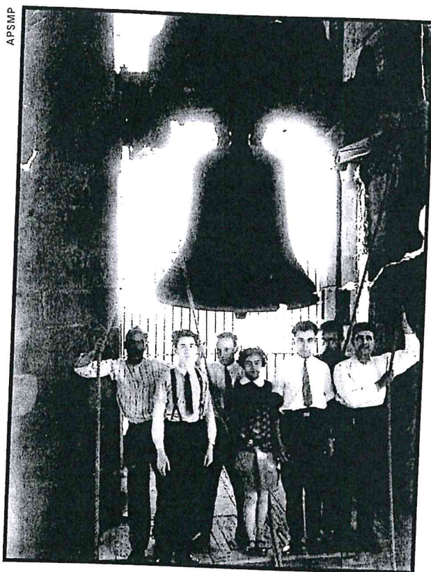
La família Zanuy, campaners de la catedral de Barcelona fins al 1929, als peus de la Tomasa.

D'uns anys ençà hi ha diversos grups que, des de l'associacionisme, prenen l'antic costum de pujar les escales del campanar i fer allò tan simple d'estirar una corda i fer «dong-dong», «clang-clang» o «ning-ning». Depèn de la persona que ho descriu, amb mofa, el so de l'onomatopeia varia. Els campaners, però, tenen encara una missió comunicativa i, tornant a les onomatopeies, pot ser que la diferència sigui causada pel so de la seva campana i la relació que tenen aquestes amb l'imaginari col·lectiu; fins i tot n'hi ha que prenen aquest nom popular, com la campana Maria Magdalena (1766) de Valls, coneguda popularment com a pench-pench . Aquesta tasca comunicativa es va reprenent en diversos campanars i, des de fa