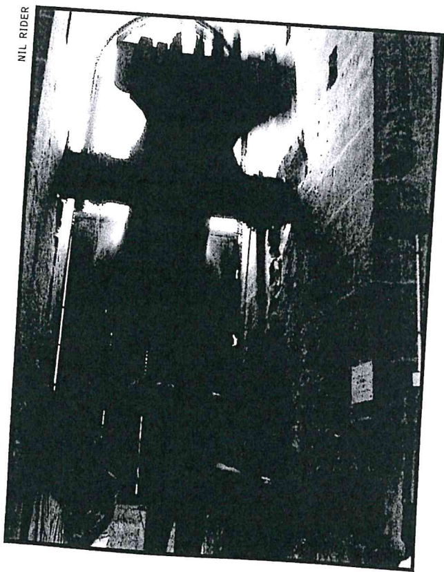
La campana Maria, del Micalet de València, anunciant que el repret de Sant Llorenç s'ha acabat sense cap incident.