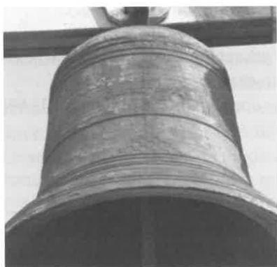
Campá pequena de Anllóns, feita por Melchor Ocampo en 1901 en Arcos da Condesa (Caldas de Reis).

Medidas: 74 cm de altura e 92 cm de diámetro na boca, tendo un peso de 451 kg.