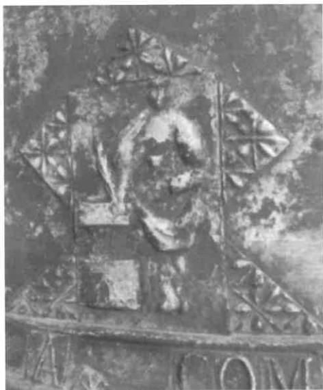
Imaxes decorativas da campá grande: Santa Bárbara e custodia.