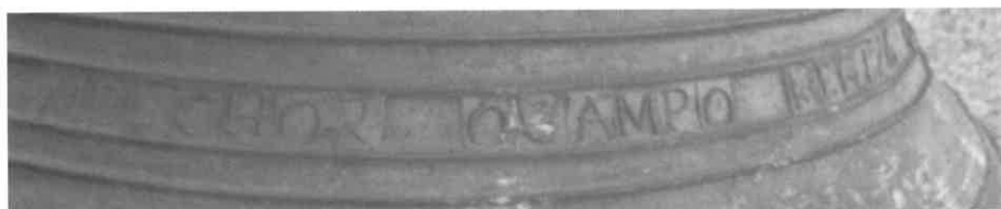
Nome do fundidor Melchor Ocampo na parte inferior da campá pequena.