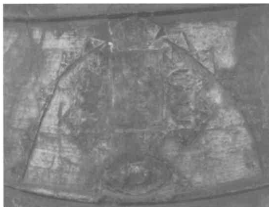
Escudo e sinete co nome do fundidor na parte inferior (Campá grande).