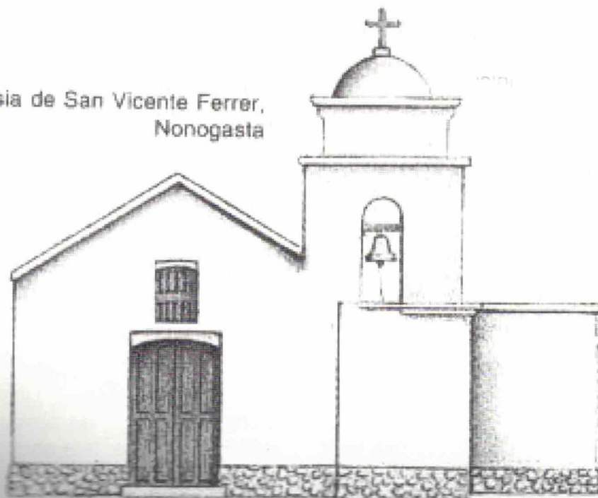
Iglesia de San Vicente Ferrer, Nonogasta

Composición de los volúmenes: Con una planta sumamente sencilla, rectangular, la nave central de 4,5 por 14 m. aproximadamente. Una nave lateral, que opera casi como camarín, con dos habitaciones que junto con el campanario de planta cuadrada dan estabilidad estructural a todo el conjunto (la habitación del frente es usada como depósito). Se podría decir que al volumen principal, prismático con techo inclinado a dos aguas, se le "adiciona" uno, con