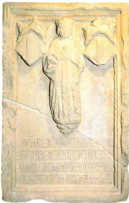
làpida commemorativa de la Torre de Santa Caterina. 13 de juny 1390

Les muralles de la ciutat constituïen el seu fet definitori, en l'Edat Mitja, de manera que un dels primers escuts de València representava una ciutat emmurallada, rodejada per les aigües d'un riu. Aquesta representació simbòlica ha arribat als nostres dies, fins i tot després de l'enderrocament físic dels murs, a través de nombrosos gravats religiosos populars.