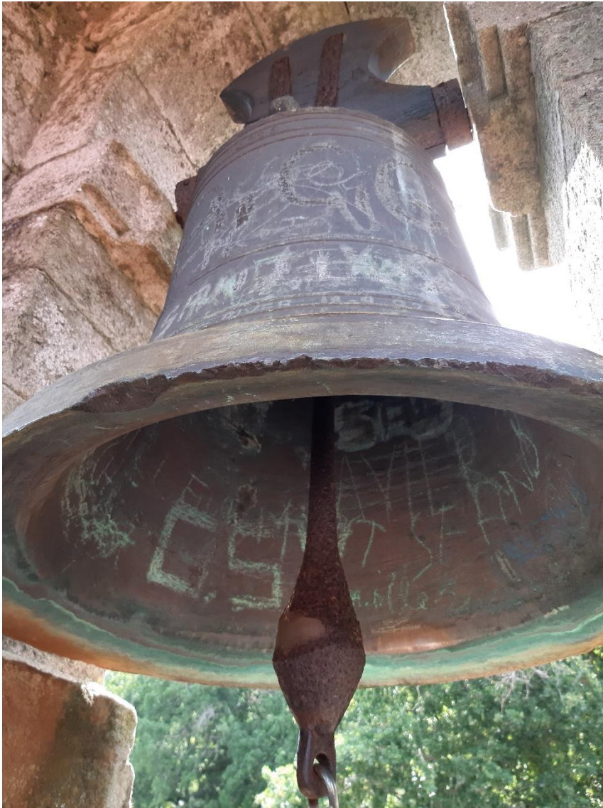
Campá maior “Santa María”