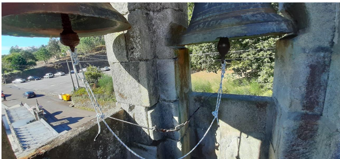
Campás cas cordas novas.