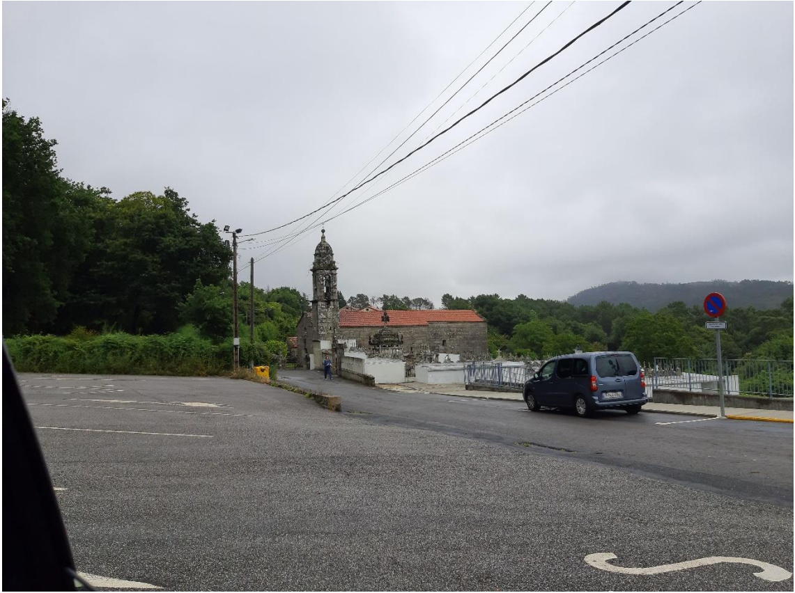
A igreja e o seu entorno visto dende a estrada.