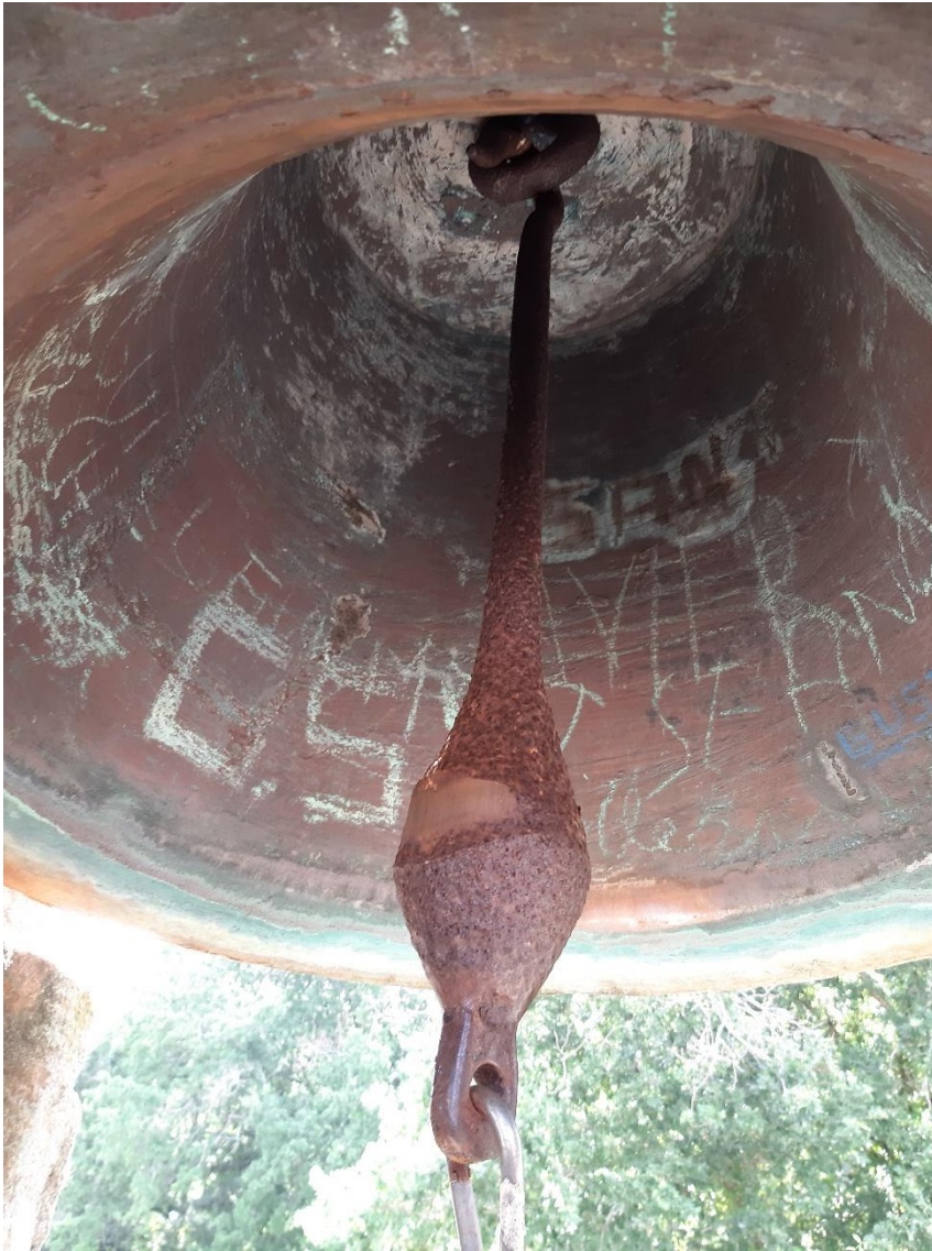
Badal e interior da campá “Santa María”. Obsérvanse os gravados feitos no interior.