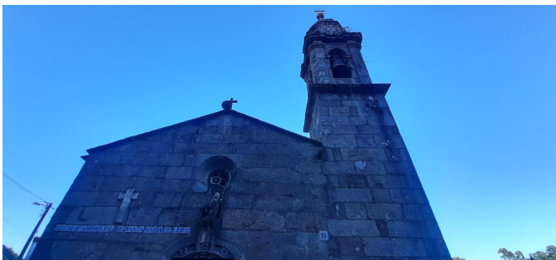
Fachada da igrexa.