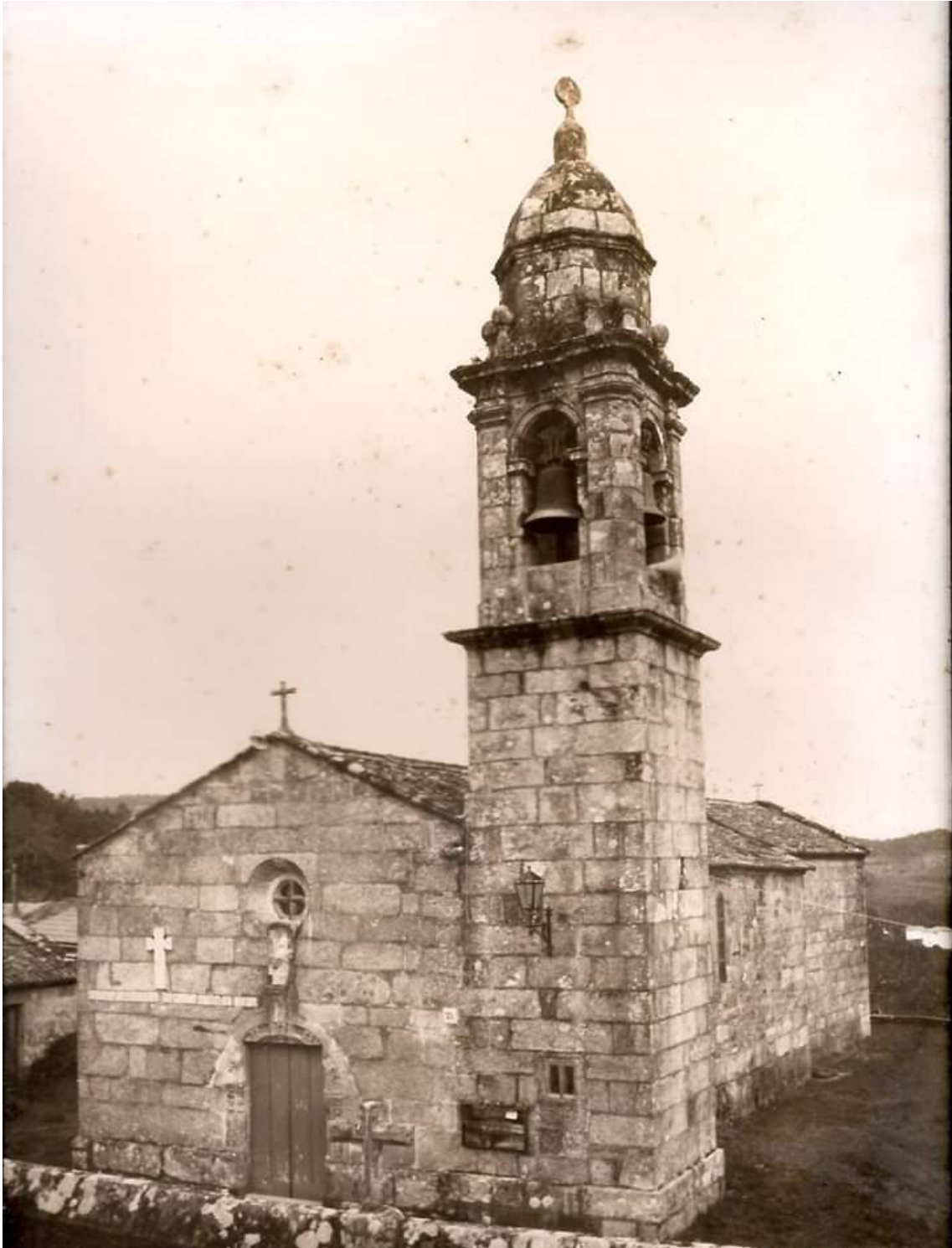
A igreja nos anos 60. Obsérvanse os antigos cepos das campás.