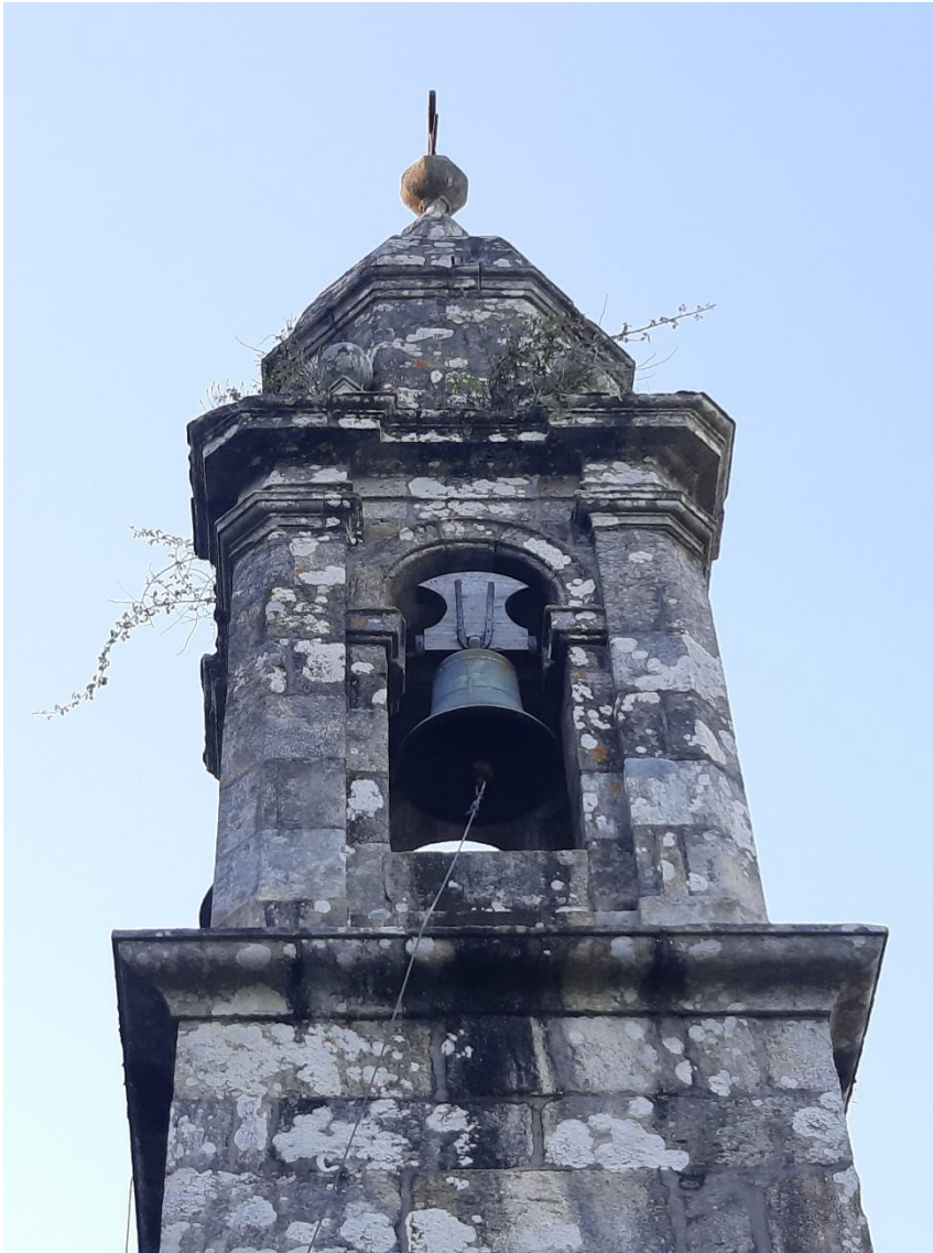
Campá pequena “Santa María” dende o adro.