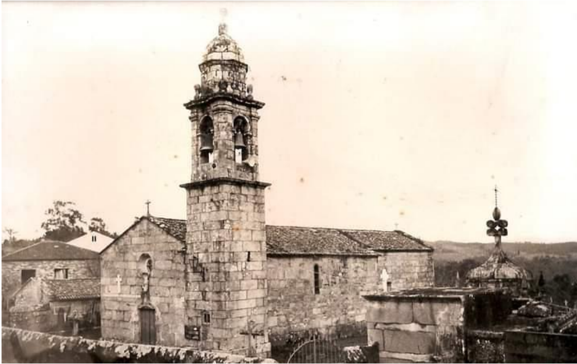
A igrexa nos anos 60. Obsérvanse os antigos cepos das campás e a corda atada á panca do cepo da campá pequena.