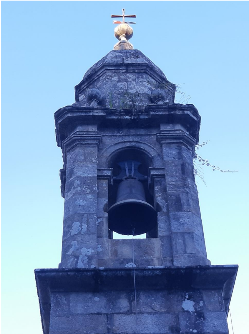
Campá grande "Santa María" dende o adro.