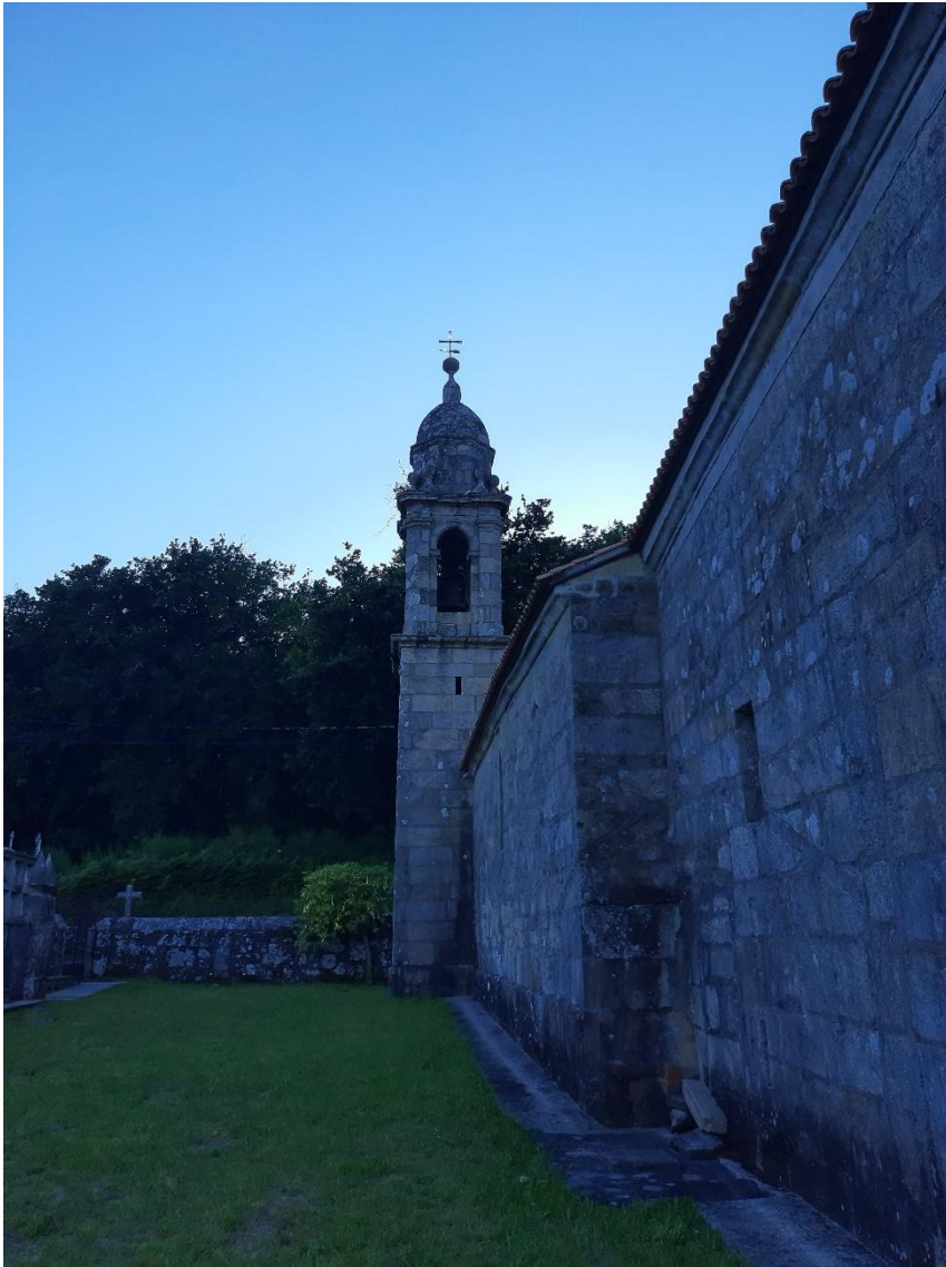
Campanario da igrexa e adro.