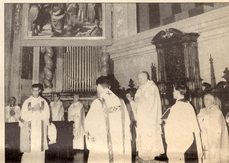
El Arzobispo presidió el Pontifical, con las tablas respuestas del Altar Mayor

durante poco más de una hora, de 8 a 9. Al término, en la Catedral, tuvo lugar la bendición solemne.