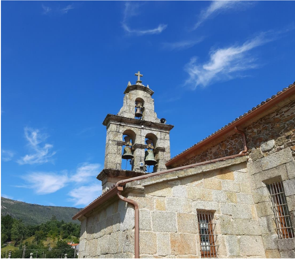
A espadana (contruída sobre unha das paredes da sacristía)