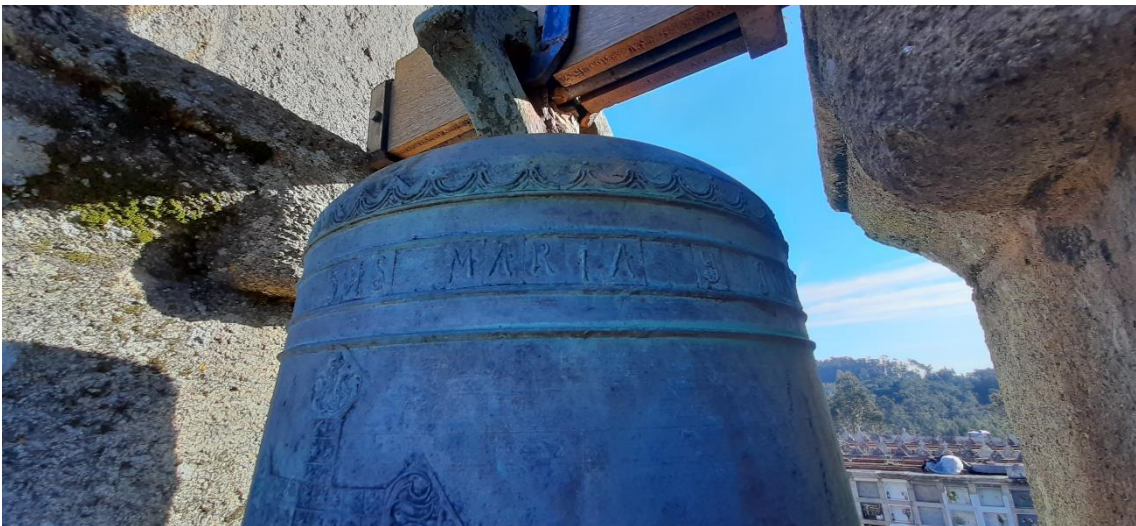
“JHS, MARIA Y JOSE” da campá grande “San Ysidro”