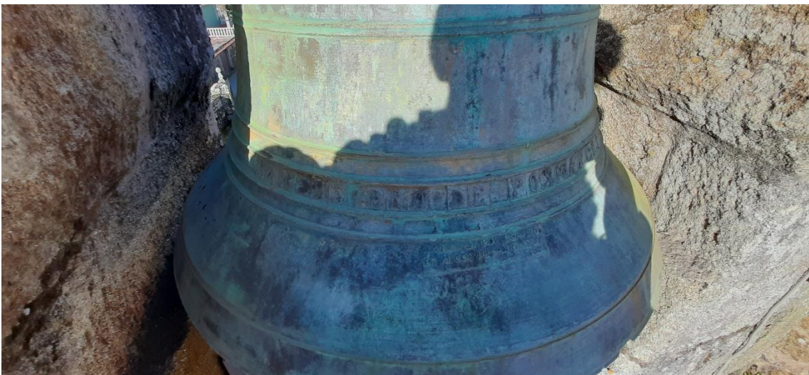
Boca da campá grande “SAN YSIDRO”