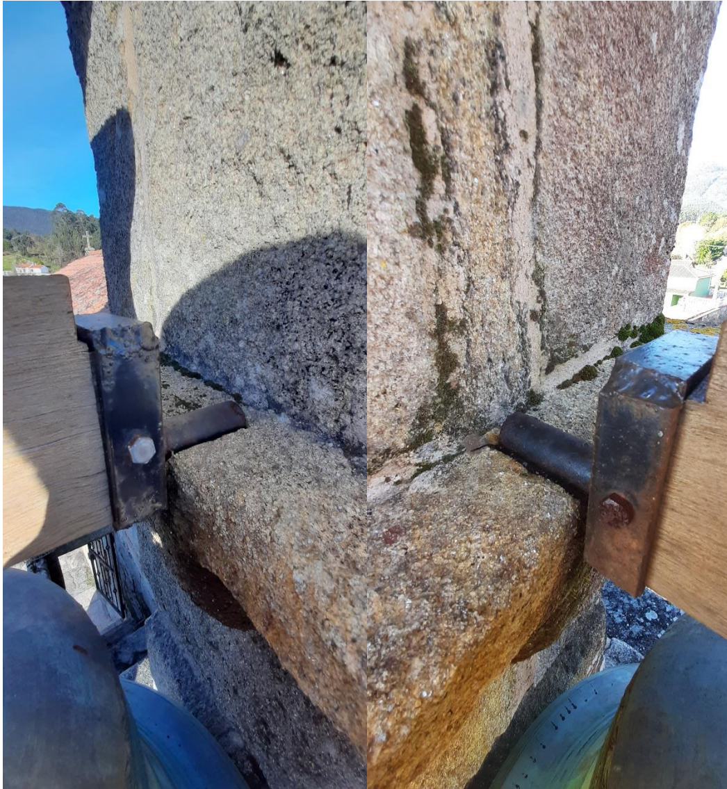
Eixo da campá grande “San Ysidro”