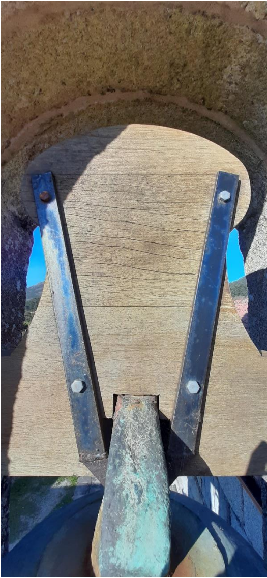
Cepo da campá grande “San Ysidro”