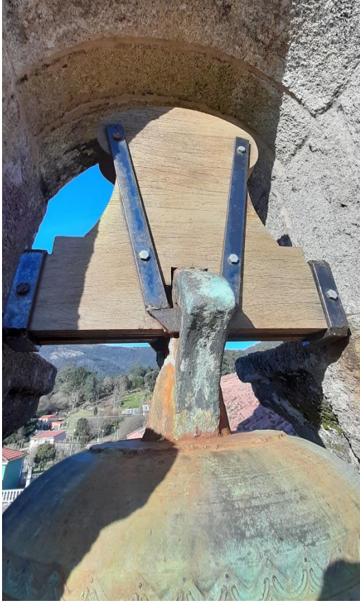
Cepo, asa e cenefa da campá grande “San Ysidro”