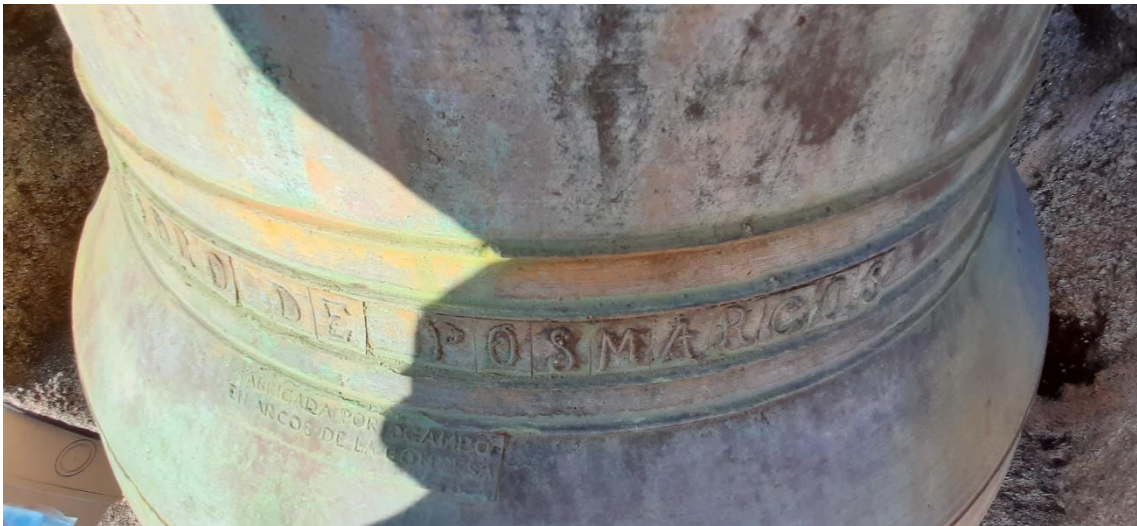
“...IDRO DE POSMARCOS” e marca de fábrica (Ocampo) na campá maior.