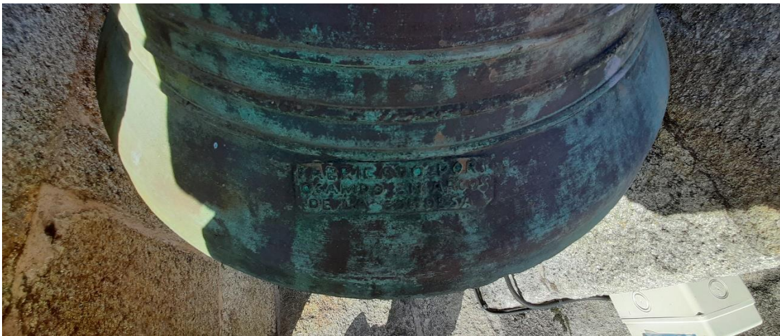
Marca de fábrica (Ocampo) na campá mediana.