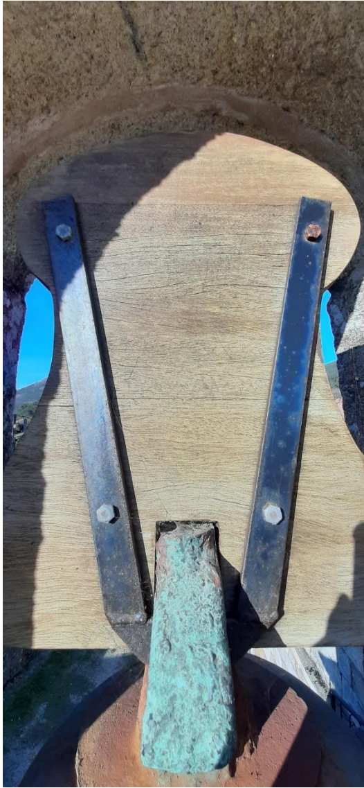
Cepo e asa da campá mediana.