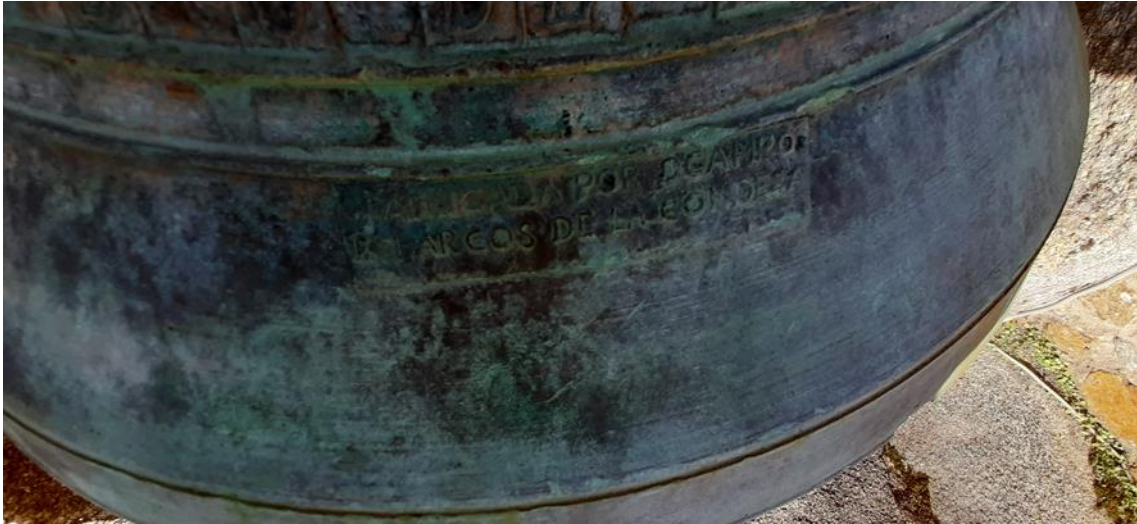
Marca de fábrica (Ocampo) na campá maior “SAN YSIDRO”