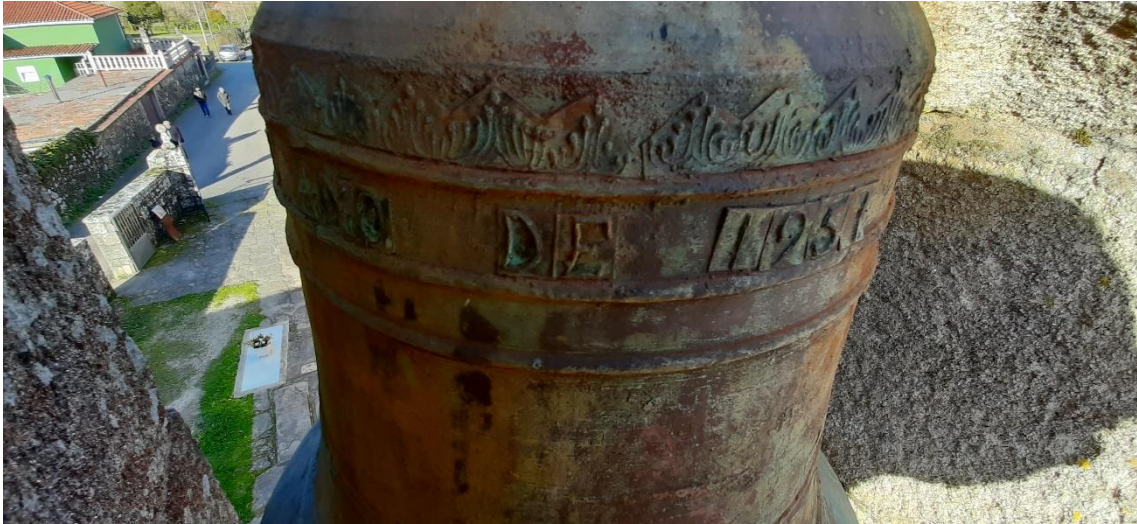
“ANO DE 1951” e cenefa na campá mediana.