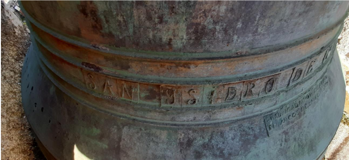
“SAN YSIDRO DE...” e marca de fábrica (Ocampo) na campá maior.