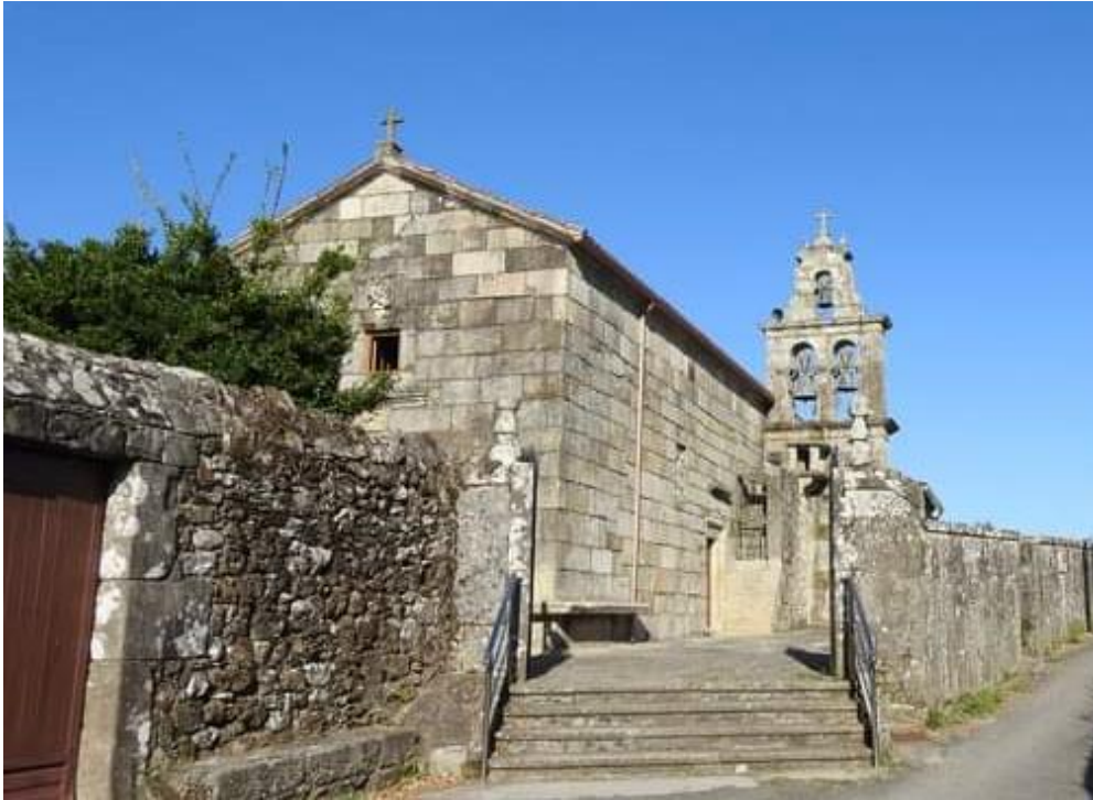
A igrexa.