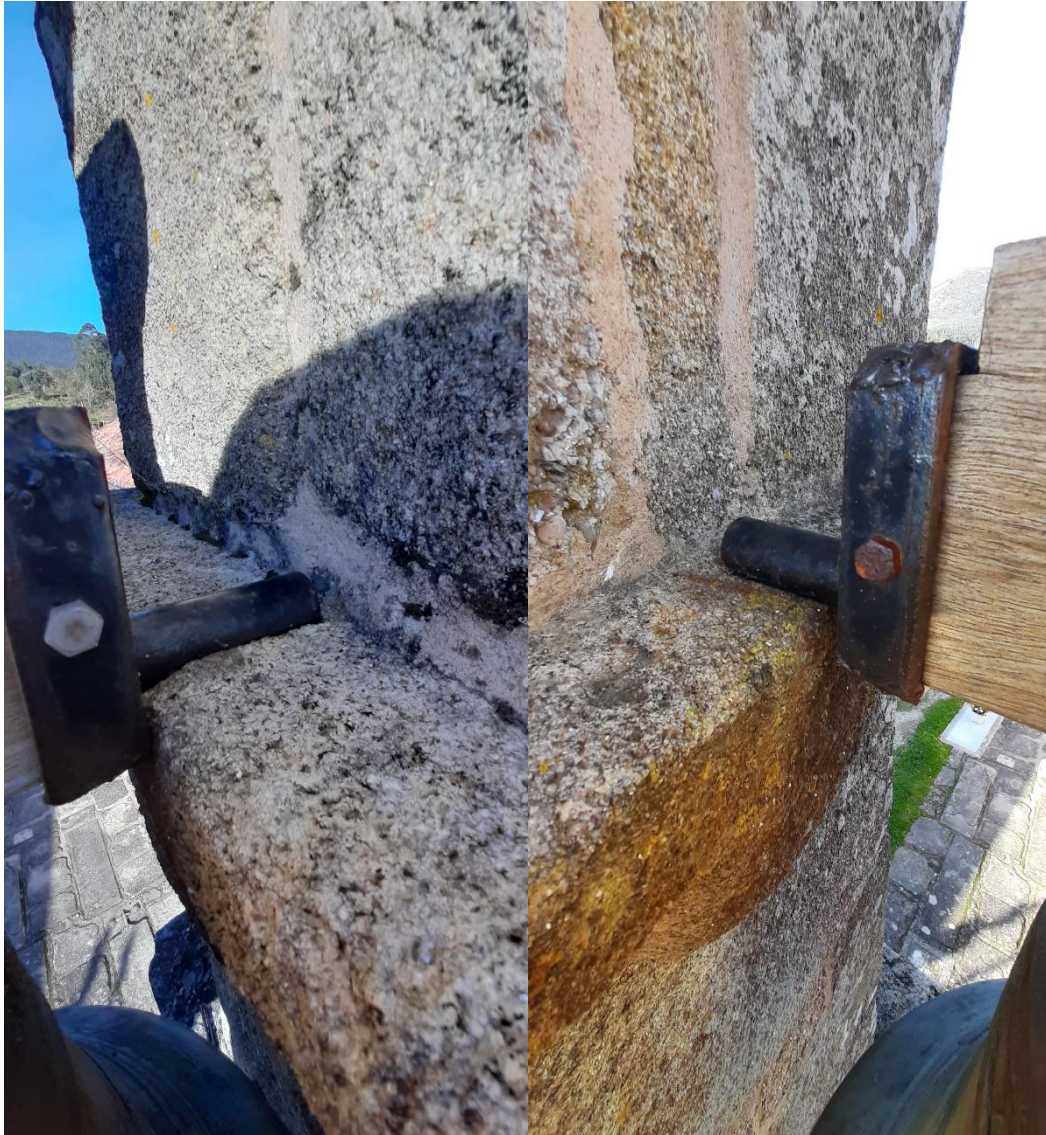
Eixo da campá mediana.