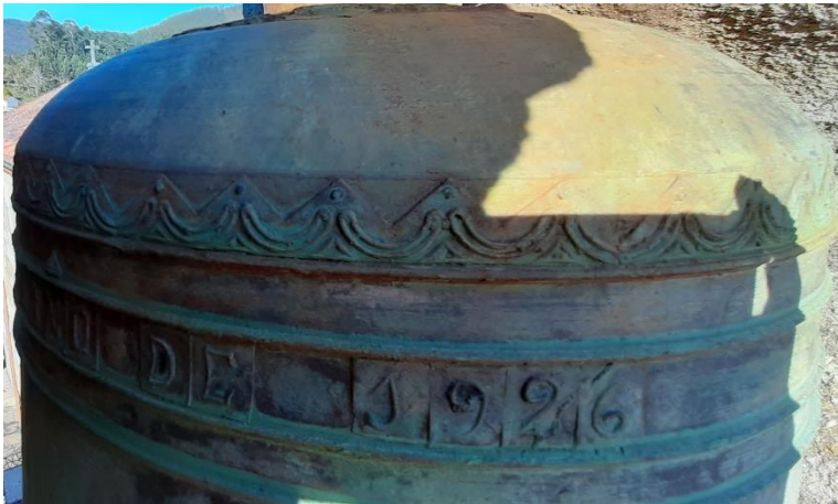
“ANO DE 1926” da campá grande “San Ysidro”