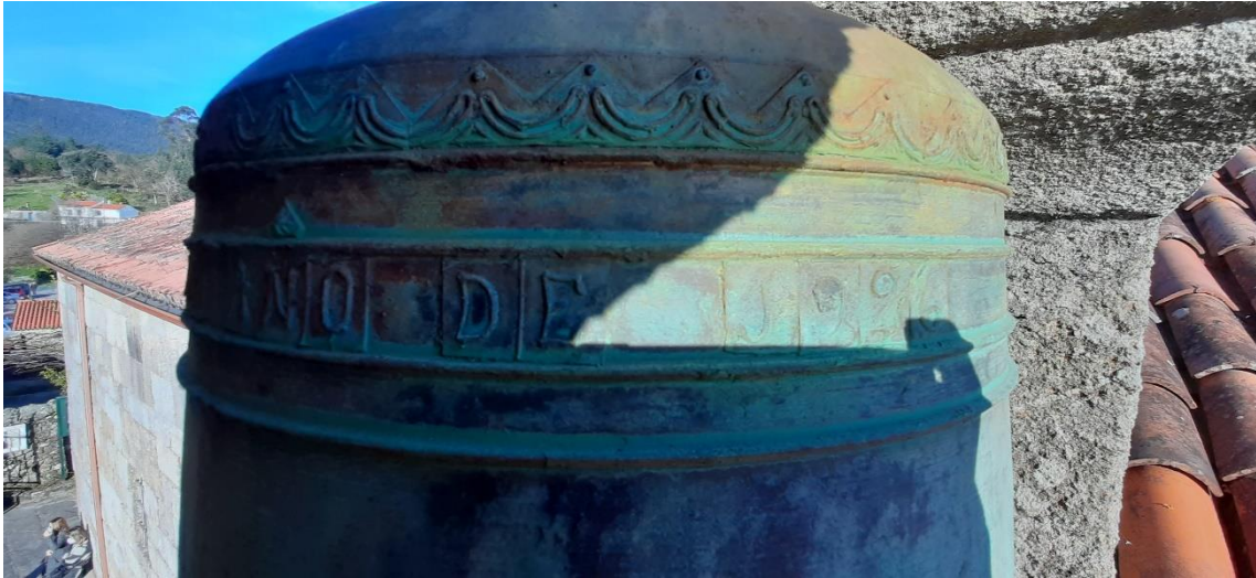
“ANO DE 1926” da campá grande “San Ysidro”