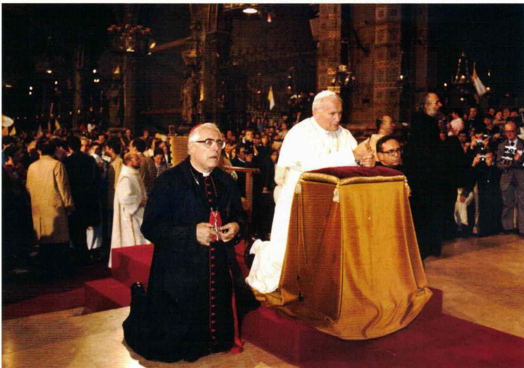
Joan Pau II visità Montserrat el dia 7 de novembre de 1982.