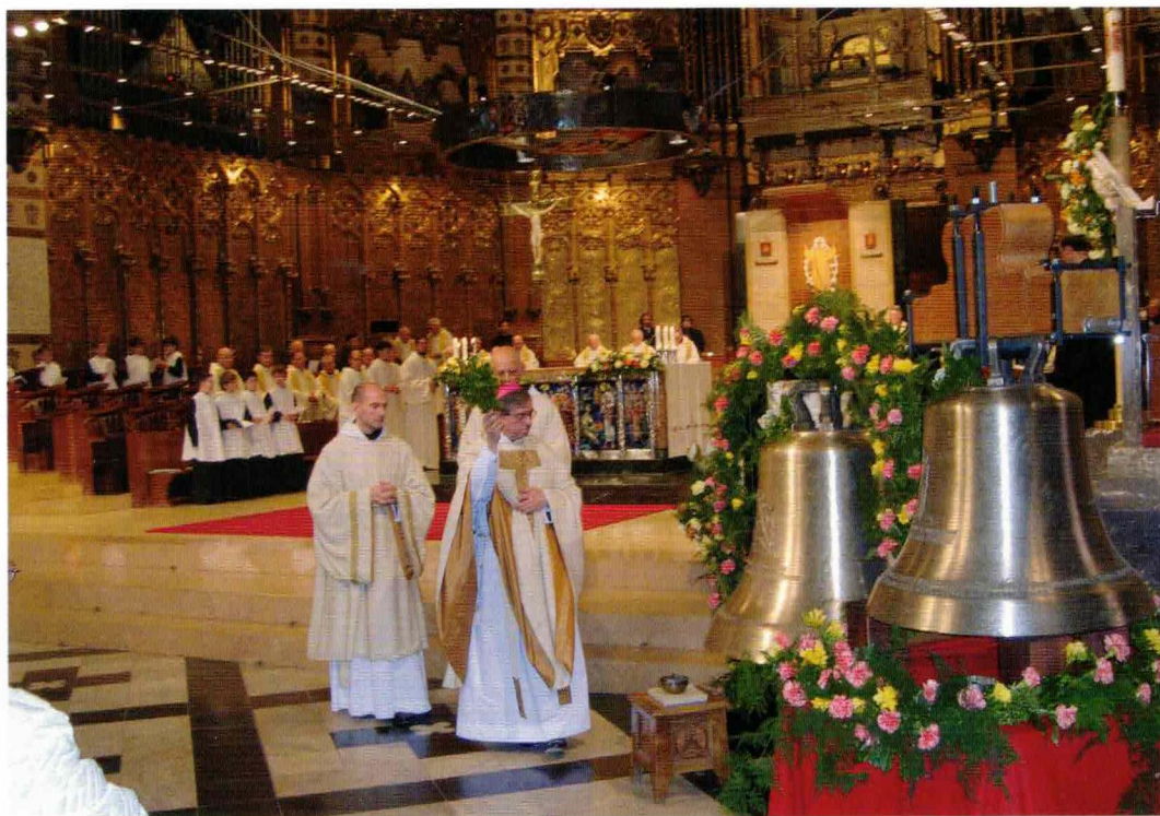
El P. Abat beneeix les dues noves campanes.