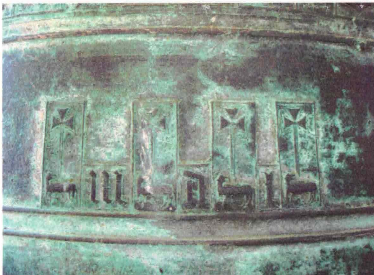
La data de la campana més vella: MDI.

El so de les campanes d'un poble forma part de la seva essència, de la seva idiosincràsia, de la seva història, en definitiva, és consubstancial amb el propi poble i els seus habitants. Així ho entén la feligresia vacarissana, una «comunitat de fe i amor, oberta a tots, acollidora i fraternal», i ho expressa en el número 157 d'abril-maig de 1981 del periòdic Vacarisses, Balcó de Montserrat : «El so de les campanes del poble el portem molt endins: no és el so solemne de les grans catedrals, però per a nosaltres és el nostre, el millor, el que ens parla més clar, el que més coses ens diu.»