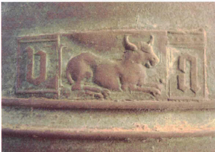
Una vaca, emblema de Vacarisses, a la campana del segle XVI.