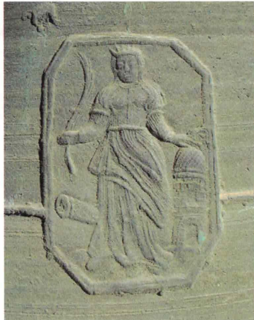
Imatge de santa Bàrbara a la campana del segle XIX.

Recordem, d'altra banda, que santa Bàrbara és representada també en la predel·la o part basal de l'antic retaule gòtic de Sant Salvador de les Espases, actualment conservada al Museu de Terrassa, situat al Castell-cartoixa de Vallparadís.