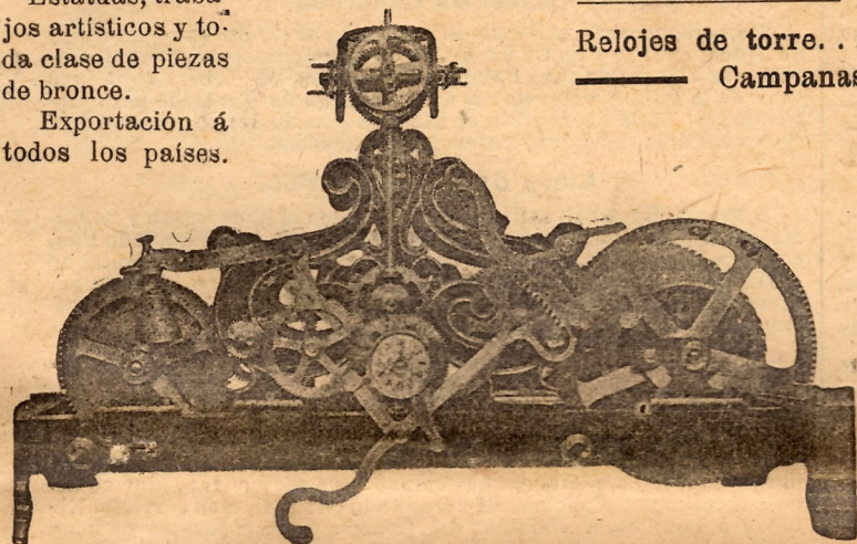
Reloj núm. 9 de la tarifa, para tocar en campanas de 600 kilos.

Relojes de torre..... 130 Relojes de Estación..... 72 Campanas con peso total de 60.000 kilos..... 328