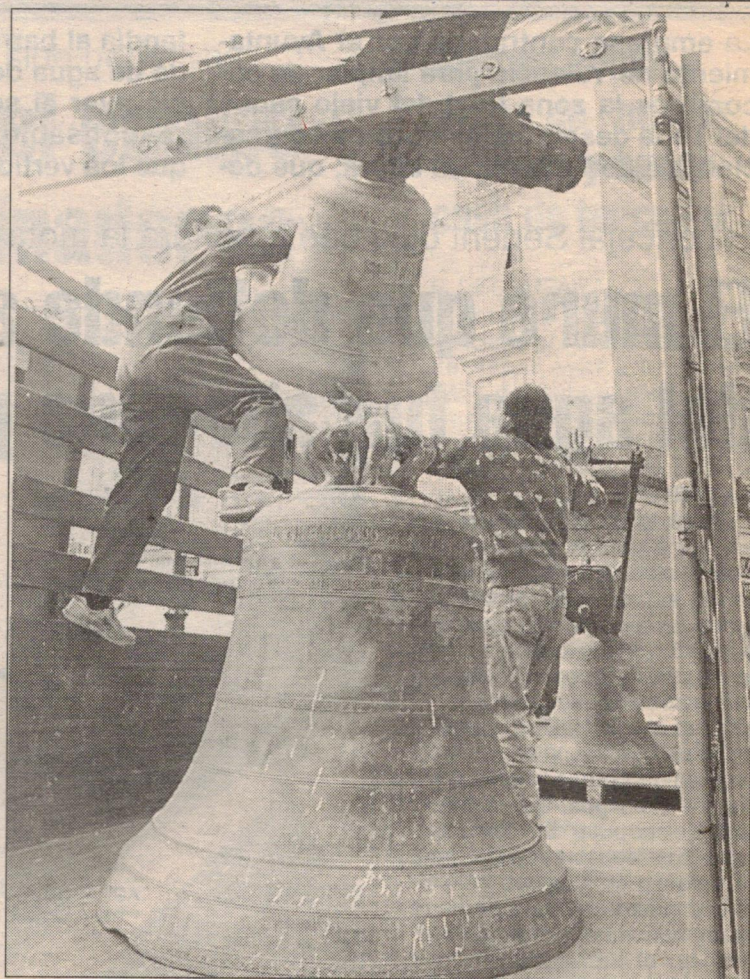
La bajada de las campanas fue muy espectacular.