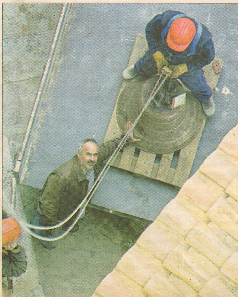
La campana mediana fue izada desde la plaza de la catedral