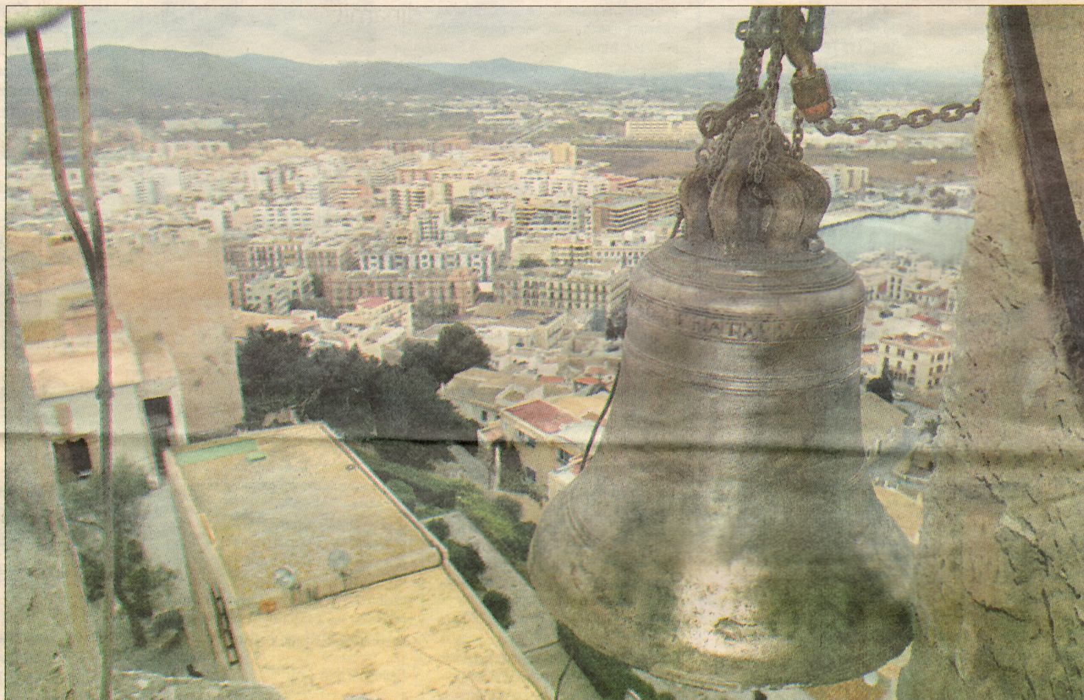
La campana fue subida al campanario ayer por la mañana y hoy quedará colgada en su emplazamiento original

Sin embargo, la empresa valenciana no solamente se ha ocupado de esta campana. Las ha motorizado todas y las ha conectado a un ordenador que permitirá que interpreten una cincuentena de sintonías. Además, las porciones de madera de encima de los yunques que el paso del tiempo ha ido pudriendo