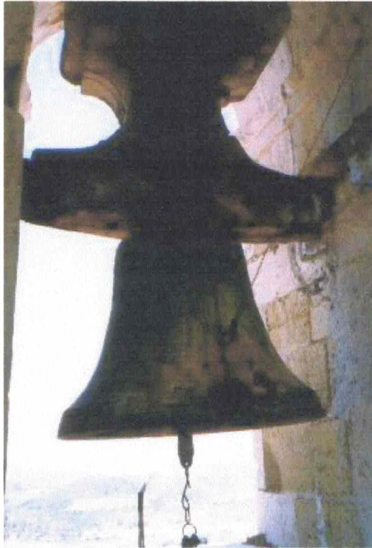
CAMPANA Nº 3 "PURÍSIMA" LA MAYOR 1165 MM DIÁMETRO Y 975 KG PESO APROX. FUNDIDOR: HIJOS DE VICENTE ROSES (Atzeneta DE ALBAIDA) AÑO DE FUNDICIÓN: 1906

Detalle de la maza que está anclada en el mismo yugo imposibilitando el volteo manual de esta campana.