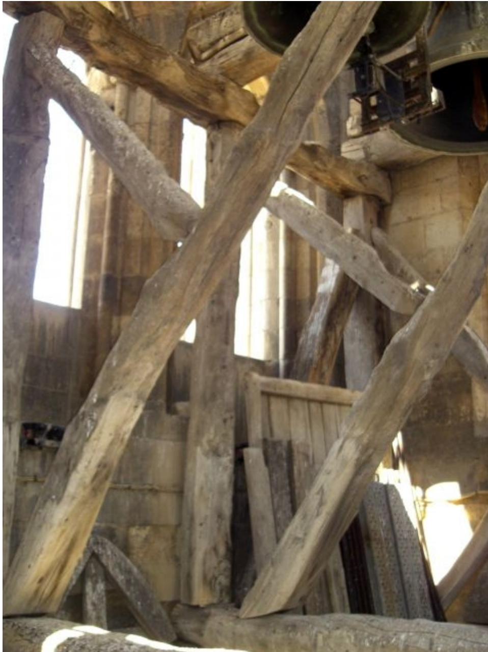
Interior de la sala de campanas (05-09-2006)

En la catedral hay que tocar, solo y exclusivamente, toques de catedral. Aún más, los toques propios de esa catedral que la distinguían de las demás por su armonía y ritmos propios.