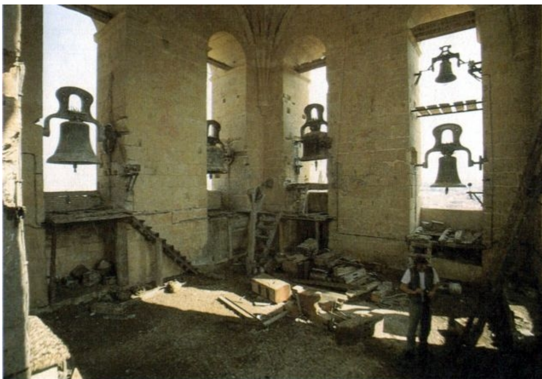
Estado de la sala de campanas, previo a la restauración arquitectónica