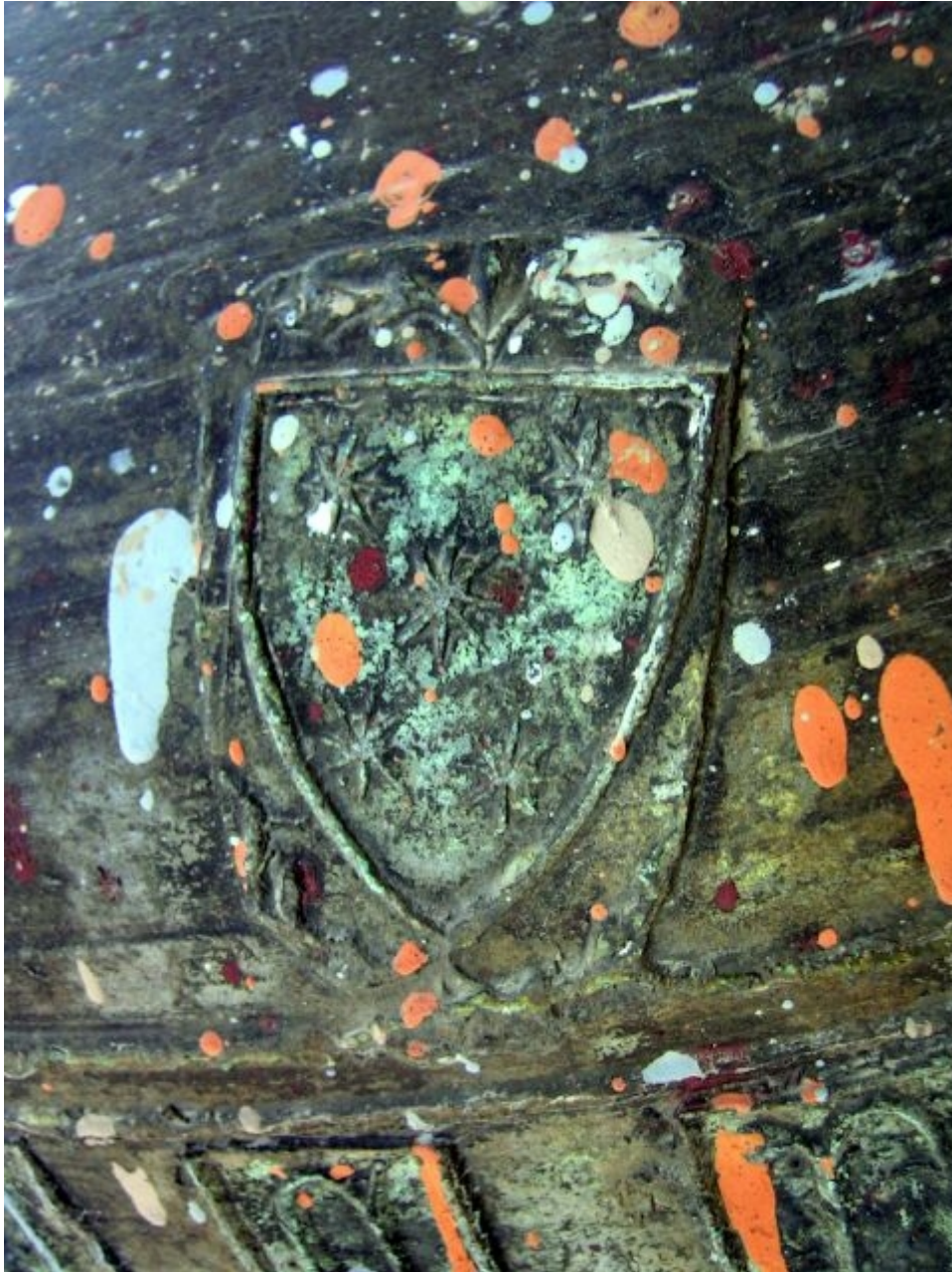
Campana de las horas (16-09-2005)

La catedral de Burgos tiene – o tenía – un complejo sistema de campanas, algunas muy antiguas, todas en estado de suciedad imperdonable, entre otras cosas porque cuando cambian de color la estructura metálica interna, diversas gotas caen sobre los bronce.