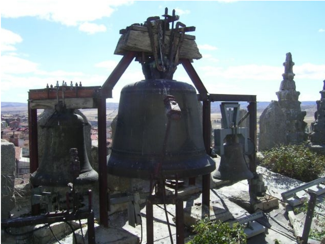
Estructura de las campanas de la terraza (10-09-2005)

Sobre todo sin partituras nuevas: simplemente recreando, improvisando, comunicando, todos unidos, todos diferentes.