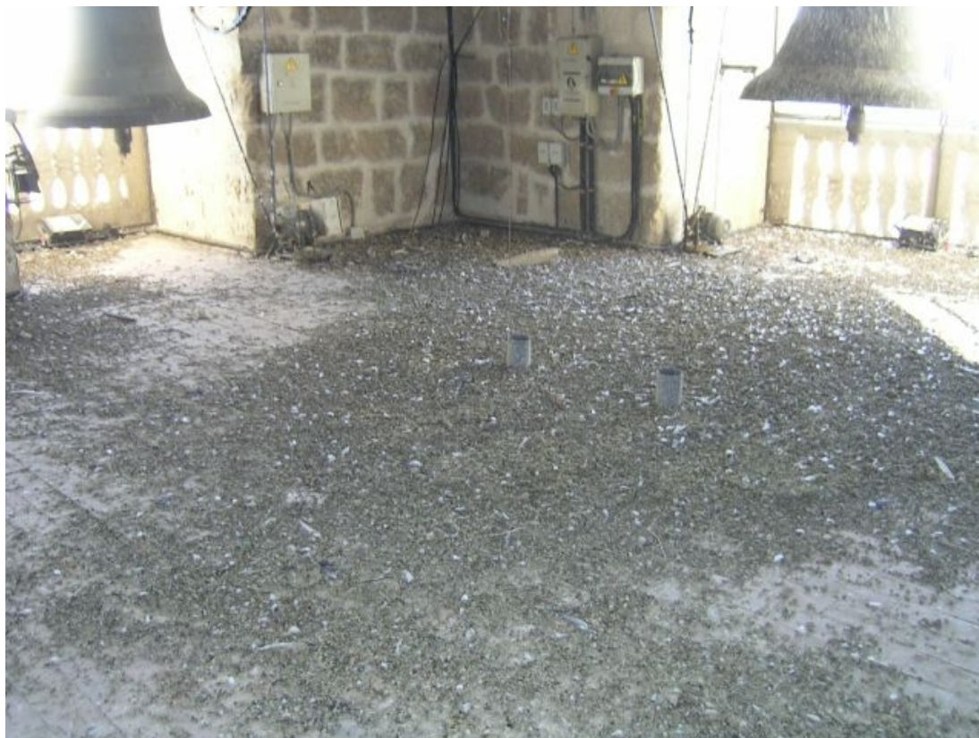
Conservación de la sala (15-09-2005)

menos antiguas, pero inaccesibles fueron las de la espadaña, las campanas de señales. Cuando documentamos esas campanas la sala era una inmensa jaula, pues aquello que en teoría protegía contra las aves, tenía muchos agujeros, y permitía su paso y anidamiento. Todas las campanas menos la mayor podían voltear sin problemas tras la red de protección, lo que es una sabia medida, pero para tocar la mayor, incluso mecánicamente, era preciso abrir las puertas de la rejilla. Nos preguntamos si históricamente esas campanas volteaban o solamente oscilaban como fue habitual en las demás catedrales castellanas hasta la muy reciente llegada del volteo.