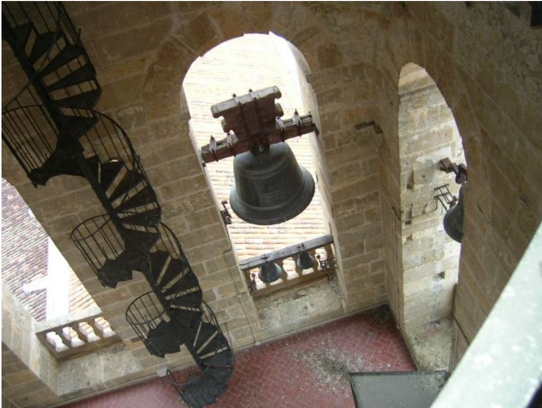
Interior de la sala de campanas de Ciudad Rodrigo (11-09-2005)

facilidad a las campanas del reloj, por una escalera de gato exterior. Pero, como es habitual, no habían intervenido apenas en las campanas, sólo añadiendo electromozos externos a alguna de ellas.