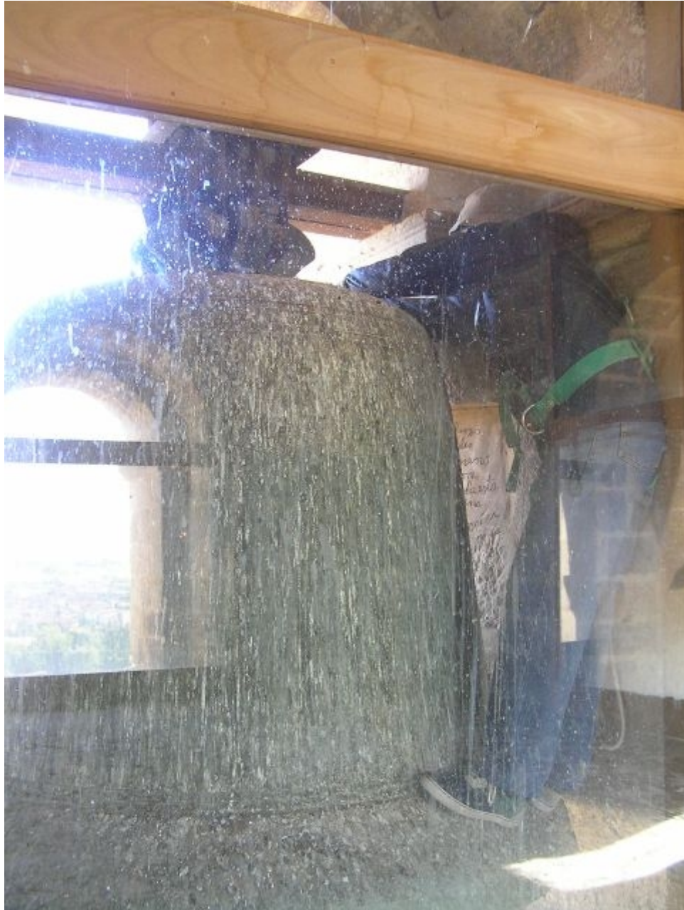
Penosa documentación de las campanas, sucias y aisladas con cristales (13-09-2005)