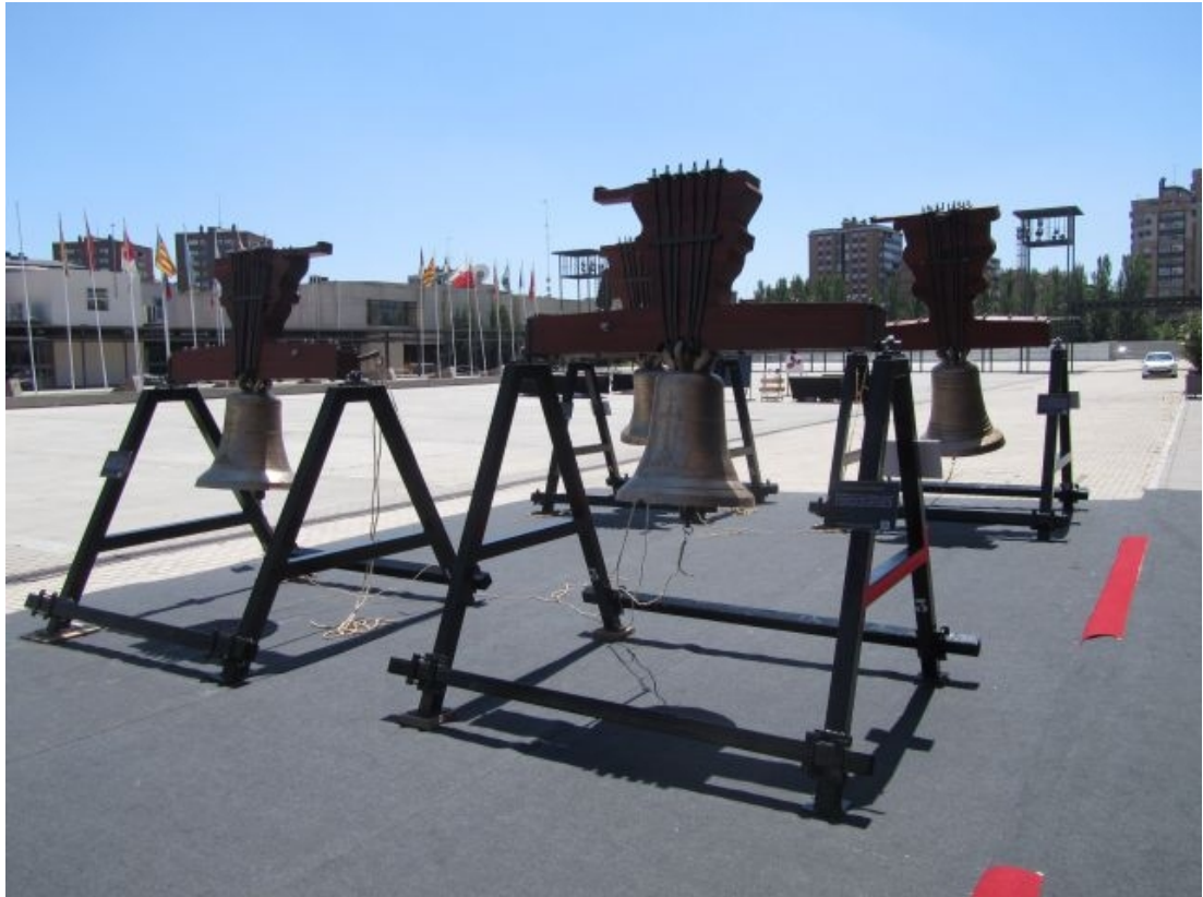
Las campanas restauradas en la feria ARPA de Valladolid (24-05-2012)