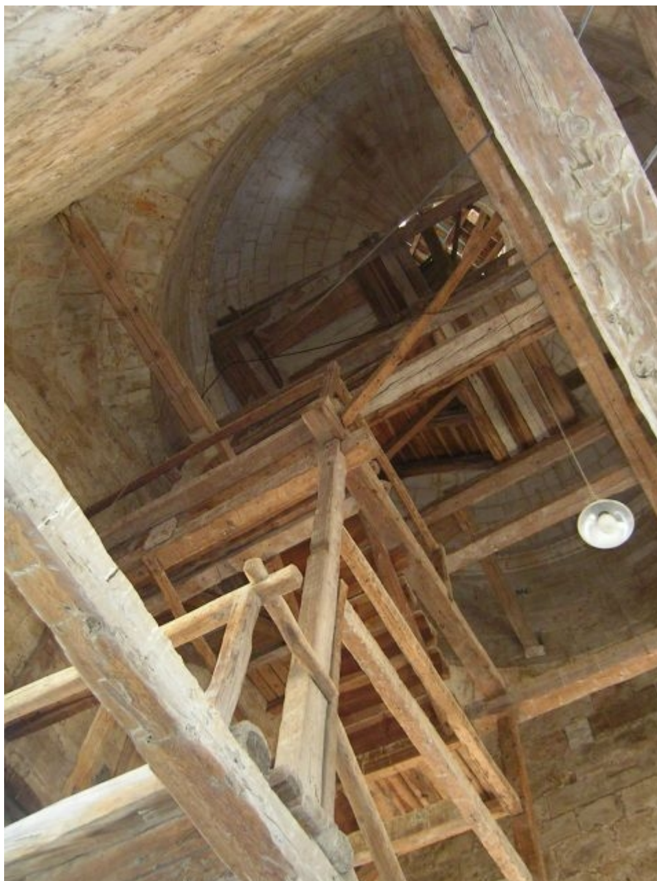
Estructura interior desaparecida en las reformas de 2008. (02-09-2005)

En la reforma arquitectónica de 2008 desaparecieron la mayor parte de los valores patrimoniales de la torre. No solo quitaron la estructura de acceso a las partes altas, sustituyeron todos menos uno de los históricos e historiados yugos, mecanizaron las campanas poniendo a volteo las que solo oscilaban, o inmovilizando las que volteaban. Y aún más, al quitar el acceso a las campanas del reloj, ahora tocan horas y cuartos las campanas litúrgicas.