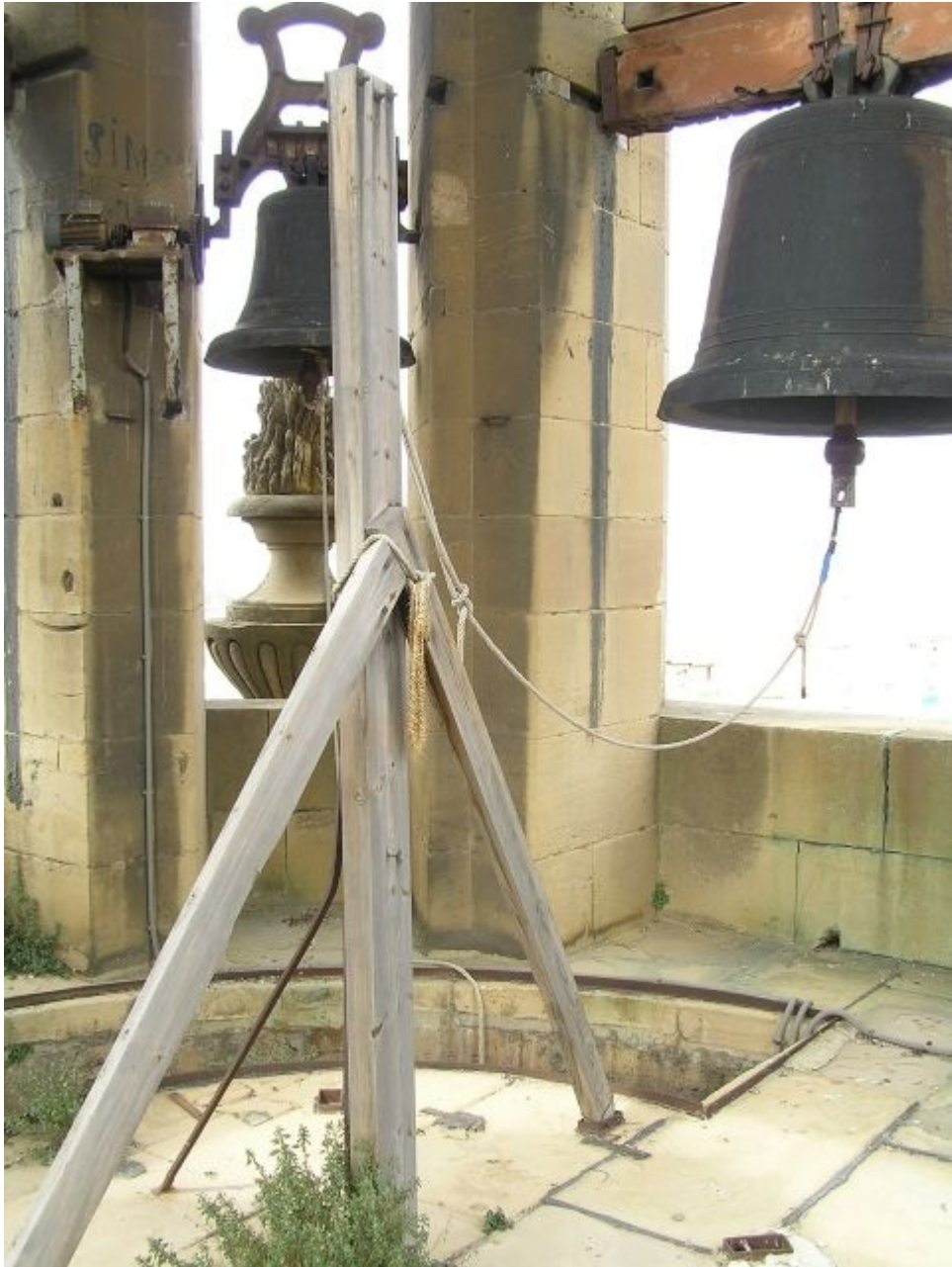
Conservación de la sala – Catedral de Pamplona (06-09-2005)