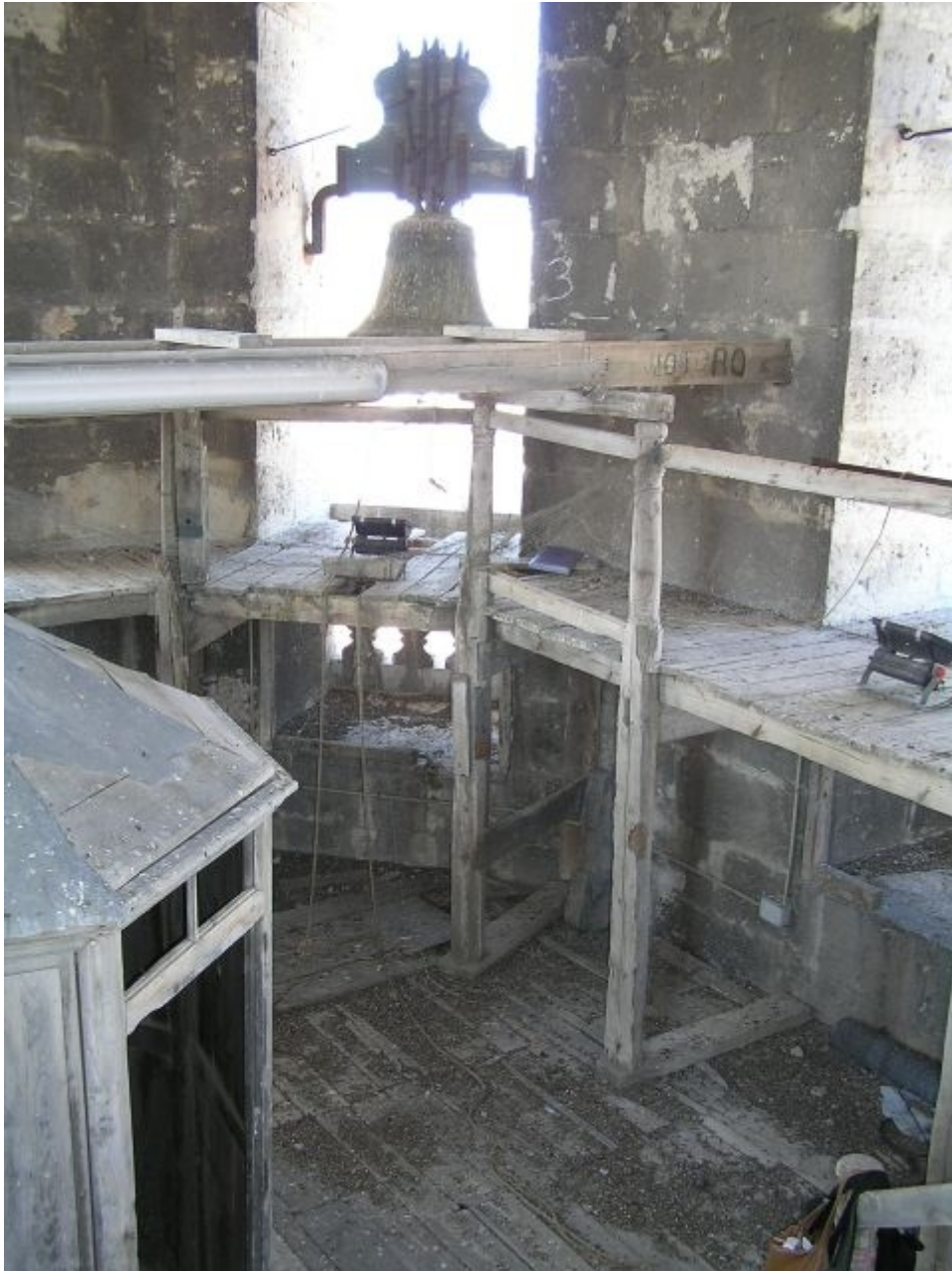
Estructura de tarimas para tocar manualmente las campanas (14-09-2005)

Documentamos un par de veces las campanas de la Catedral. Un lugar mágico, lleno de escaleras, tarimas de madera, algunas campanas con extraños yugos de madera y hierro, posiblemente instalados a final del XIX, y una tradición muy diluida. Parece que ahora está abierto al público.