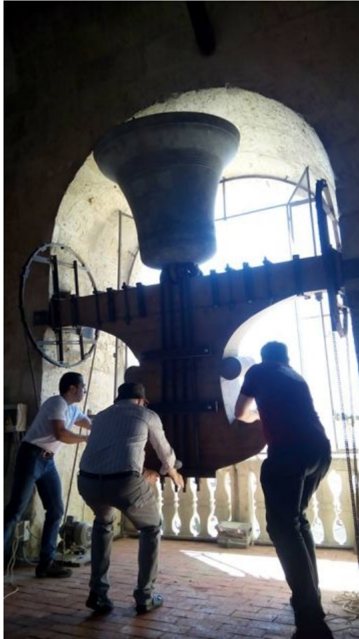
Tocando las campanas de la catedral - I Encuentro de Campaneros "Ciudad de Palencia"