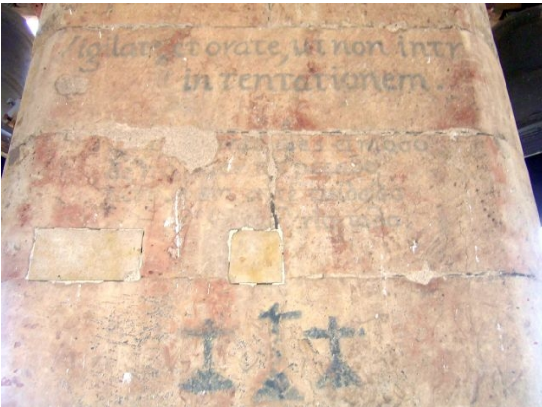
Grafitos en los muros (12-09-2005)