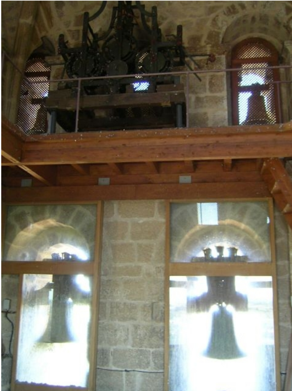
Cara norte de la segunda planta (13-09-2005)

dicho estaban porque en una de las más brillantes intervenciones arquitectónicas tras cada campana de las mayores y medianas hay un vidrio con tres espectaculares resultados: los sonidos no se mezclan, porque hay una barrera tras la campana; las campanas están cubiertas de excrementos hasta niveles increíbles, porque el vano cerrado por detrás no sólo deja las campanas expuestas a las aves sino que ofrece un lugar de anidamiento relativamente protegido en la dura climatología zamorana; finalmente, las campanas inaccesibles, no sólo no se pudieron documentar (incluso las góticas...) sino que son totalmente imposibles de tocar manualmente e incluso con gran dificultad para acceder a ellas para su mantenimiento.