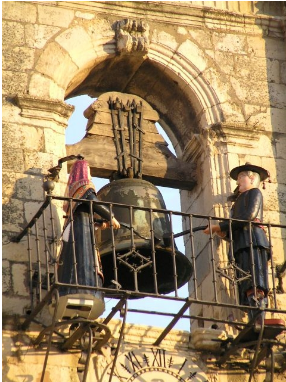
Los tardones o autómatas del reloj - Ayuntamiento de Astorga (16-07-2006)

Y finalmente los tardones – palabra antigua – o autómatas, de los que apenas quedan media docena en toda la península, y entre ellos cuatro o cinco en Castilla y León. Ciertamente los hay en Europa, seguro que los hubo por aquí, pero precisamente en estas tierras no sólo perviven sino que conviven, cada día, con las campanas de relojes municipales o catedralicios.