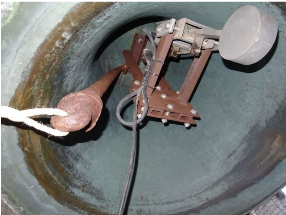
Electromazo interno y badajo provisional para el concierto (30-03-2019)

La torre de la Catedral tiene, en el interior de la sala de campanas, un pilar de piedra que sirve de soporte, frente a otro pilar adosado al muro, para las dos campanas más pequeñas del conjunto. El pilar exento sirve también de base para un conjunto de vigas de madera, con cojinetes y marcas de aceite, que pudieron servir de base a las matracas, ahora inexistentes. Las campanas tienen, en la parte interior, sendas redes, que no impiden el paso de las aves, pero que no solo dificultan el acceso a las campanas, sino que imposibilitan su balanceo tradicional. Alguna fotografía antigua atestigua que esas campanas quedaban invertidas entre toque y toque, sin llegar a voltear.