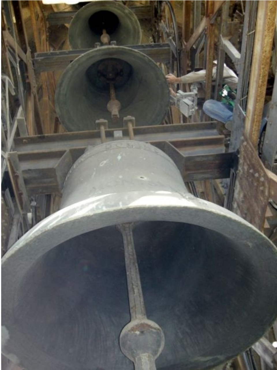
Electrificación GUIXÀ – Catedral de Barcelona (27-09-2007)

Las torres se llenaban de escombros: cuando hacían – y siguen haciendo – una intervención, a menudo los restos no sólo de la fábrica sino también de mecanismos anteriores no siempre obsoletos, son dejados en su sitio y sustituidos por otros puestos al lado.