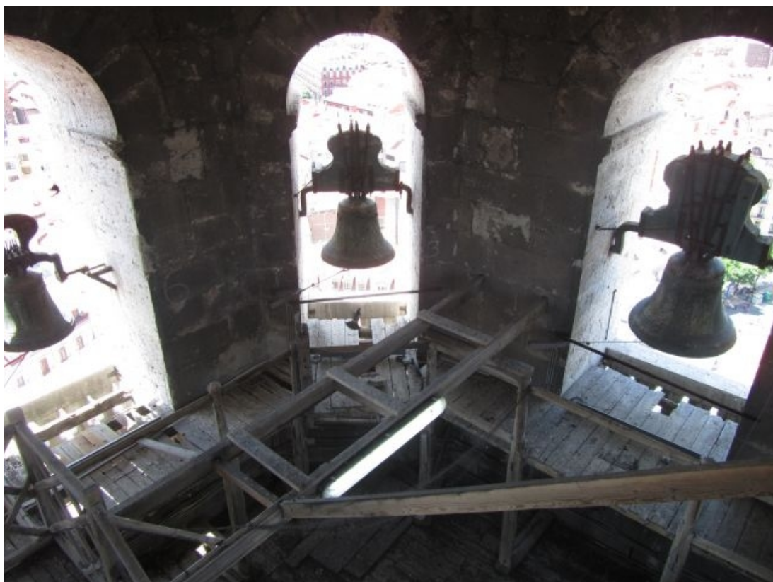
Conservación de la torre tras la peculiar mecanización ( 27-05-2012)

En 2012 se habían mecanizado las campanas mediante un peculiar sistema local de aire comprimido que tira de los badajos, y es gestionado mediante un complejo sistema de pulsadores e interruptores. La idea no es mala, pero no está pensado para complementar los toques manuales sino para sustituirlos, sin actuar en las instalaciones ni en la conservación. Incluso, en alguna campana, en vez de tirar del badajo propio de hierro, se ha instalado otro más ligero, de caña plástica y bola metálica, para los nuevos toques automáticos.