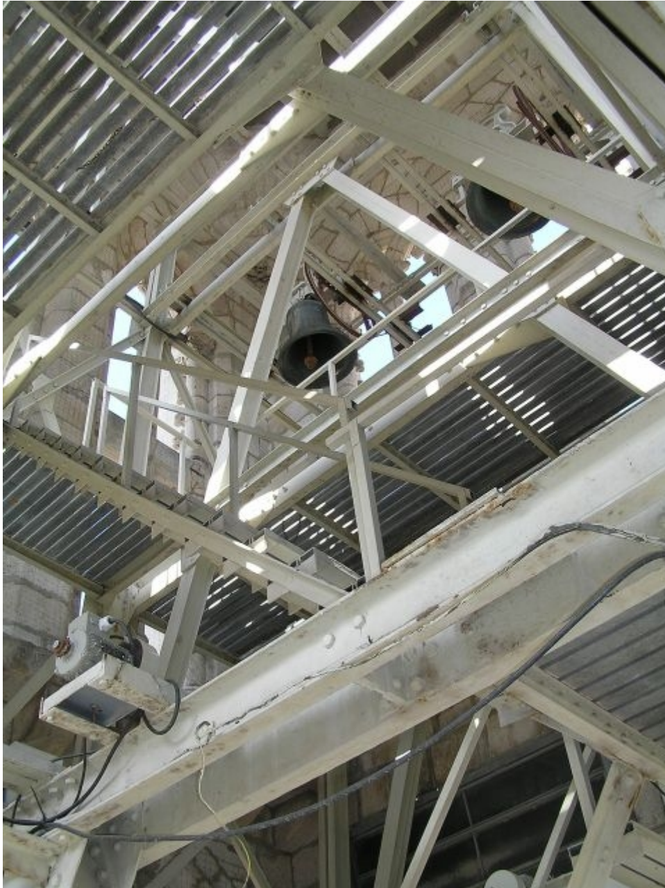
Estructura metálica interior de la torre este (16-09-2005)

Otro claro ejemplo de destrucción patrimonial. En algún momento del siglo XX sustituyeron, suponemos que para evitar incendios, la estructura de madera interior de ambas torres así como la totalidad de melenas por otras metálicas. El cambio de madera por acero tiene un resultado absolutamente negativo en la acústica de la torre. No es habitual que las campanas estén repartidas en ambas torres, pues por acústica y por simbolismo suelen estar en una torre, generalmente