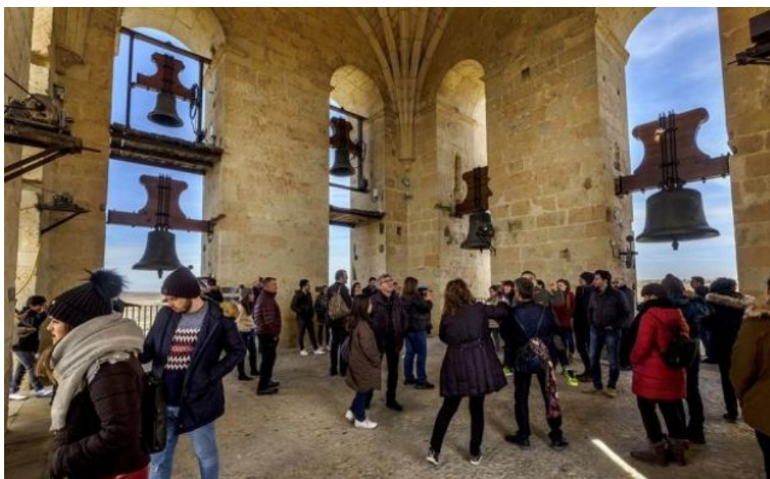
Visitantes en el campanario de la Catedral - (04-10-2019)