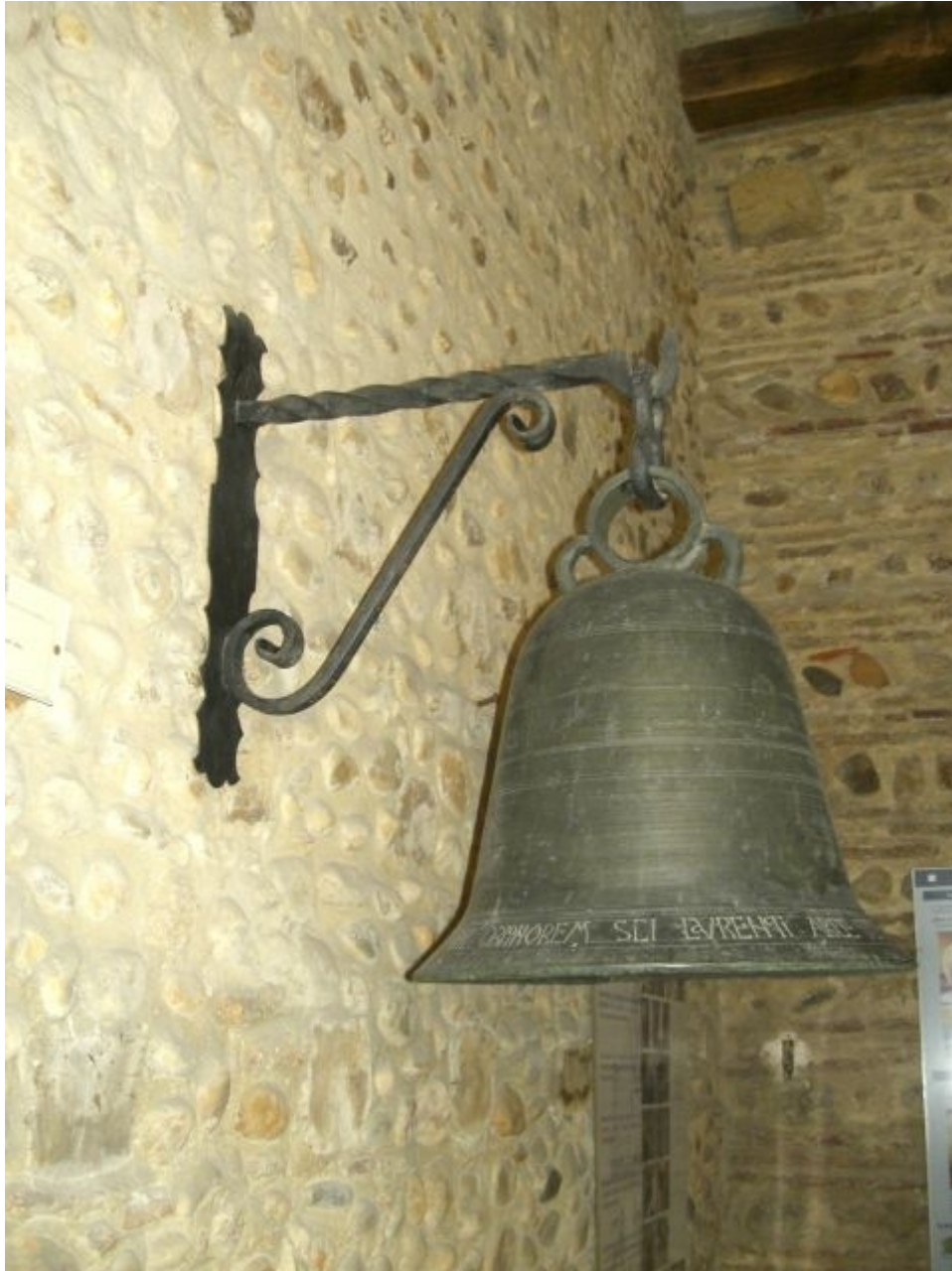
Campana de 1086 – San Isidoro de León 8 (18-07-2006)