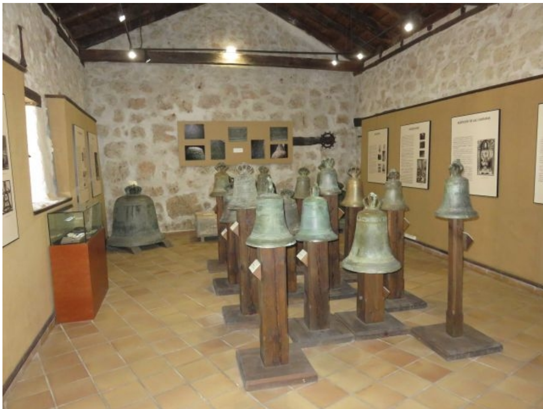
Interior del museo de Urueña (21-08-2016)

La campana de San Lorenzo, de San Isidoro de León es la más antigua datada 9 (1086). En cualquier caso la campana de León va asociada a un Panteón Real, no sólo un lugar de prestigio sino de aquellos que pueden permitirse la última tecnología, también en campanas. No tenemos campanas datadas conocidas anteriores, y las pocas existentes en Europa, sobre todo en Italia, son del mismo siglo, quizás de unos años antes, lo que desmonta leyendas de campanas anteriores, tanto aquellas míticas trasladadas de Santiago a Córdoba, en un viaje de ida y vuelta, como aquellas más legendarias encontradas protegiendo a imágenes de la Virgen y escondidas al principio de las invasiones musulmanas... En mis tierras valencianas hay unas cuantas Mare de Déu trobades esto es Vírgenes encontradas debajo de campanas. En el momento de la conquista cristiana no hablan de tales prodigios sino mucho más tarde, en el momento de la expulsión de los moriscos, a principios del XVII, cuando tenían que demostrar que eran cristianos viejos . Las pocas campanas del siglo del siglo VIII o anteriores son apenas campanas de mano, de escaso tamaño y peso.