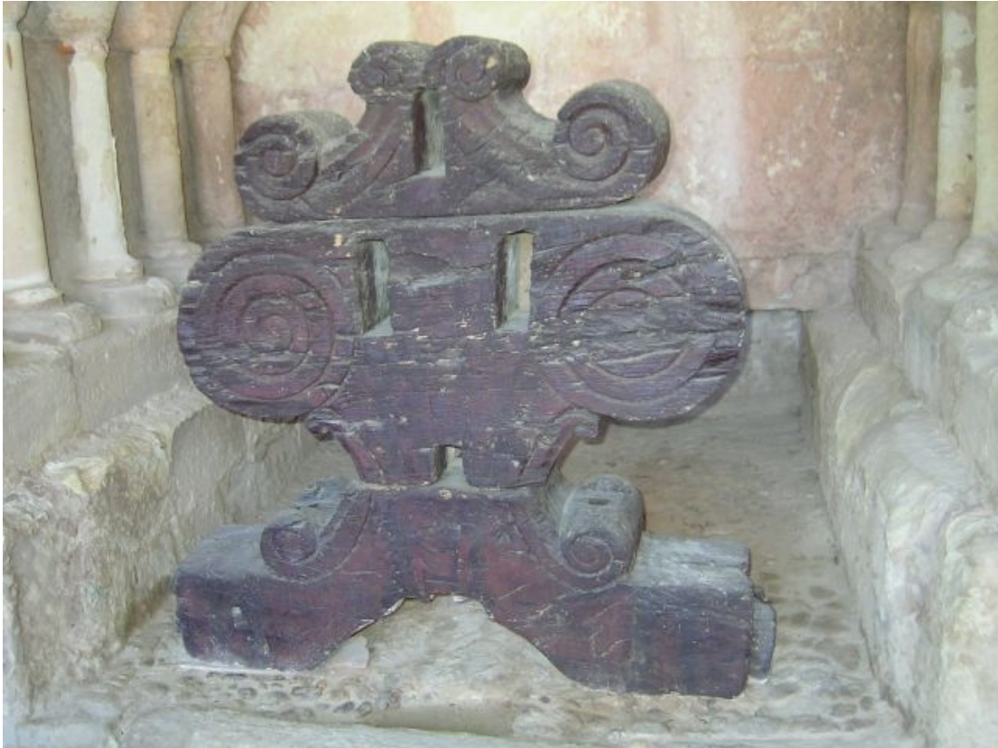
Melena antigua. expuesta en el claustro (14-07-2005)