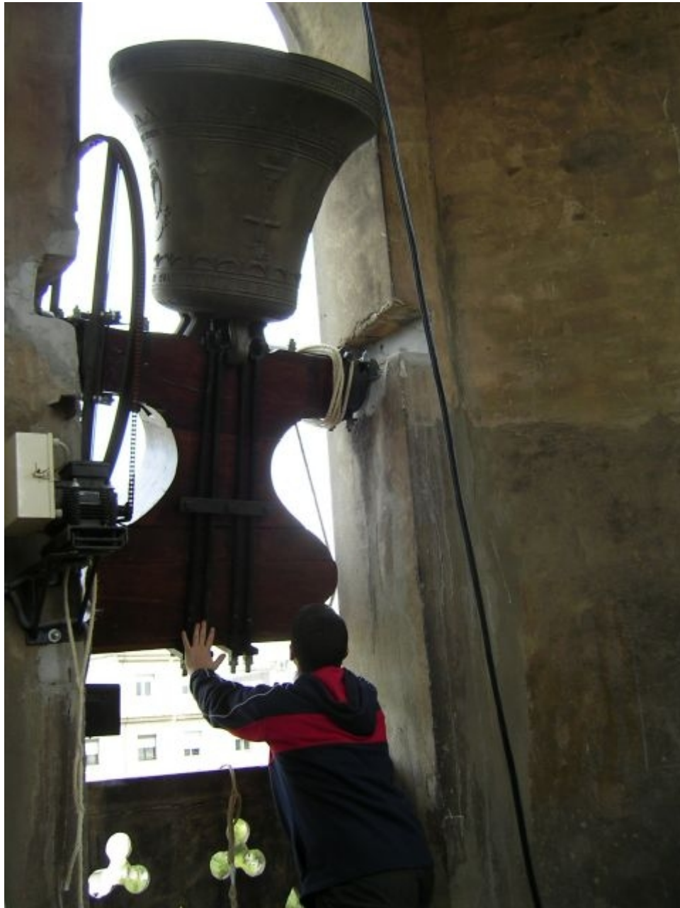
Sant Josep de la Muntanya de València (02-05-2004)

Restaurar quiere decir recuperar los valores originales de un elemento patrimonial. O mejor aún, hacer presentes esos valores, a menudo perdidos, a través de una correcta restauración que permita darles un significado y un uso para