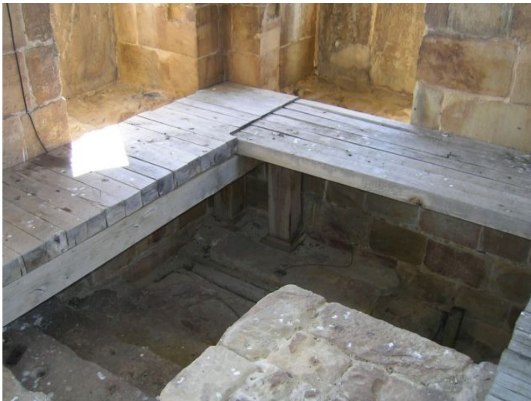
Nuevas tarimas de madera (14-07-2005)

Se conservan las melenas sustituidas, en el claustro, en bastante buen estado. Sorprende la variedad de formas, la decoración siempre diferente, que no tienen igual en ninguna otra diócesis.