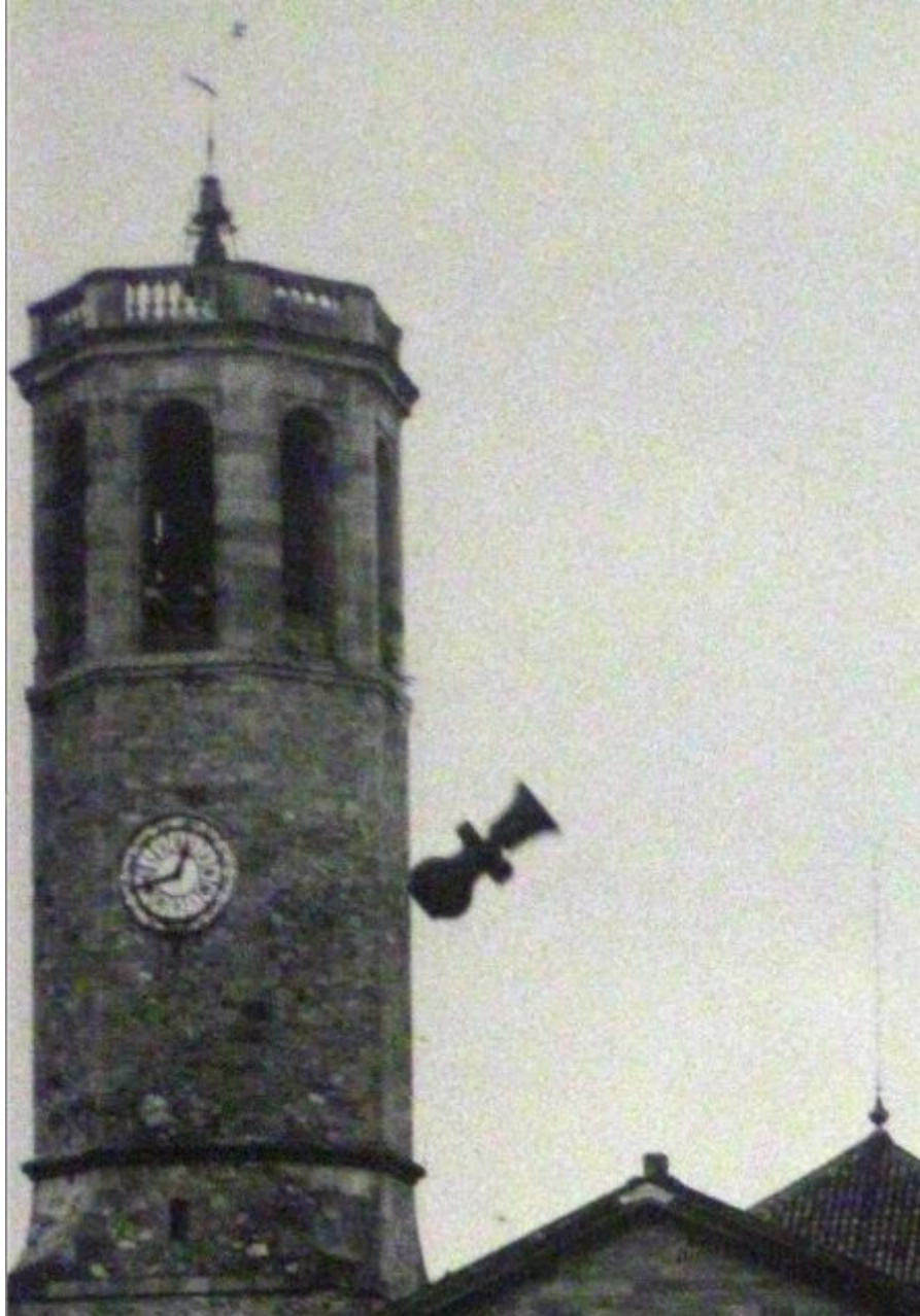
Campana lanzada por los milicianos desde el campanario - Sant Vicenç de Sarrià de Barcelona (1936)

Precisamente porque tenían claro que el tiempo era de gestión pública y no eclesial, durante la guerra civil, las campanas y relojes en Catalunya eran mantenidos en la torre, mientras que las campanas litúrgicas se lanzaban al vacío.