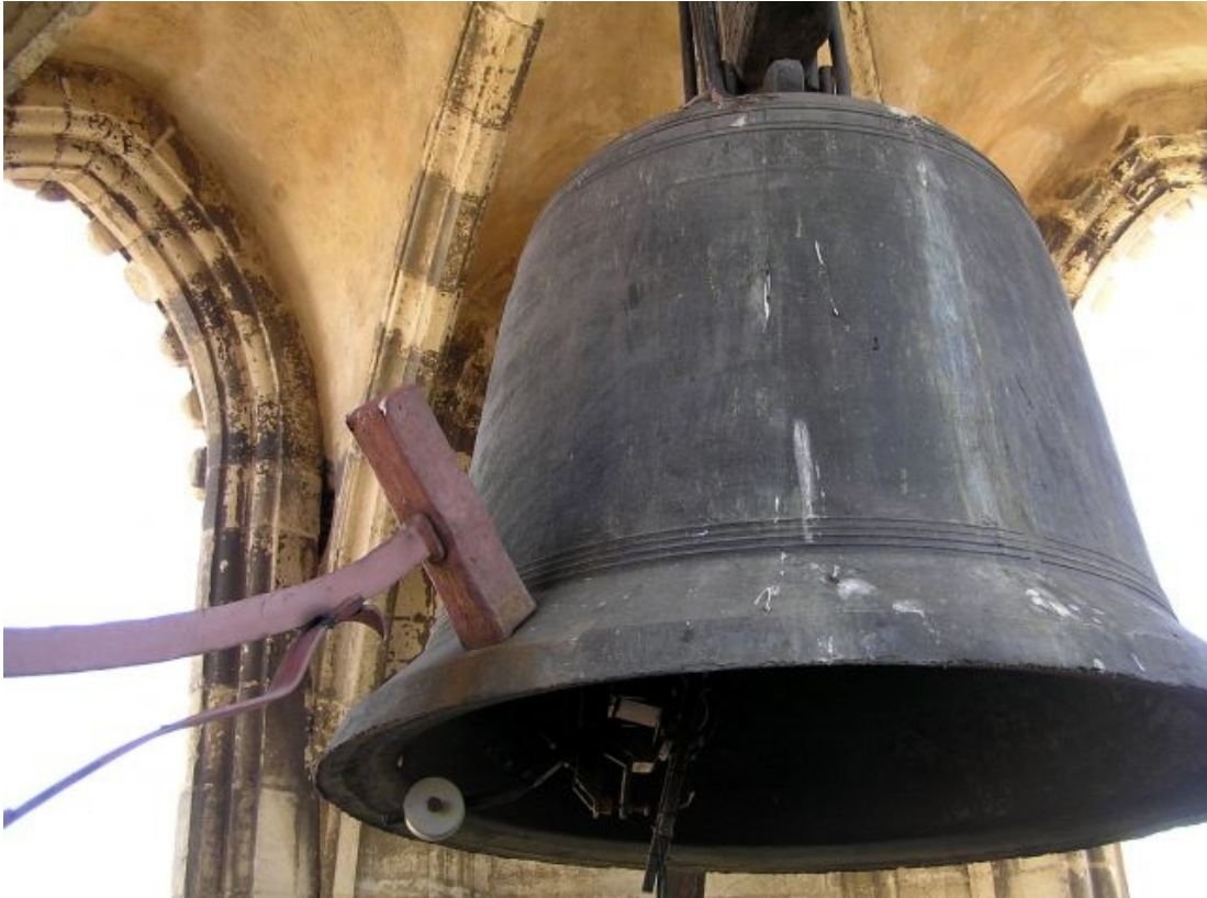
Campana romana – Horas Catedral de León (05-09-2006)

Tres son las aportaciones de Castilla y León a la cultura mundial de las campanas: dos únicas y una con muchas representaciones fuera de nuestras fronteras pero escasa por aquí.