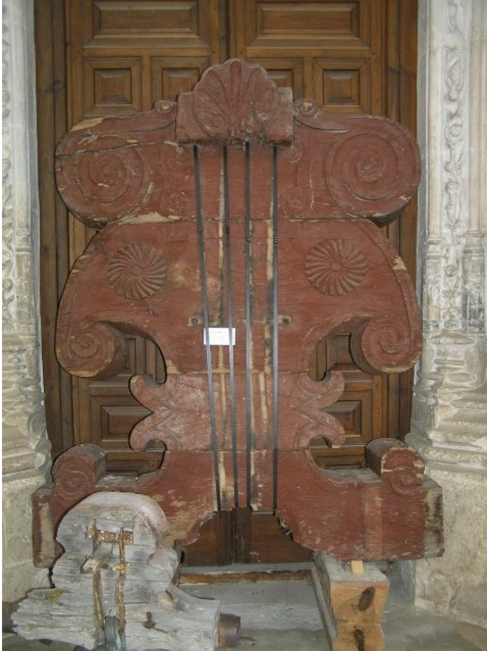
La melena de la campana de las Ánimas (30-03-2010)

Hay que recordar que las dos principales aportaciones de la cultura castellano leonesa al mundo de las campanas son las romanas y las melenas, dignos de la mayor protección por encontrarse en vías de sustitución.