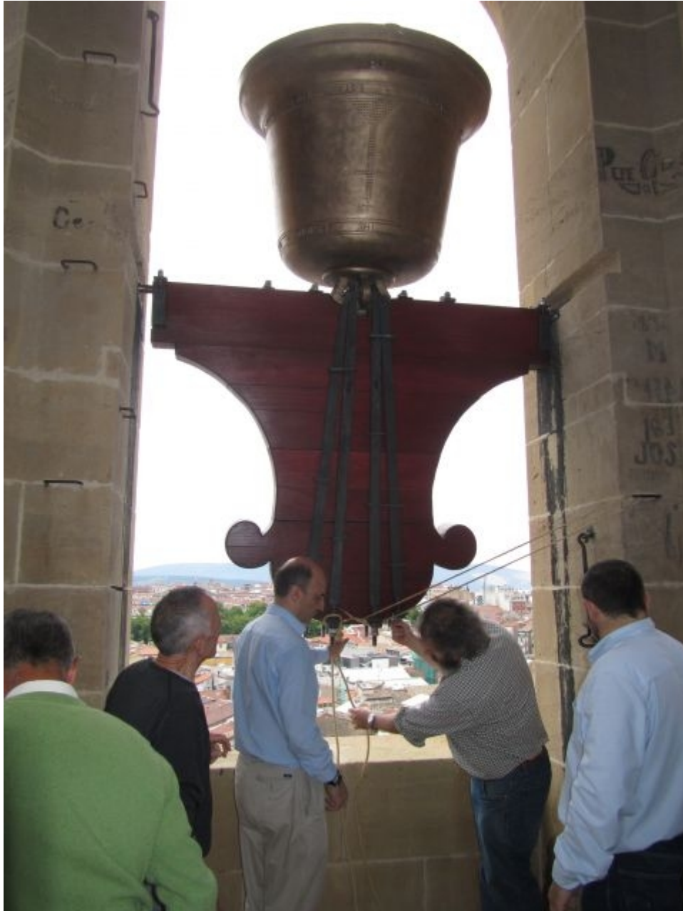
Curso de Campaneros – Catedral de Pamplona (12-06-2011)