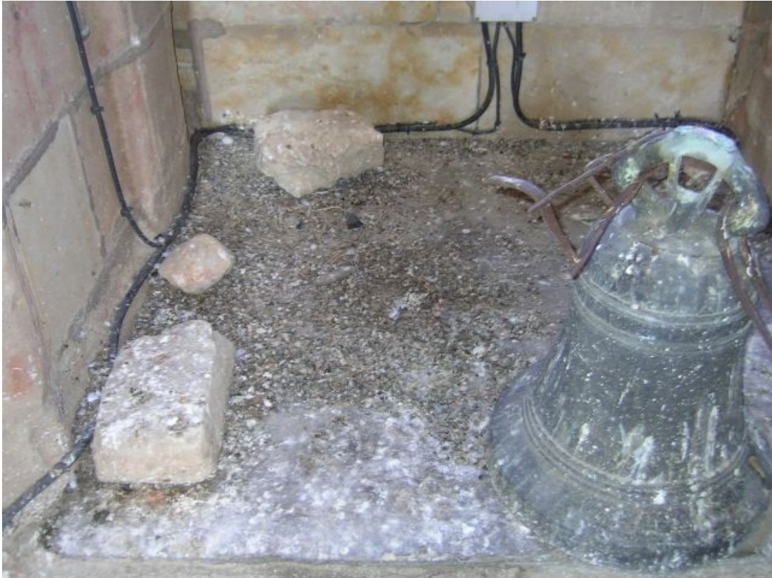
Conservación de la sala y campana gótica (12-09-2005)