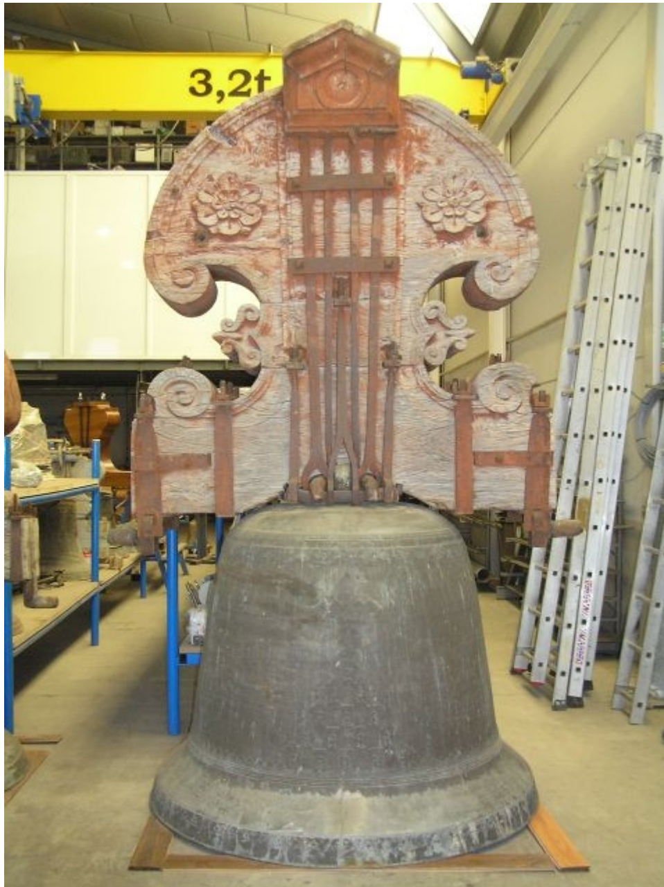
Melena - Campana mayor Catedral Burgo de Osma (18-12-2008)

Y otro tanto ocurre con las melenas, sobre todo las de la diócesis de Osma – Soria, que son seguramente los más decorados y bellos de toda la Cristiandad. Cuando se ven sustituidos por unas vigas de hierro – que durarán pocos años, por rotura o corrosión – el alma se estremece... y el oído también, ya que los yugos metálicos, a pesar de sus defensores, destrozan los distintos parciales de la campana, metalizándola y transmitiendo parte de sus armónicos a la fábrica de la torre.