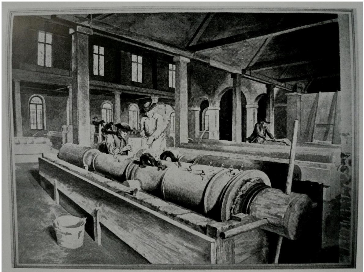
Tekening Pieter Verbruggen over Geschutgieten, blz 76 van Klokken en Klokkengieters, Comm.Ned.Klokkenspel-Ver, 1963.