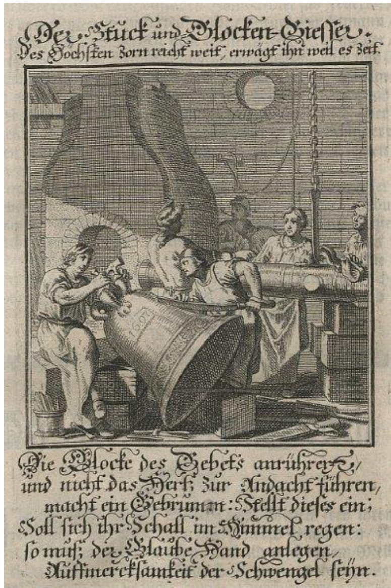
Klokgieter, van internet.