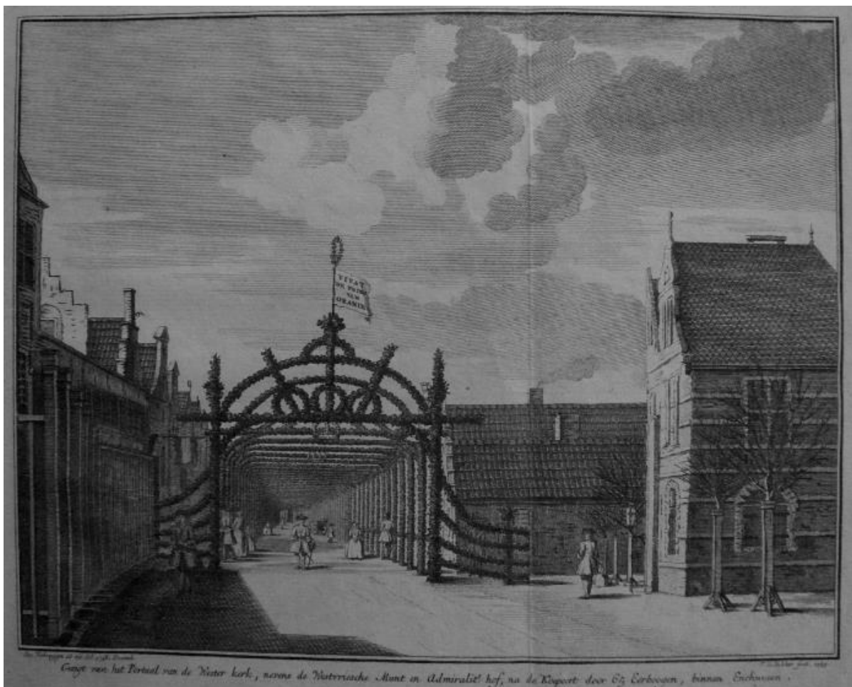
Tekening van Jan Verbruggen, in Enkhuizen Verheugt, 1748.