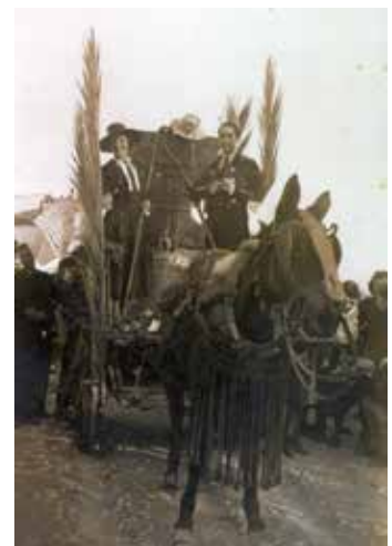
Arribada i pujada de les campanes, any 1941.