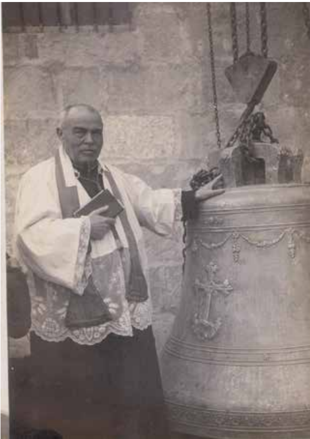
Benedicció de la campana Bertomeua, any 1942.

Aquest acord municipal significa que en 1941 es van fondre, per la foneria dels Germans Roses (Silla, València), 3 noves campanes, aportant les dues campanes conservades a la torre, per ser refoses i aprofitar el bronze. Eixes 3 noves campanes són les actuals Victòria i Sebastiana (les que va pagar l'ajuntament), a més de l'antiga Mariana (apadrinada per Mariana Cholbi Calabuig), que va ser refosa de nou dues dècades més tard. Coneguem algunes fotografies del moment de l'arribada i pujada de les campanes, tot un espectacle en aquell temps, i també per a ulls actuals.