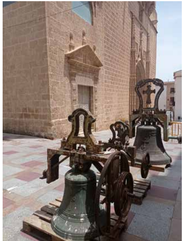
Baixada de les campanes per ser restaurades, 20 de juny de 2023.