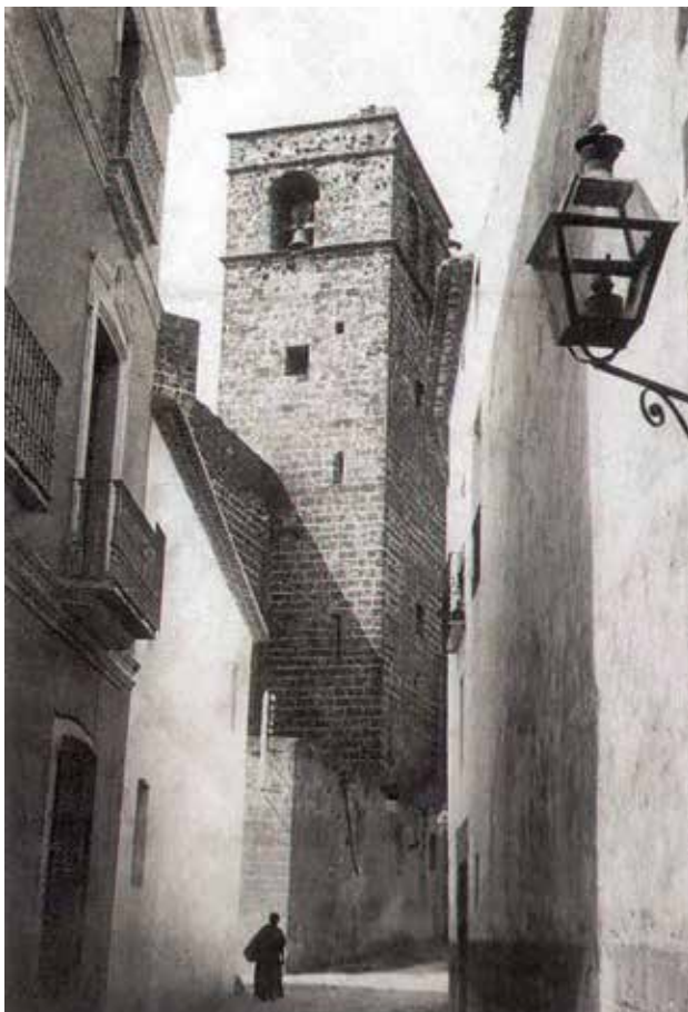
El campanar a finals del segle XIX, encara amb les campanes amb truja de fusta.