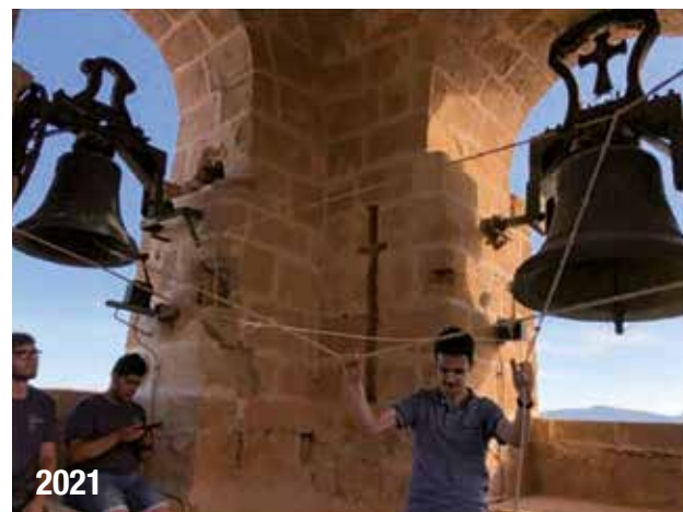
Foto comparativa 2007-2021 de la sala de campanes abans i després de la restauració, que va retirar el terra postís de fusta.

La restauració consistirà a tornar a instal·lar truges de fusta, que no només milloren estèticament les campanes sinó que, especialment, milloren la seua acústica, ja que està comprovat que la fusta absorbeix les vibracions més desagradables de la campana, mentre que les truges de ferro actuals les potenciava. A més, la nova mecanització no impedirà que el toc de les campanes es realitze de forma manual per part de campaners. I també dins de la restauració, està previst recuperar el so de les antigues batzoles o matraques, instrument de fusta prou estès en altres temps, però molt oblidat en l'actualitat, i que serveix per marcar el dol del Divendres i Dissabte Sants (l'existència de les batzoles està documentada a Xàbia des del 1769, a la Consueta del Sagristà).