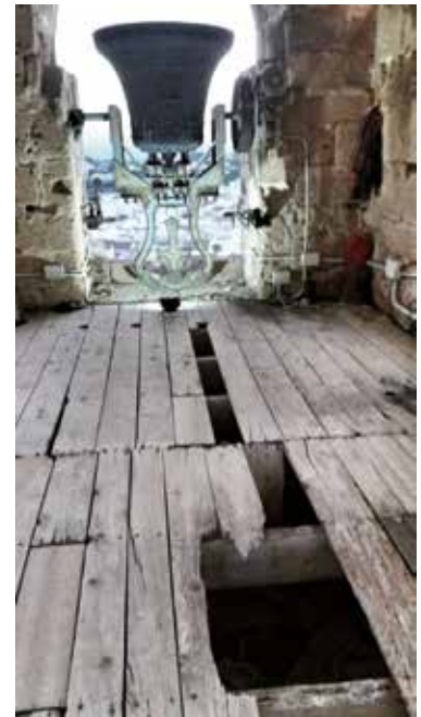
Estat de conservació del terra de fusta, any 2017.

l des del 1963, les nostres quatre campanes, Victòria, Sebastiana, Mariana i Bertomeua, només ham conegut l'envelliment d'aquestes instal·lacions que, segurament, eren la millor tecnologia del moment però que han tingut (no només a Xàbia sinó als centenars de campanars on també s'hi van instal·lar) conseqüències negatives, fins i tot per al propi campanar: