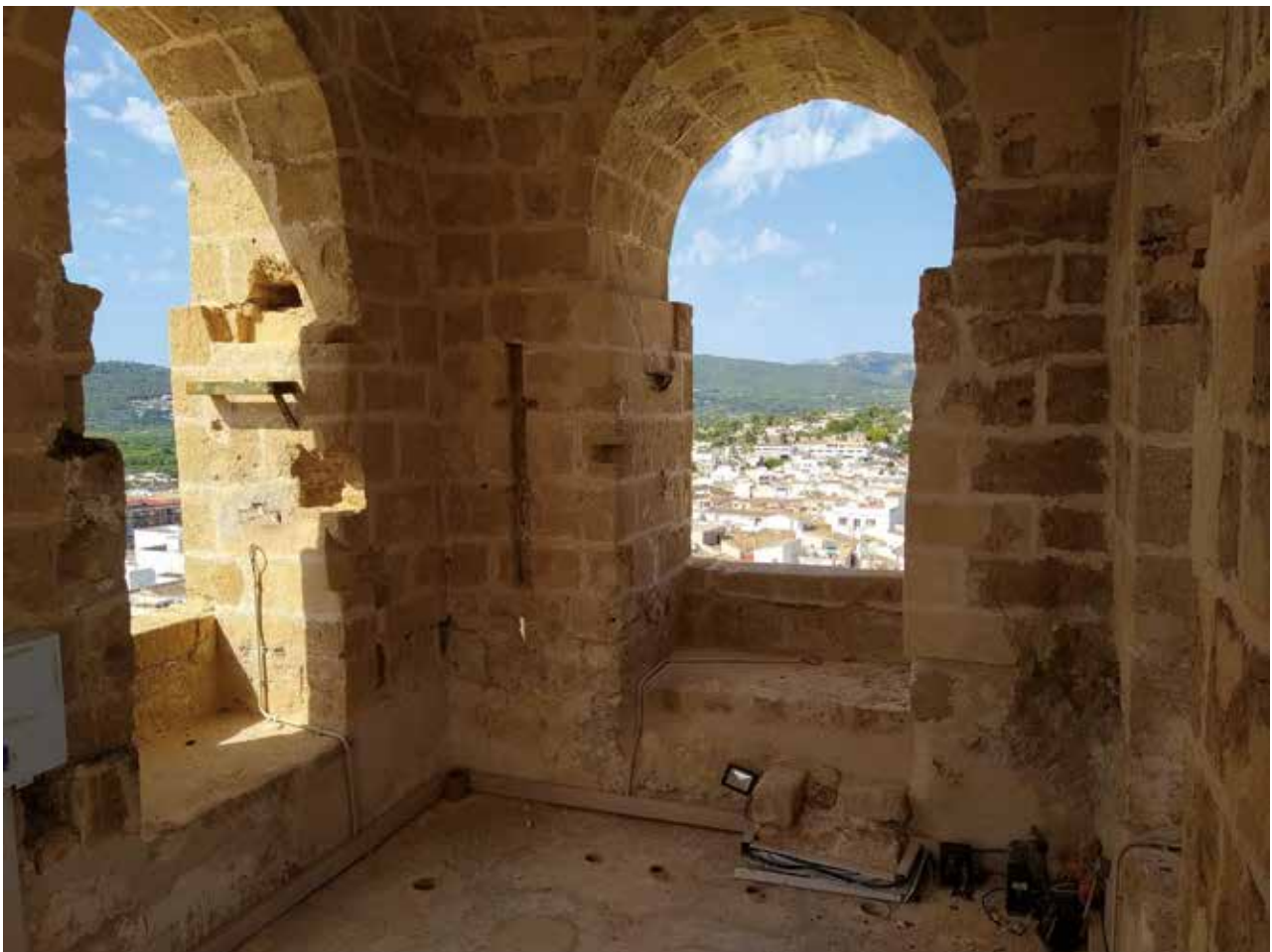
La sala de campanes buida, 20 de juny de 2023.