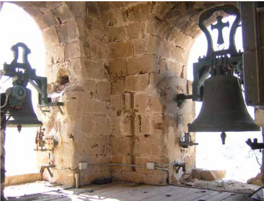
Sala de campanes, any 2004.