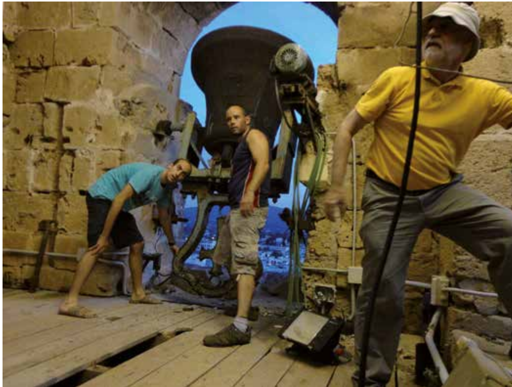
Concert de campanes, any 2012.