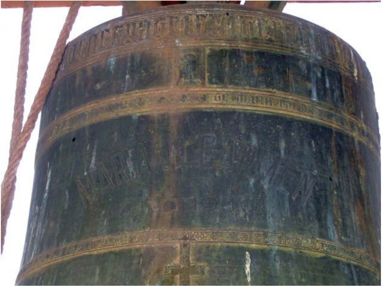
Campana recuperada con una inscripción inscrita “María del Carmen Año 1940” en una campana de inscripción gótica del flamenco Jan Van Het Eynde (Johannes a Fine) de 1504 – Parròquia de la Santíssima Creu – València – Autor foto: Francesc Llop i Bayo (2004)