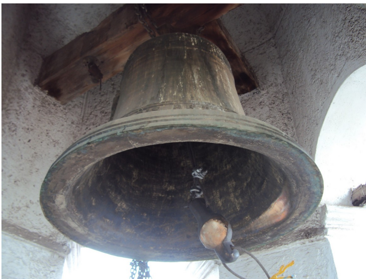
Santa Clara de Asís (campana mayor)