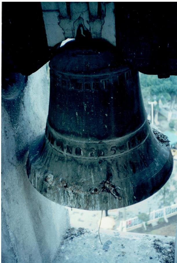
Santa Cruz (esquila de volteo)