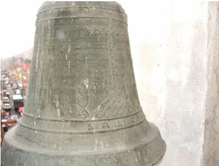
Santa Clara (campana menor) y Santa Cruz

Diámetro 70 cm Fundidor Desconocido Fecha 1817