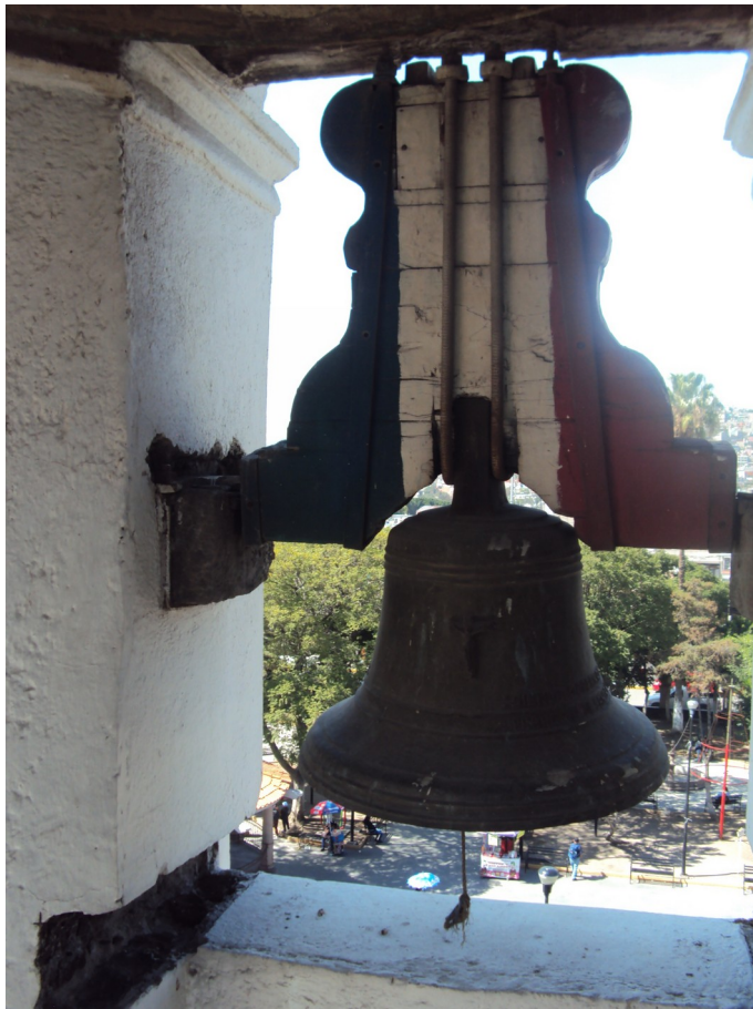
Virgen de Guadalupe (esquila de volteo)

Diámetro 62 cm Fundidor Desconocido Fecha 2006