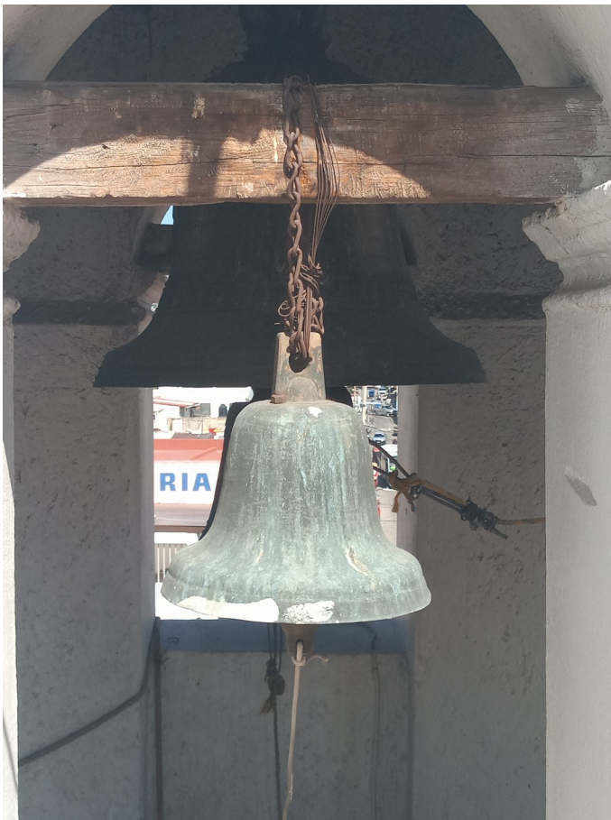
Santa Clara (campana menor)

Se localiza en el primer cuerpo de la torre del campanario, lado norte. dos líneas horizontales paralelas en alto relieve enmarcan el texto "AÑO 1817" y debajo de ella (lado este) se observa un anagrama de Jesús "HL" en el lado oeste tiene inscrito la fecha de 1817 y abajo una "R" invertida y una V encima otra V invertida. en el cuerpo o parte media, en el lado sur de la campana se ubica una cruz decorada con flores en forma de rombos, descansando sobre un altar de forma de triángulo o pirámide decorada con el mismo diseño. Flanqueado el altar por palmas. y en la parte inferior, dos líneas horizontales paralelas enmarcando el texto "SANTA CLARA". Actualmente es la más antigua que existe en la torre del campanario.