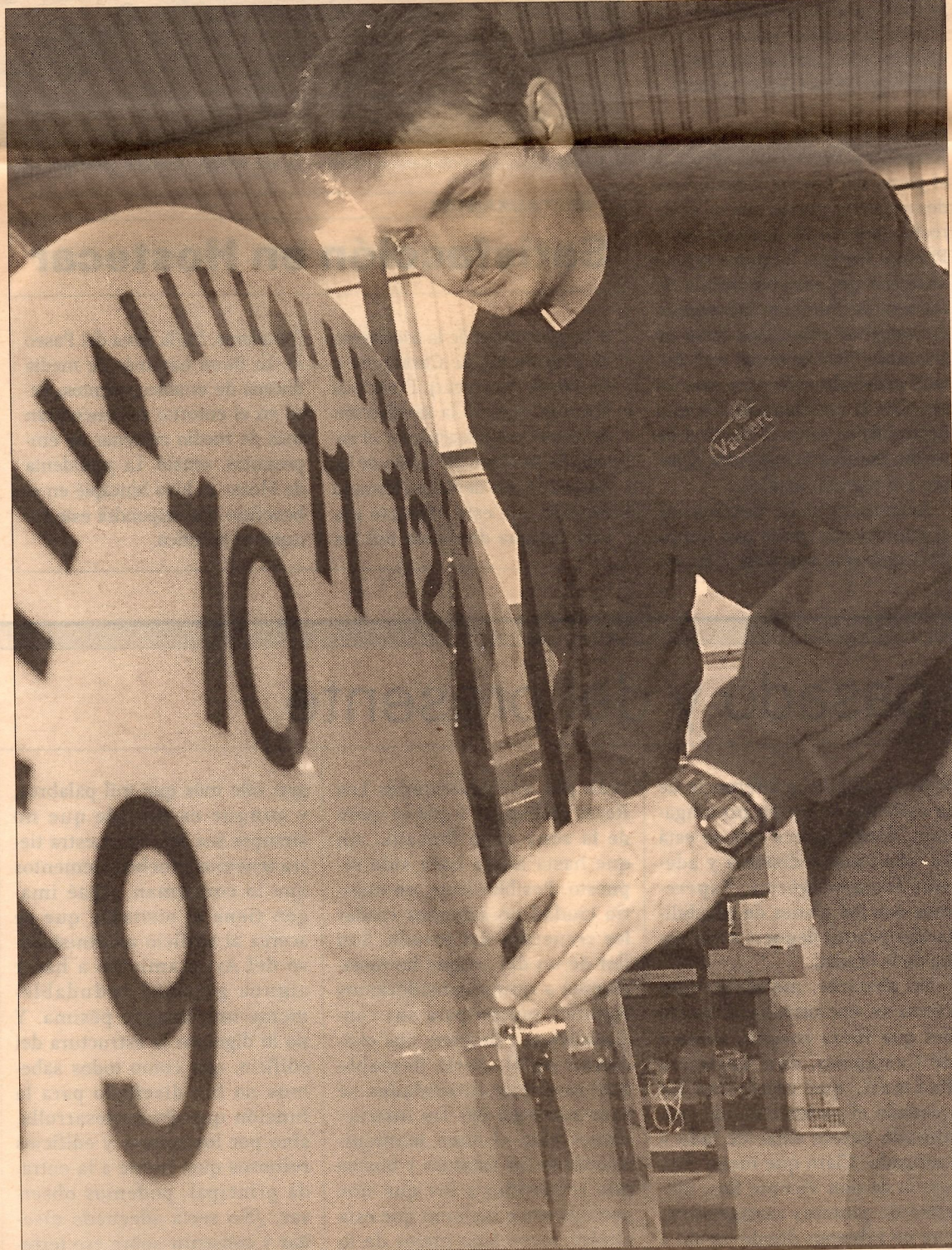
Millares de ojos se volverán cada día hacia este reloj construido en la empresa murciana

cializado Valverde, son objetos en la mayoría de los casos con historia propia. No todas, es evidente, como la tradicional "Mora" de la Catedral de Murcia, construida en 1383 y que se encuentra en el Museo Catedralicio; pero sí con singularidades específicas.