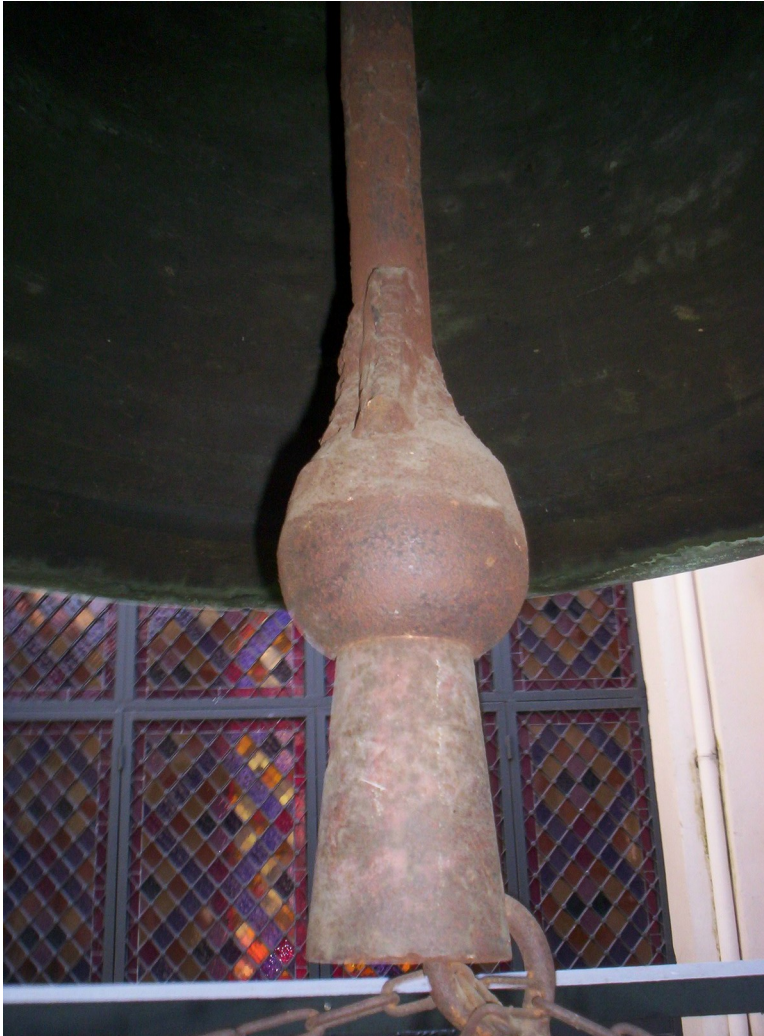
Badajo, Quebrado y soldado posteriormente. Encadenado.

Toques: Palancas para hacerla oscilar con dos cuerdas, no se toca, el badajo esta encadenado.