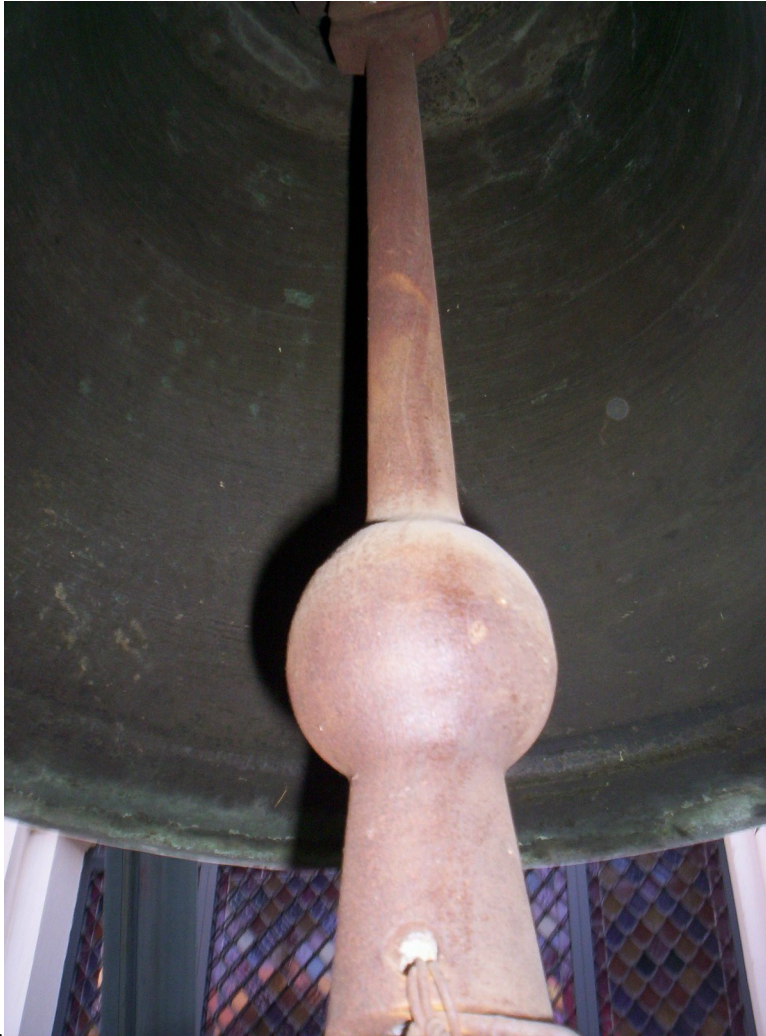
Badajo. Dos cordones, decoración vegetal, dos cordones.

Campana Santa Ana, mediana: Palancas para hacerla oscilar con dos cuerdas, no se toca, el badajo esta encadenado.