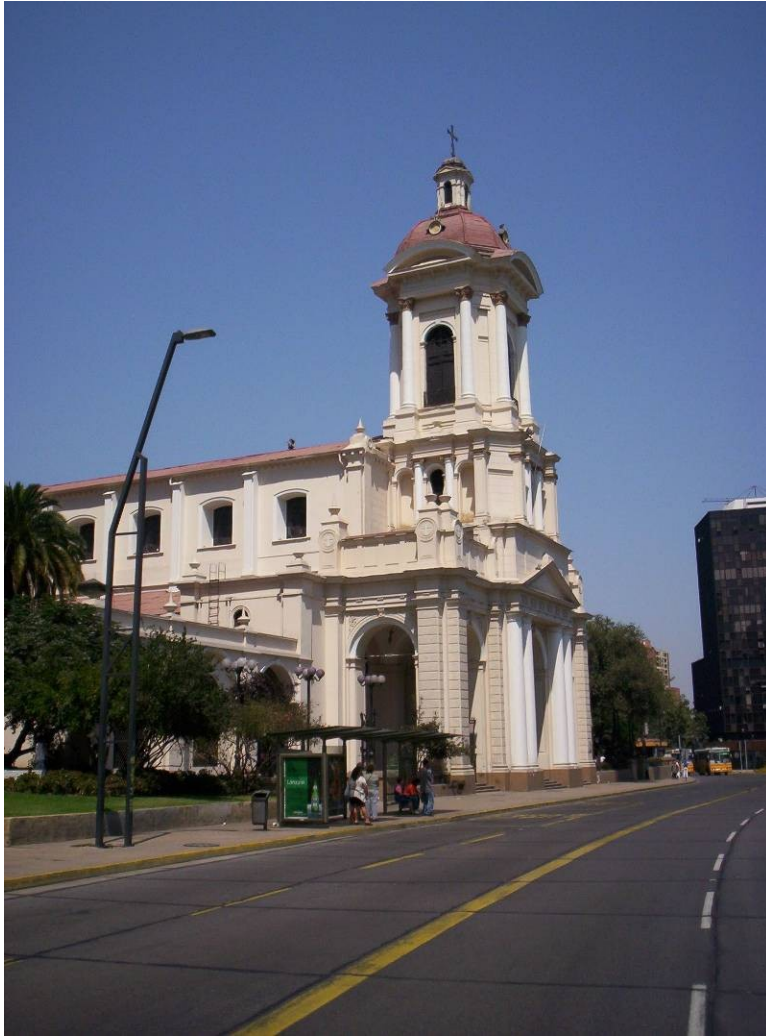
La iglesia vista desde la calle Providencia.