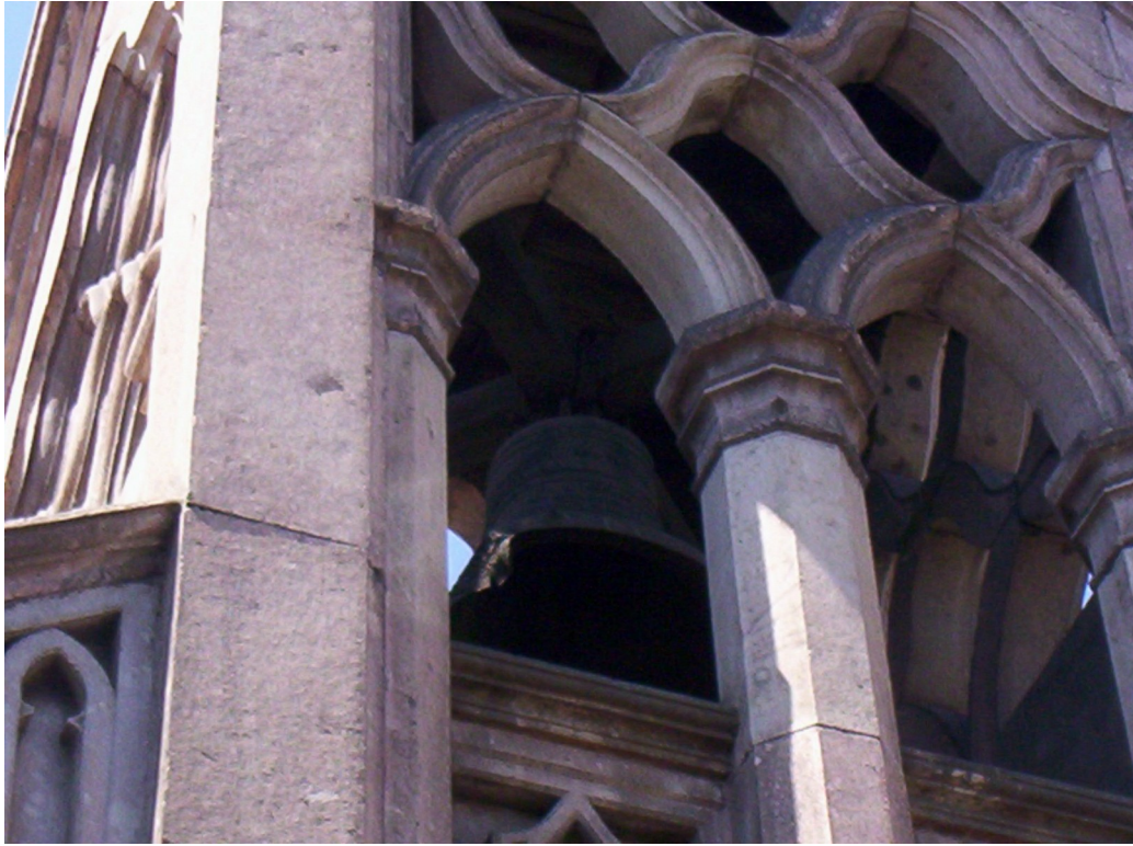
Campana, dañada por el fuego.