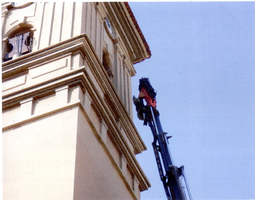
Baixada de les campanes el passat 6 de juny.

Cap de les dos estava en funcionament: la de Sant Josep presentava un problema a l'eix de gir que impossibilitava el seu volteig i la denominada "José Vicente" estava guardada dins de l'Església. El procés de restauració que han seguit les dos campanes és el mateix que ja es va fer amb les altres de la parròquia: s'ha netejat el bronze per eliminar la capa superficial de brutícia, de forma que la campana recupera la sonoritat perduda; a truja de ferro es canvia per altra de fusta, que té un perfil típicament valencià i a més ajuda a que la campana sone millor; i finalment es renovarà la mecanització de les dos campanes, de forma que es podran voltejar manualment. Durant el mes de setembre tindran lloc una sèrie d'actes per tal de celebrar la restauració i difondre el treball de recuperació patrimonial que s'ha portat a terme.