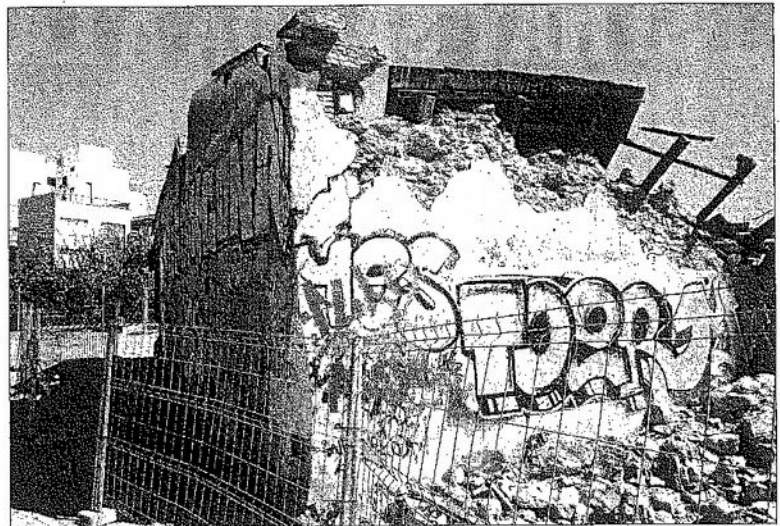
La zona del Molí del Batà que se ha hundido.

En este momento, está desprendida la parte superior de la fachada sur de esta nave de fábrica de mampostería de piedra y cal, y actualmente corren peligro de caer algunas zonas agrietadas de la esquina. Expertos consultados indican que el problema «puede ser más grave de lo que parece porque también podría colapsar todo el muro hastial que cierra al oeste de la nave». El resto del con-