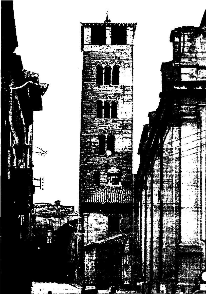
El campanar de la Catedral de Vic.

L'anàlisi de l'evolució d'aquesta participació és interessant perquè ens permet observar que en un principi l'objectiu és només cobrir els possibles desperfectes ocasionats per l'ús de qualsevol campana.