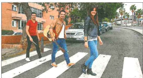
Plato fuerte. Componentes del grupo Última llave.