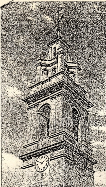
El futuro campanario en realidad virtual.