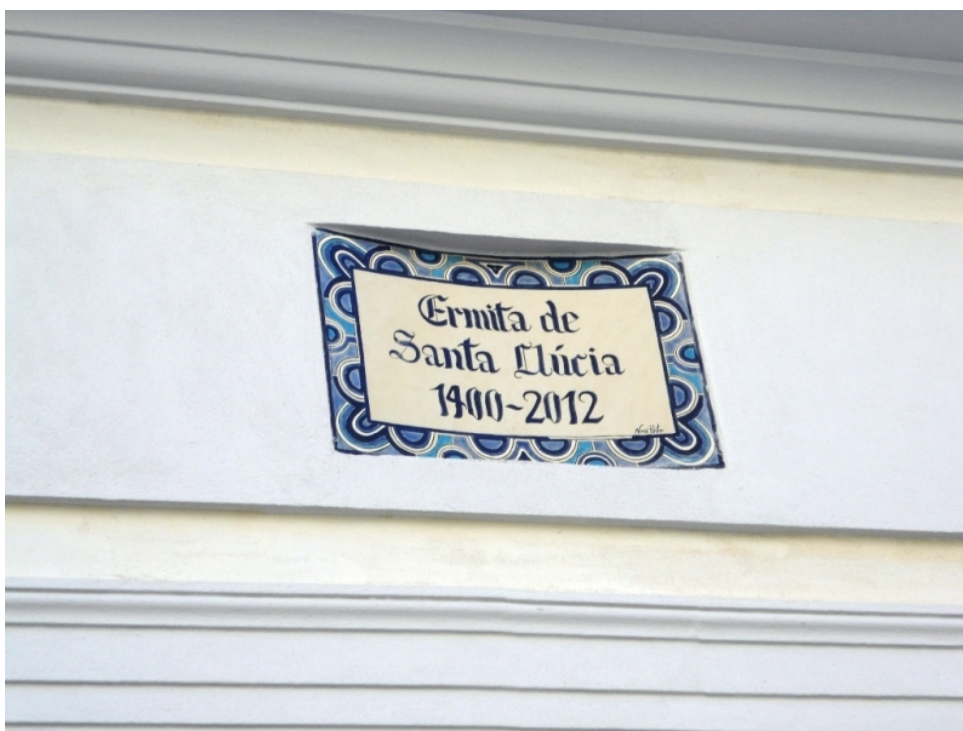
Inscripción de la fachada, en azulejo, obra de su última restauración.

Aunque actualmente se ha restaurado, todavía faltan recursos para concienciar a los ciudadanos del valor de una iglesia tan bonita y tan íntimamente ligada a la historia de nuestra ciudad, que es, en cierta medida, nuestra historia.