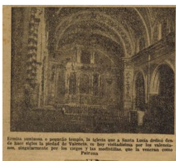
Publicación de un artículo sobre la Ermita en el Almanaque de Las Provincias para 1884, por Antonio M. Cervero. Foto: Las Provincias, 1883.

Además de las publicaciones que acabamos de exponer, cabe añadir que, sobre todo por causa de sus restauraciones y la digitalización de su archivo, la Ermita ha sido mencionada en numerosas revistas eclesiásticas y periódicos de la ciudad.