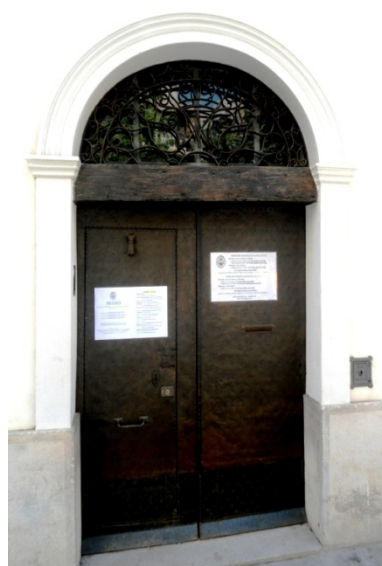
Una de las puertas laterales. Obsérvese el vano en arco de medio punto y cómo el enrejado semicircular lo convierte en rectangular.