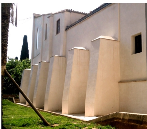
Los contrafuertes de la parte izquierda.

Se utiliza el ladrillo, y cada arco se resalta con una moldura en yeso. En las ventanas aparecen arcos apuntados o sencillamente formas rectangulares.