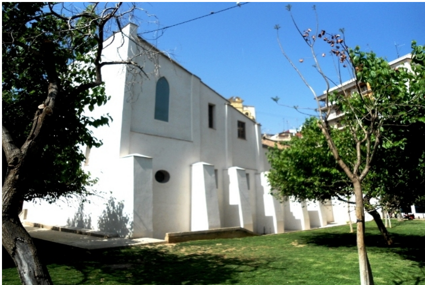
Vista de la fachada lateral izquierda (los contrafuertes que se observan fueron obra de su restauración).

Este pequeño templo ha sido restaurado recientemente, lo cual contribuyó a la concienciación por parte de los ciudadanos de su gran valía histórica y artística. Nuestro análisis es solo una de las miles de menciones que le han sido dedicadas.