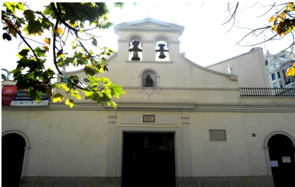
La Ermita de Santa Lucía de Valencia en el año 2014.