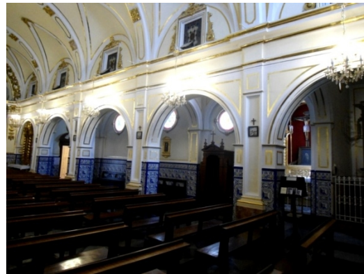
Vista frontal del interior de la ermita. Obsérvese el alicatado de la pared y la suntuosidad de la decoración. A la dcha., vista de la nave lateral.