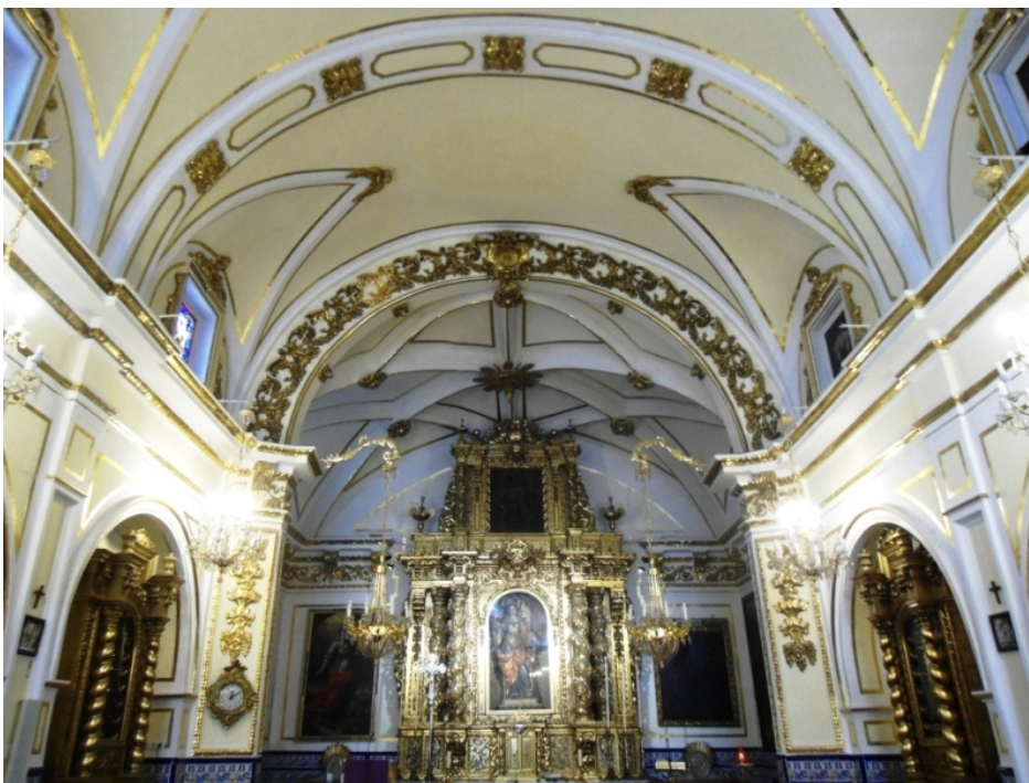
Gran majestuosidad de la capilla mayor; las imágenes y las pinturas se enmarcan en pan de oro y columnas salomónicas.