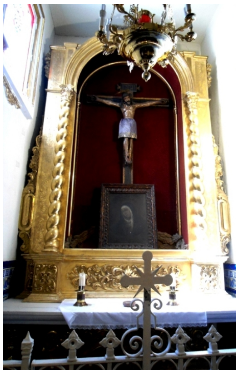
El Cristo del Perdón, anónimo, en madera (1600).