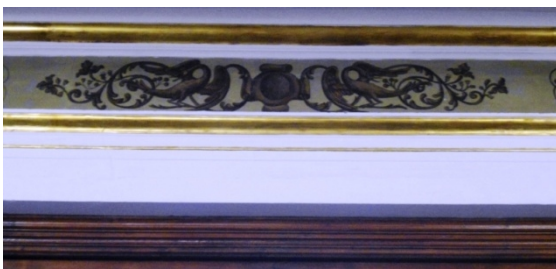
Detalle de las guirnaldas con las que está adornada la moldura de la puerta principal.