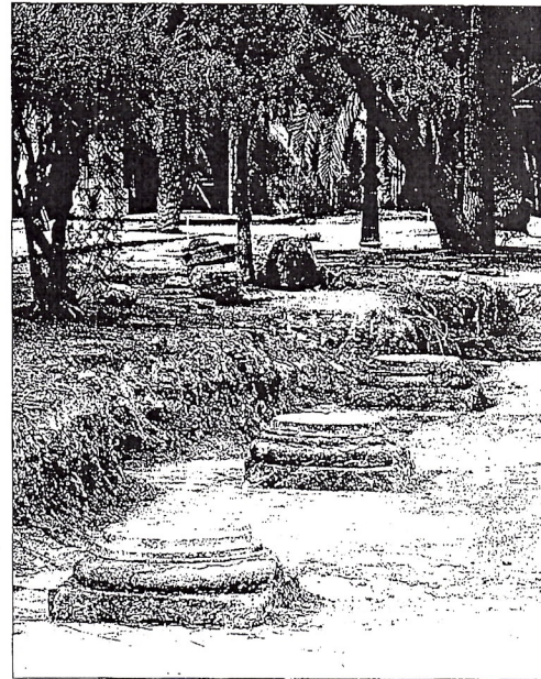
Bases de columnas y pavimento del hospital derruido. FERNANDO BUSTAMANTE