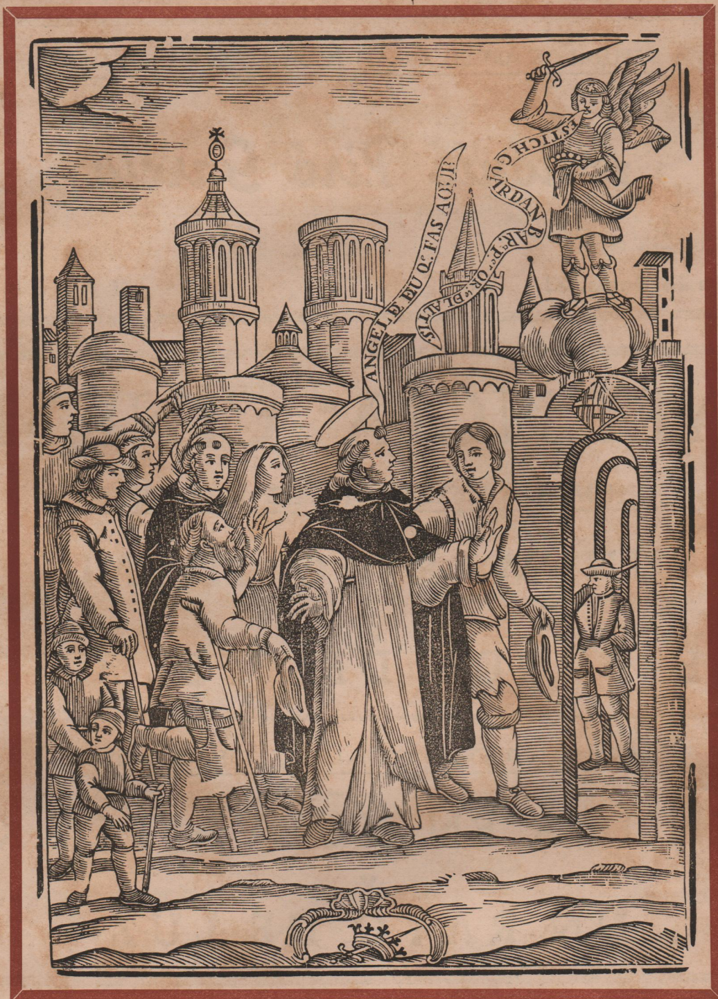
San Vicente Ferrer a la entrada de Barcelona dialogando con un Angel (Grabado tallado en madera)