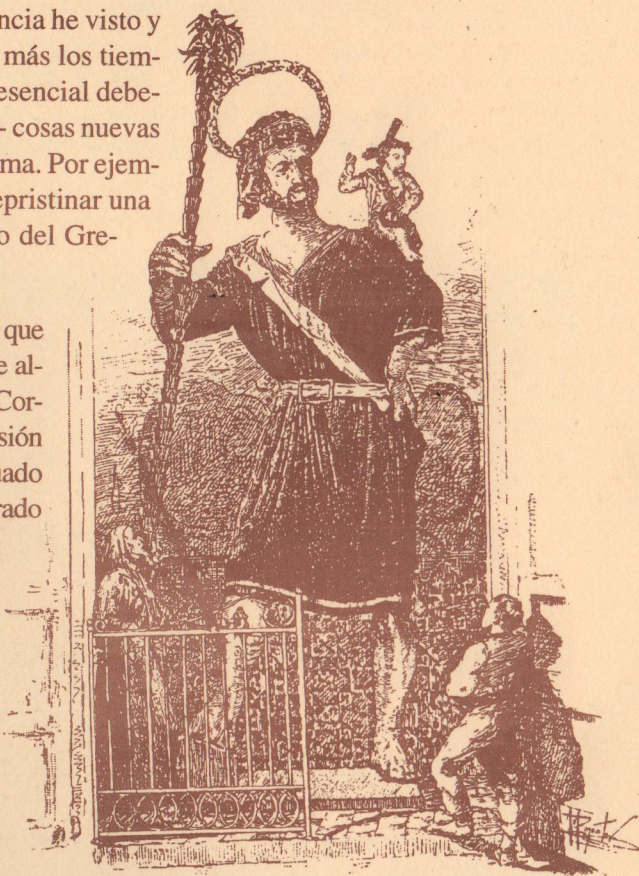
VALENCIA.- IMAGEN DE SAN CRISTÓBAL Venerada en su Capilla de la calle Corona

Aún lo estoy viendo en la grandiosa parroquia de San Miguel, situada allá por el Tossal, entrando en el primer altar del lado derecho. Asombraba y asustaba su tamaño. Desapareció como tantas cosas en la guerra Civil.