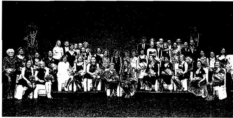
Las mujeres que han ocupado el cargo de falleras mayores durante 40 años. A. TORRENT