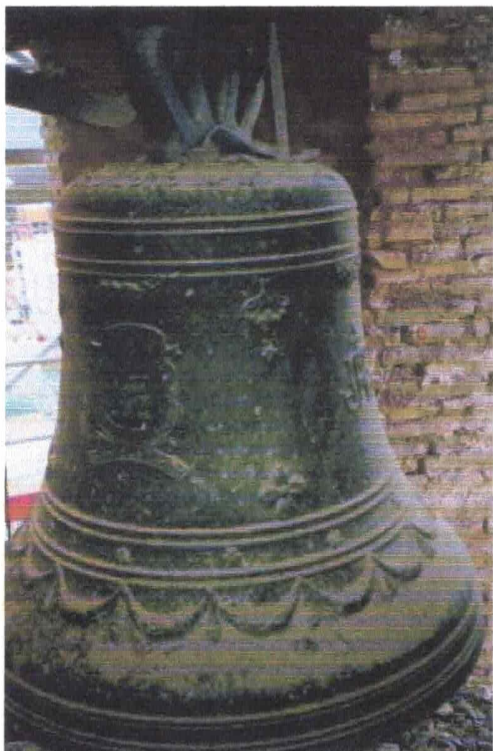
CAMPANA A DE CUARTOS 620 MM DIÁMETRO DE BOCA 138 KG DE PESO APROXIMADO AÑO DE FUNDICIÓN 1930 FUNDIDOR: ROSES HNOS. (VALENCIA)