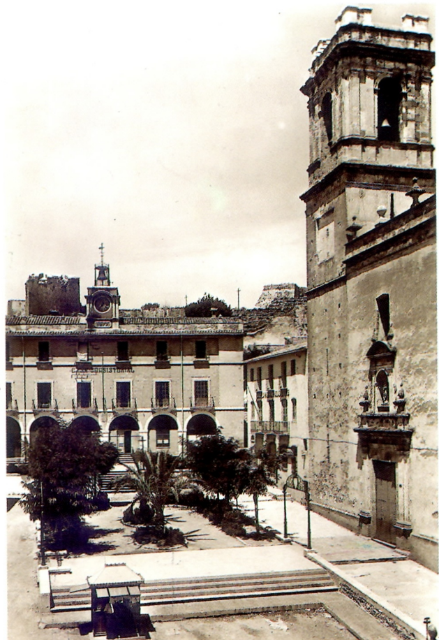
Postal. Edició José Marsal. c. 1925