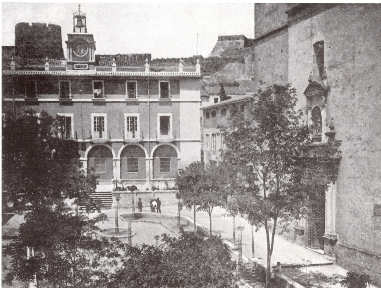
Postal. Edició Imprenta Esquerdo. c. 1915

Al caliu de la fortalesa dels seus murs, al llarg dels darrers segles, s'allotjaren els símbols i els emblemes de municipalitats pretèrites. Així, la seua façana frontera té, encastada al bell mig, la inscripció dedicada a un dianensi , Titus Iunius , que accedí a mitjan segle II al càrrec de tribú de la Legió XX, amb seu a Chester -Anglaterra-. A la cantonera s'adossà l'ara dedicada a la deessa Venus per Cneus Octavius Florus , que ostentà el càrrec municipal de sevir augustal .