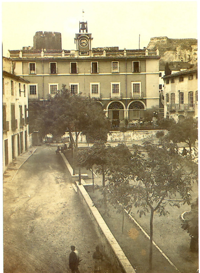
Postal. La Industrial Fotogràfica. València, c. 1910