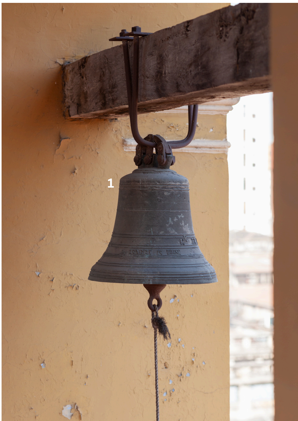
Campana 1 FABRI R 1860 P.REL...

Esta es la parte inscripción visible desde el piso del campanario. La nota de esta pequeña campana es SOL#. Queda pendiente su relevo completo. Por tamaño y antigüedad, se presume que fue campana de uso interno para organización del claustro.