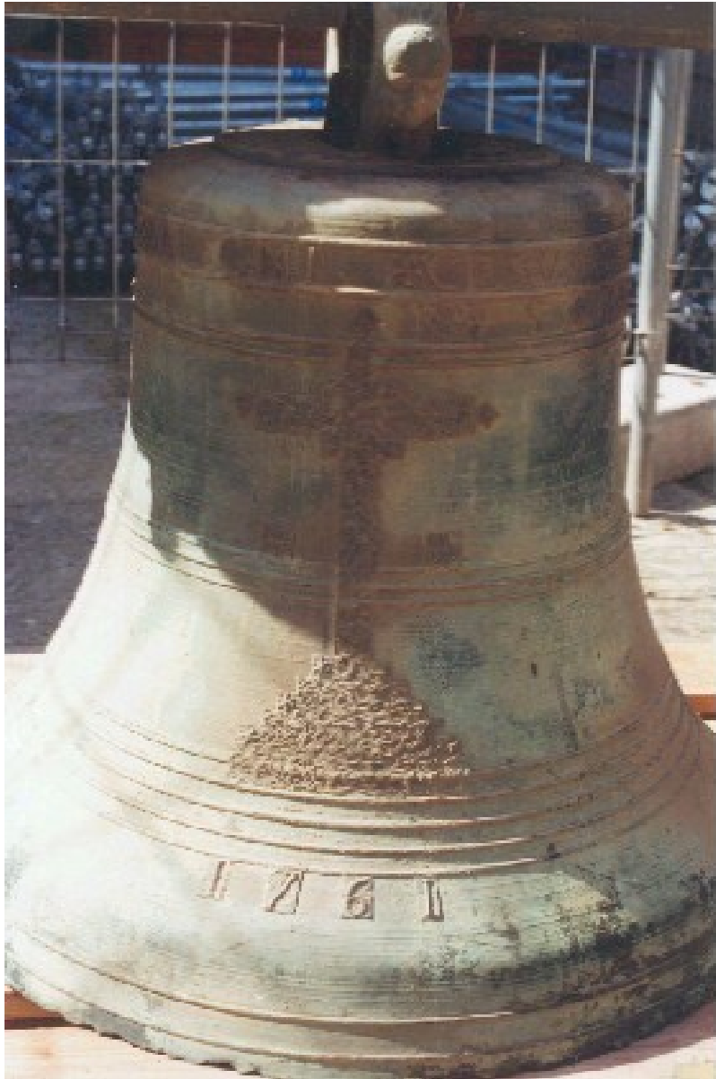
La fecha de la fundición de la campana media de Vallfogona