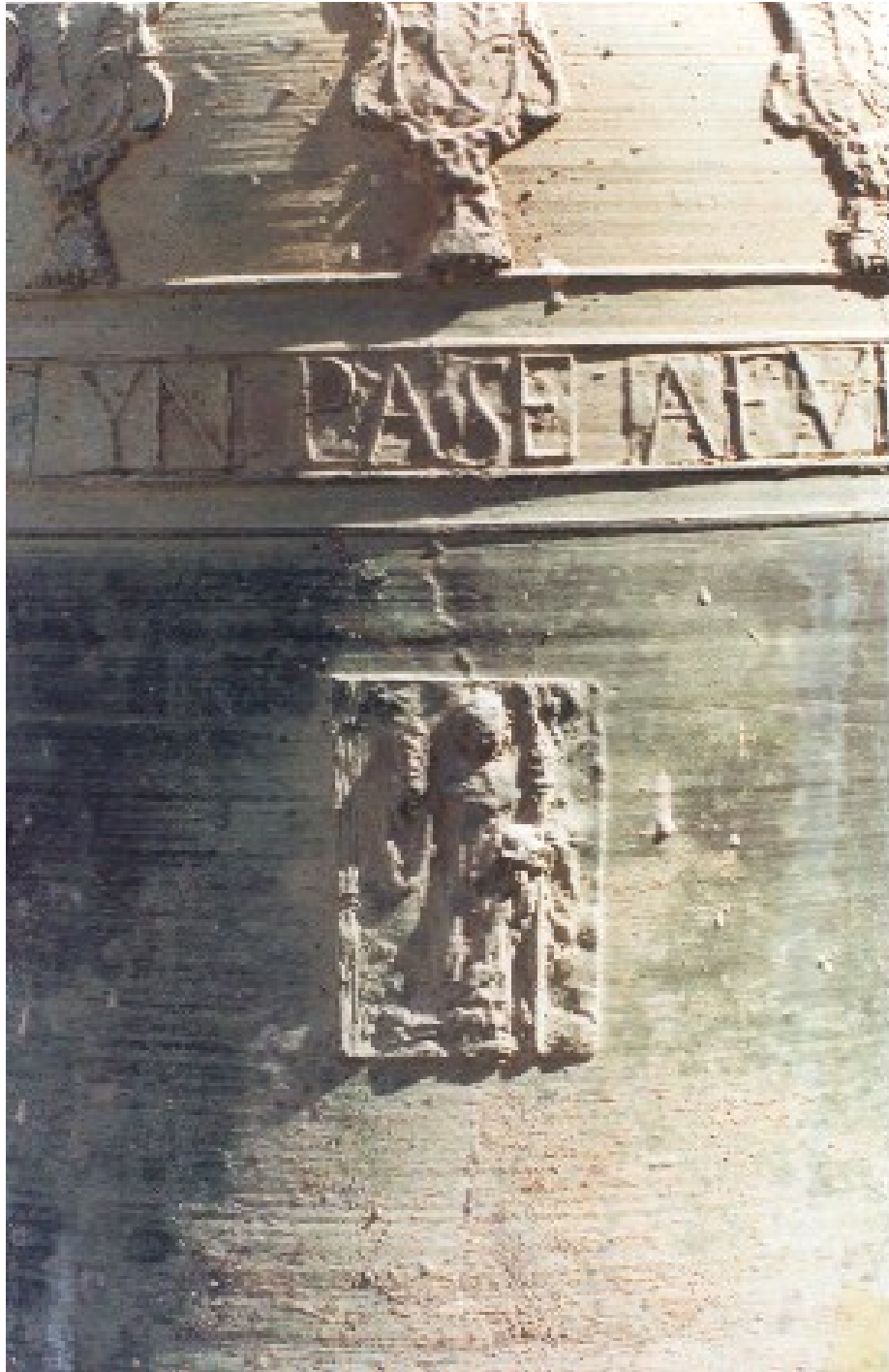
Medalla-estampa rectangular, con figura mitrada y báculo, de la campana mayor de Vallbona.