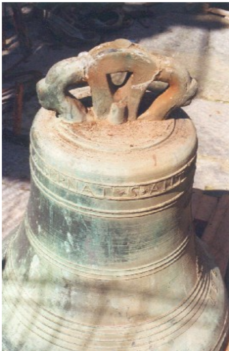
La campana mediana del monasterio de Vallbona de las Monjas

El círculo-escudo, está dividido en cuatro partes iguales que muestran: en el cuartel superior de la izquierda, un castillo (armas de Cortit), en el de la derecha unas barras (de Lauria), en el inferior izquierda un león rampante, y en el de la derecha una rodela y una luna creciente (de Vilafranca); el escudo correspondiente a la abadesa Agnes de Cortit de Colomina (1748-1767).