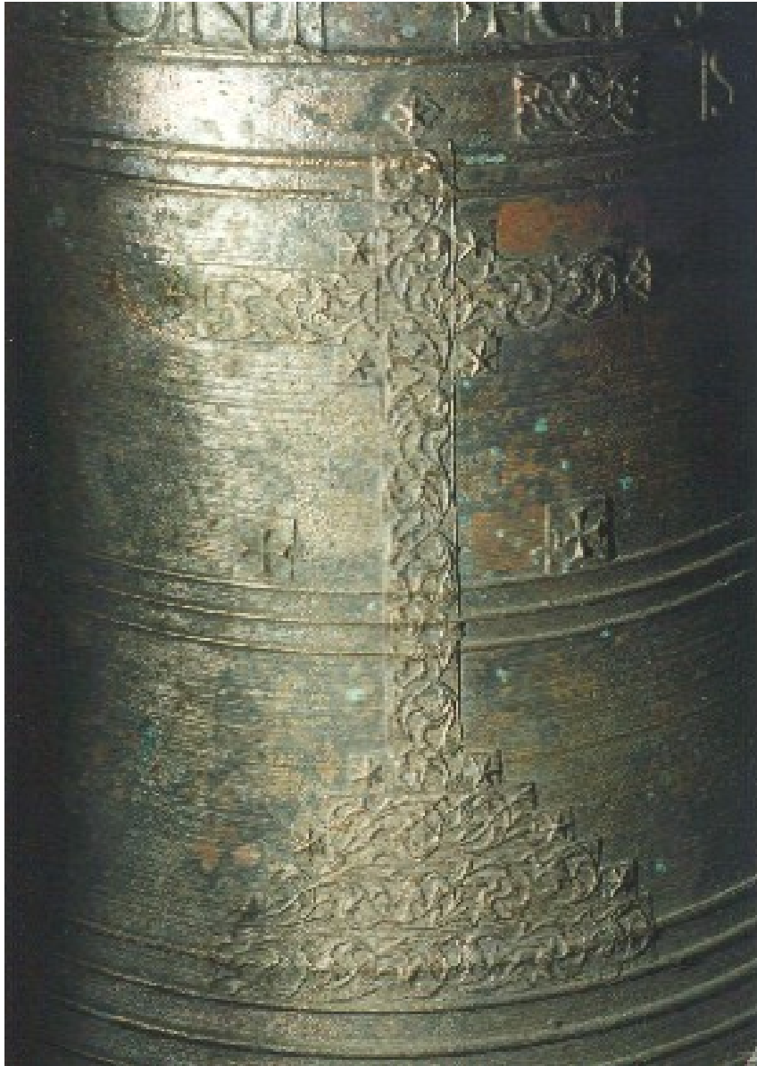
Cruz muy decorada de la campana media de Vallbona