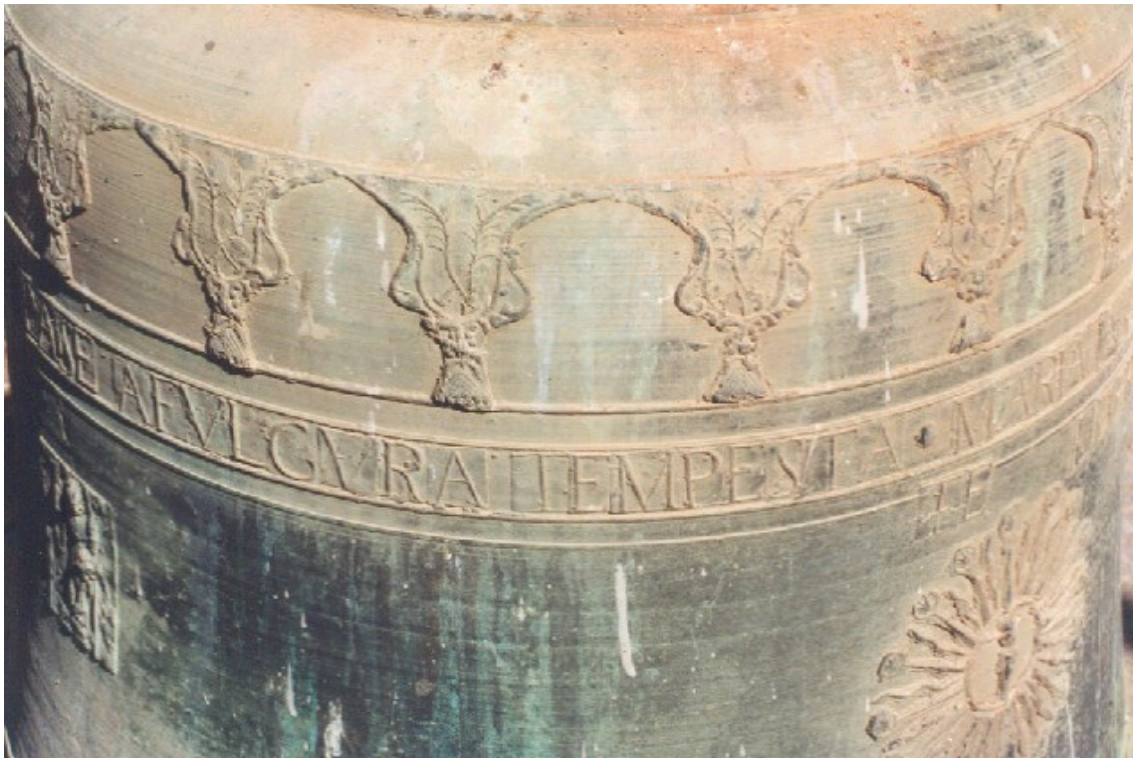
Cenefa y leyenda de la parte superior de la campana mayor de Vallbona

Por debajo de los ángeles laterales, hay un báculo y lo que podría ser un cíngulo o estola.