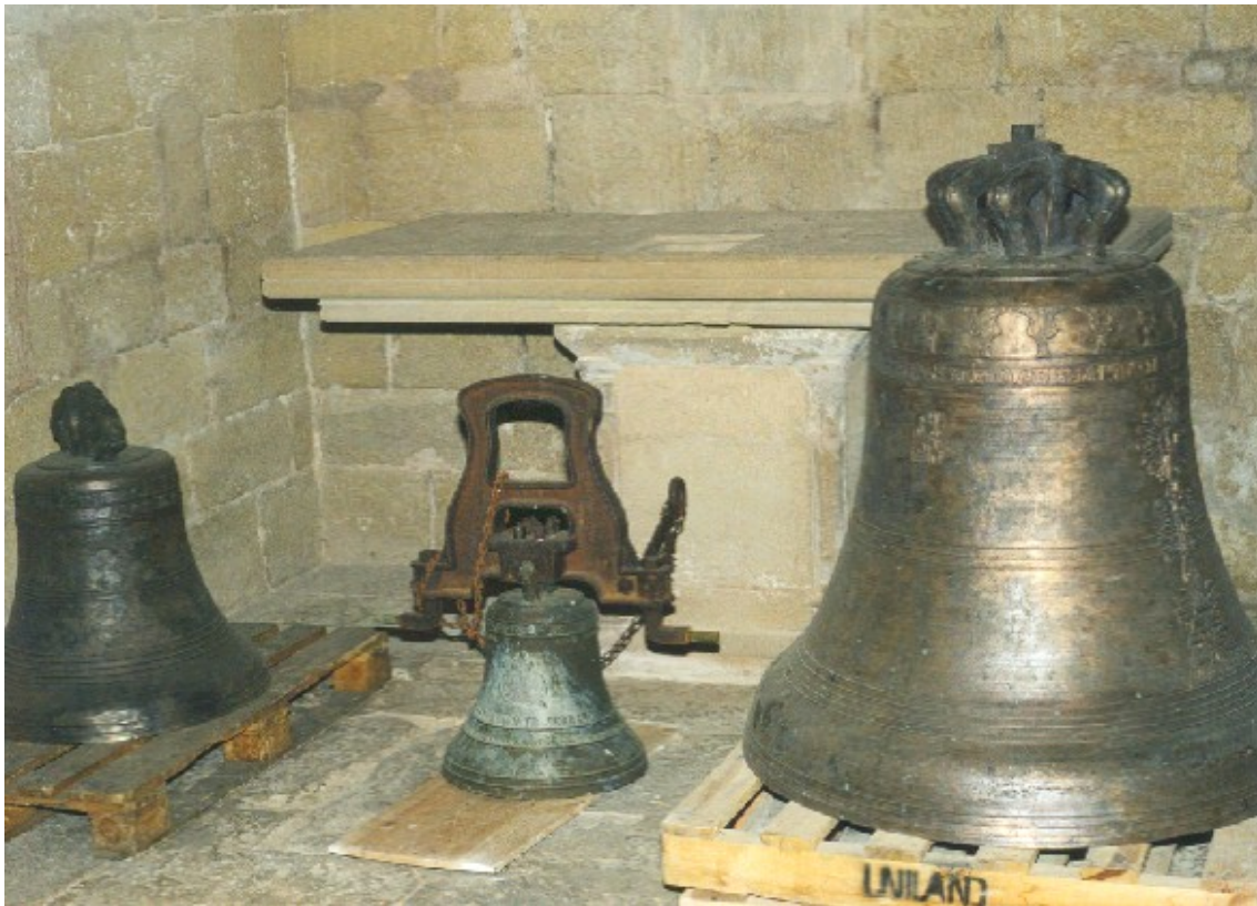
Las campanas depositas provisionalmente en una capilla de la iglesia