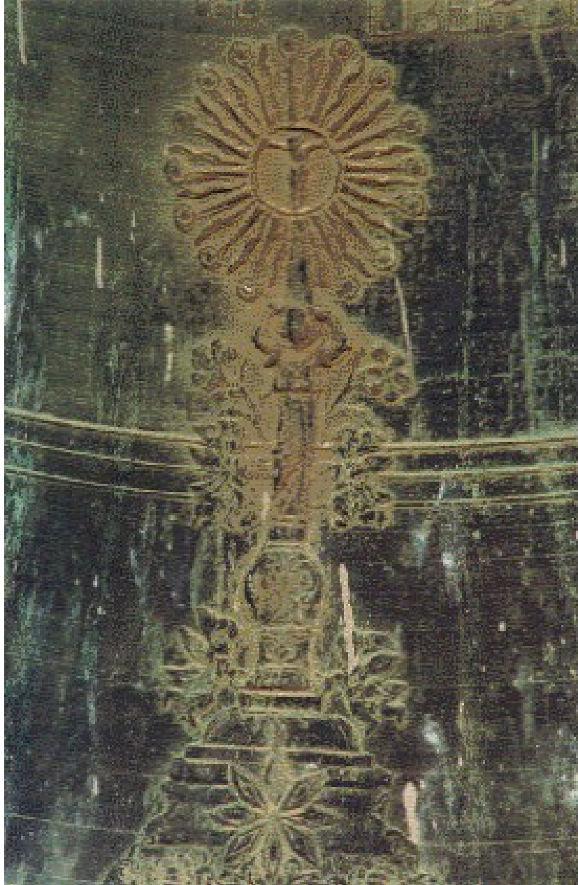
Detalle de la custodia, decorativa, de la campana mayor del monasterio de Vallbona de las Monjas