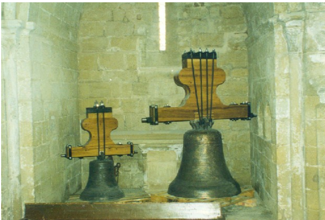
Las campanas mayor y mediana limpias y con los yugos montados, en espera de su colocación definitiva en el campanario