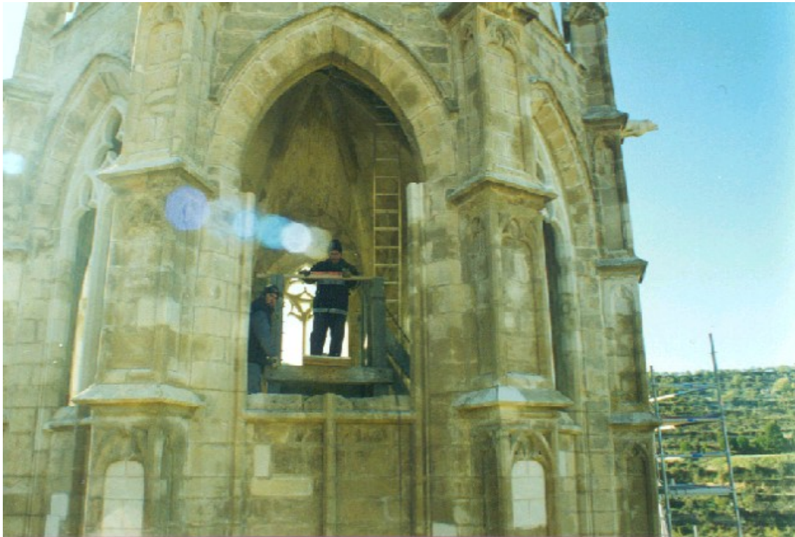
Arreglo de los ventanales, antes de colocar las campanas