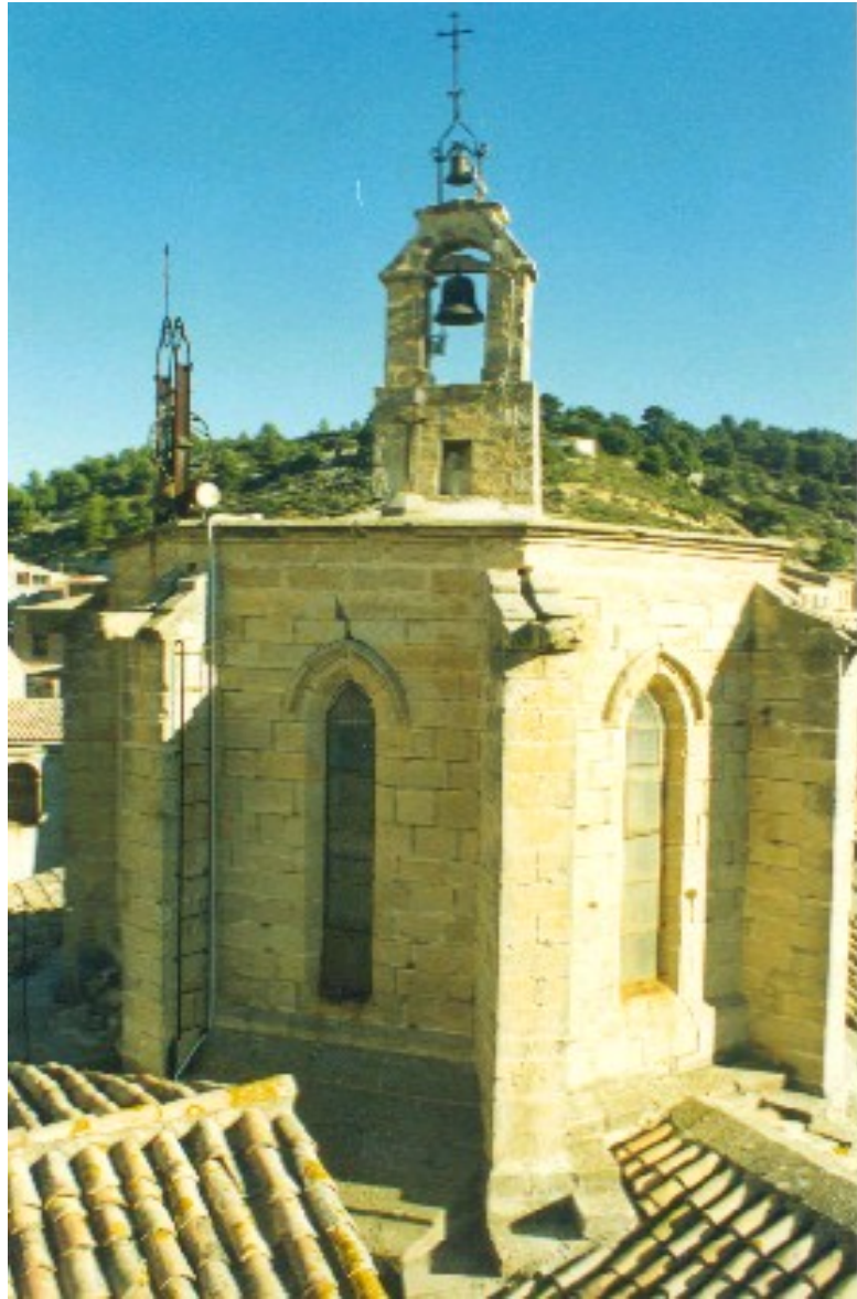
Campanario del monasterio de Vallbona de las Monjas.