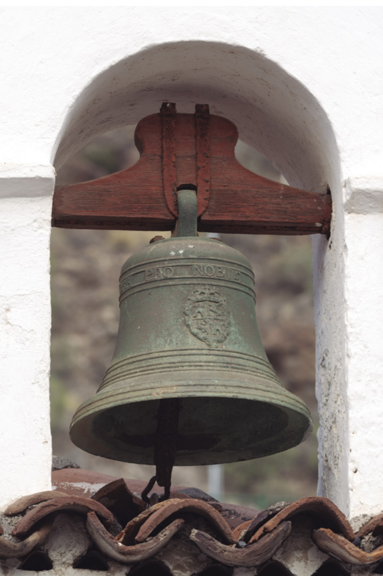
■ FIG. 4. CAMPANA [DETALLE DE LA DEDICATORIA Y DEL ESCUDO HERÁLDICO]. ANÓNIMA. SEVILLA (S. XVIII). ERMITA DE SAN SEBASTIÁN. SAN SEBASTIÁN DE LA GOMERA.

Además de esta, son dignas de mención las campanas fundidas durante el siglo XIX, todas ellas de diversa procedencia. La pieza más antigua corresponde a la ermita de Santiago Apóstol (Valverde). Se trata de un instrumento procedente de Cantabria (España) fabricado en 1817 por Francisco Javier del Otero (fig. 8).