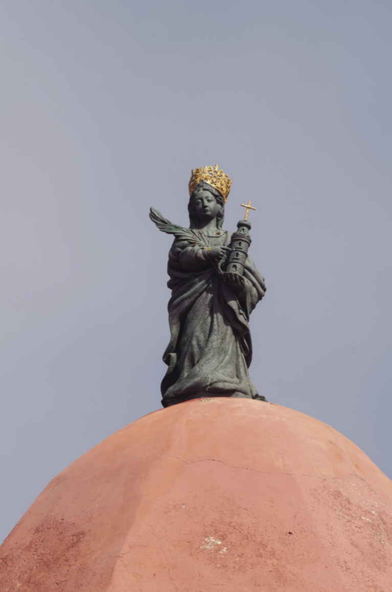
■ FIG. 6. REMATE DEL CAMPANARIO CON LA IMAGEN DE SANTA BÁRBARA, EN LA IGLESIA DE SAN PEDRO APÓSTOL DEL MOCANAL, VALVERDE.