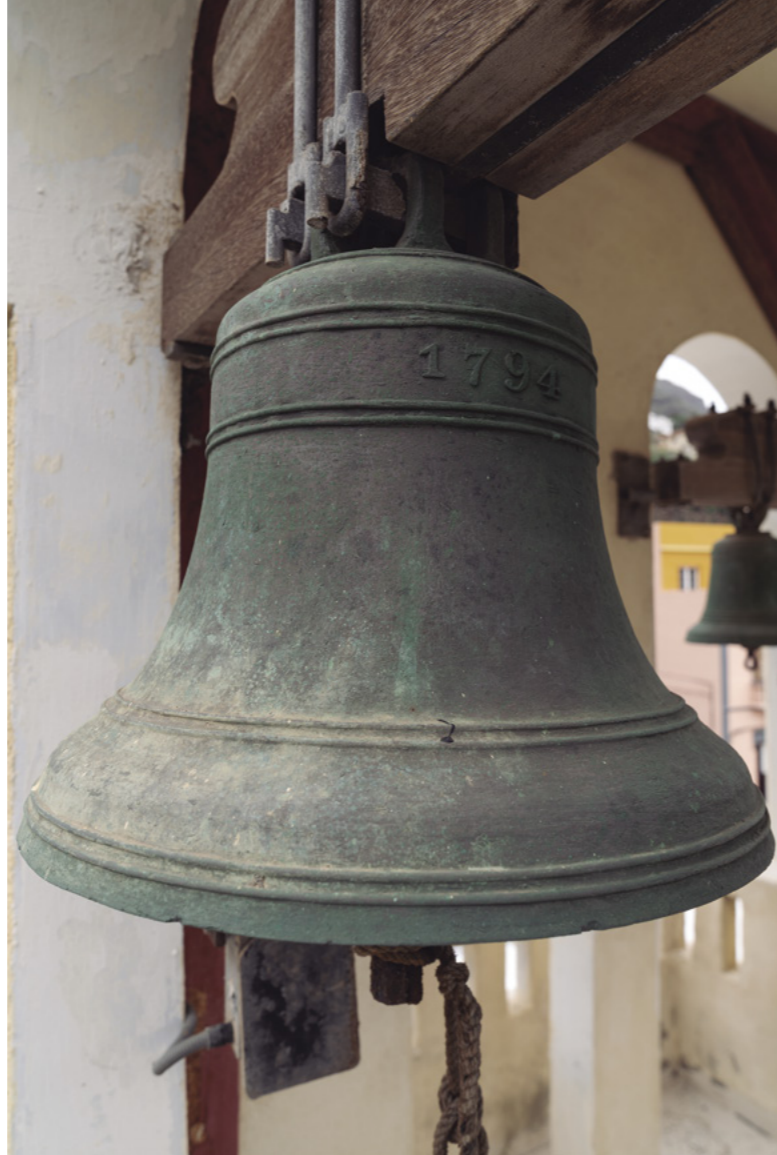
■ FIG. 3. CAMPANA [DETALLE DE LA FECHA DE FUNDICIÓN]. ANÓNIMA ¿INGLATERRA? (1794). IGLESIA DE LA VIRGEN DE LA ENCARNACIÓN. HERMIGUA.

de la Concepción de Valverde (El Hierro). En ningún caso pudimos registrar la existencia de matracas o carracas, de las que, sin embargo, existen referencias documentales y orales.