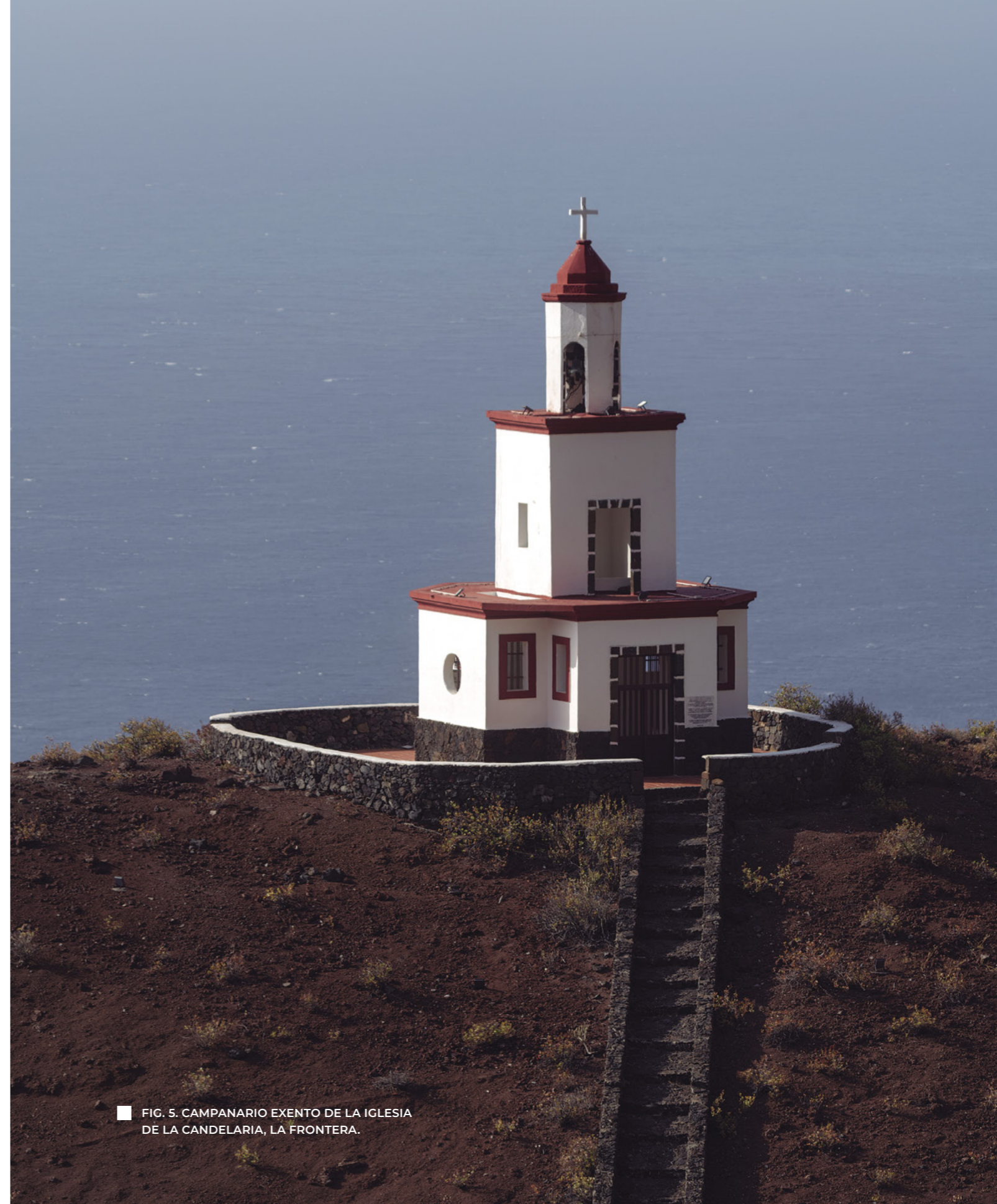
■ FIG. 5. CAMPANARIO EXENTO DE LA IGLESIA DE LA CANDELARIA, LA FRONTERA.

El resto de las piezas registradas pertenece a diferentes fabricantes de procedencia nacional, y fueron fabricadas en serie a lo largo del siglo XX, con la excepción de algún instrumento fabricado a comienzos del presente siglo. Destacamos el registro del reloj histórico de la iglesia de la Concepción (Valverde), el único de su tipo existente en la isla, adquirido en Francia en 1876, sin que, de momento, hayamos podido precisar la identidad de su fabricante (fig. 10).