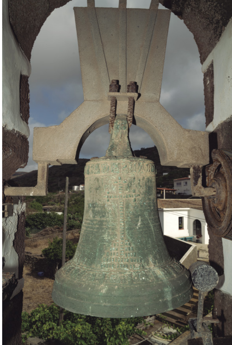
■ FIG. 7. CAMPANA. GASPAR DÍAZ ¿SANTA CRUZ DE LA PALMA? (CA. 1589). IGLESIA DE SAN PEDRO APÓSTOL DEL MOCANAL, VALVERDE.