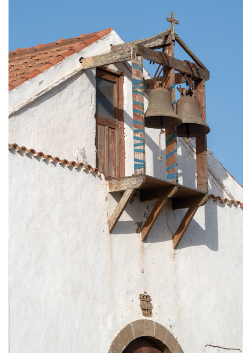
■ FIG. 9. CAMPANARIO DE LA ERMITA DE SANTIAGO APÓSTOL, VALVERDE.