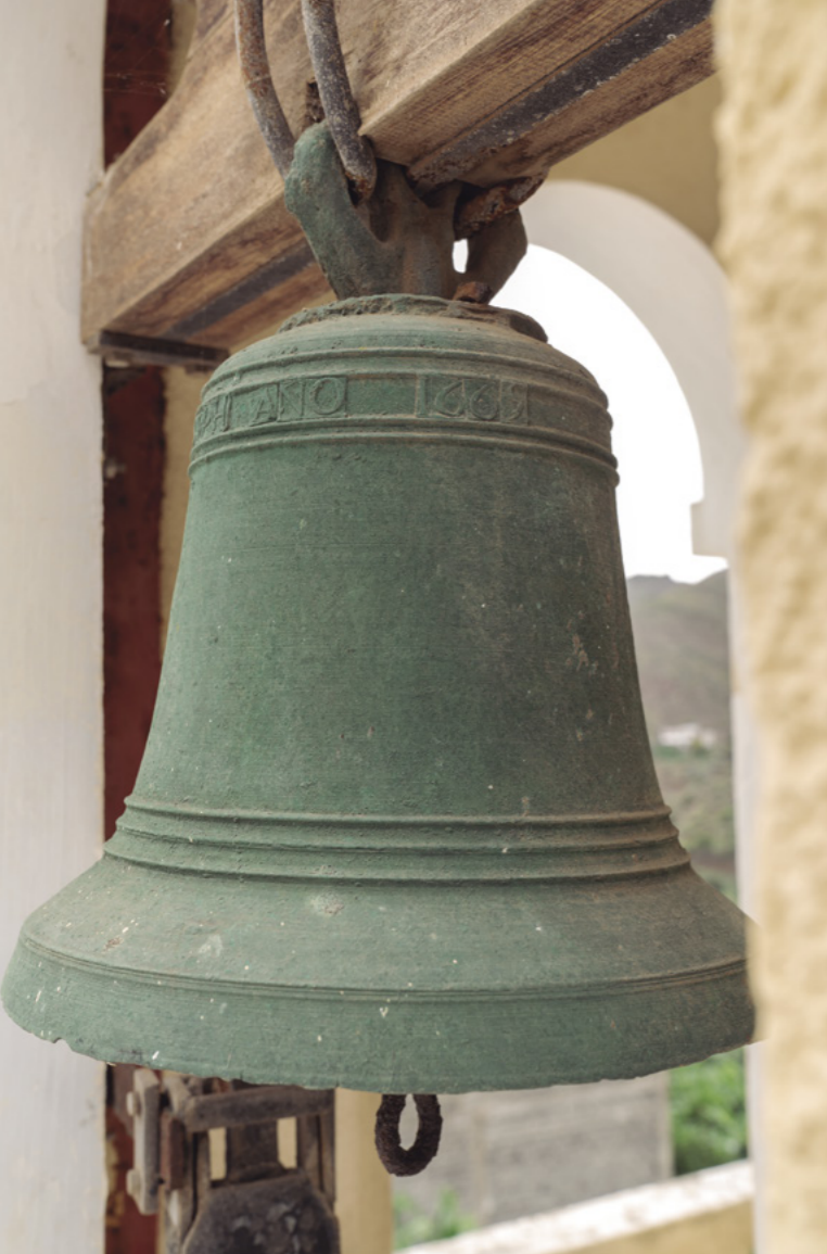
■ FIG. 2. CAMPANA [DETALLE DE LA FECHA DE FUNDICIÓN]. ATRIBUIDA A JUAN FELIPE DE RIVAS ¿SANTA CRUZ DE LA PALMA? (1665). IGLESIA DE LA VIRGEN DE LA ENCARNACIÓN. HERMIGUA.