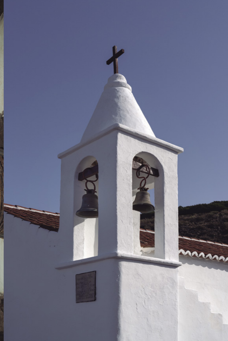
■ FIG. 8. CAMPANARIO DEL SANTUARIO DE NTRA. SRA. DE LOS REYES, LA FRONTERA.