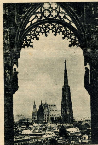
La Catedral de San Esteban