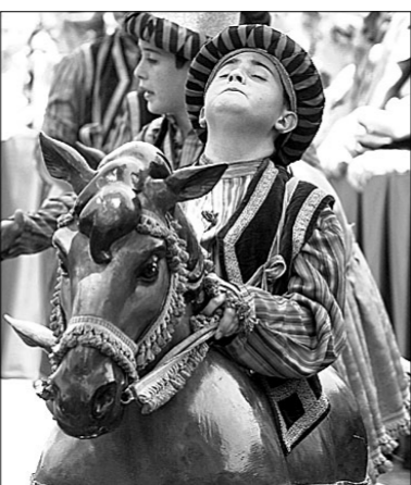
Danza "dels Cavallets". / DAMIÁN TORRES