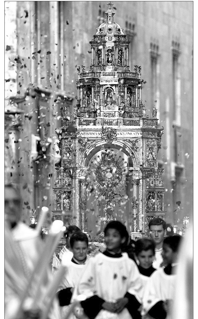
Procesión vespertina del Corpus.

Sin embargo, la calle Avellanas fue ayer protagonista doble de la festividad. El director de cine José Antonio Escrivá rodaba unas escenas de su nueva película basada en la novela de Blasco Ibáñez Arroz y