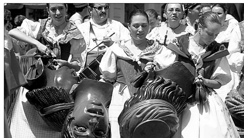
Grupo de danzantes que representan a los "Cabuts".

En Ontinyent, la celebración de este año adquirió un carácter especial al conmemorarse el II centenario de la Campana del Santísimo y, para esta ocasión, se estrenó en la procesión, durante la actuación del Ball dels Cavallets , el pasacalle Les Carrasses del Santíssim , compuesto por el ontinyentí Saül Gómez Soler. La procesión partió alrededor de las 5:45 horas de la iglesia de la Asunción y contó con el desfile de danzas.