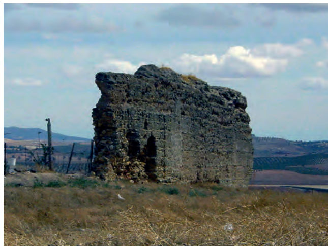
2. LOS PAREDONES DE OSUNA. SEGÚN UNA IMAGEN RECIENTE QUE MUESTRA LOS VESTIGIOS MUY ARRUINADOS DEL CASTILLO DE LA VILLA, VISTOS DESDE EL NOROESTE.