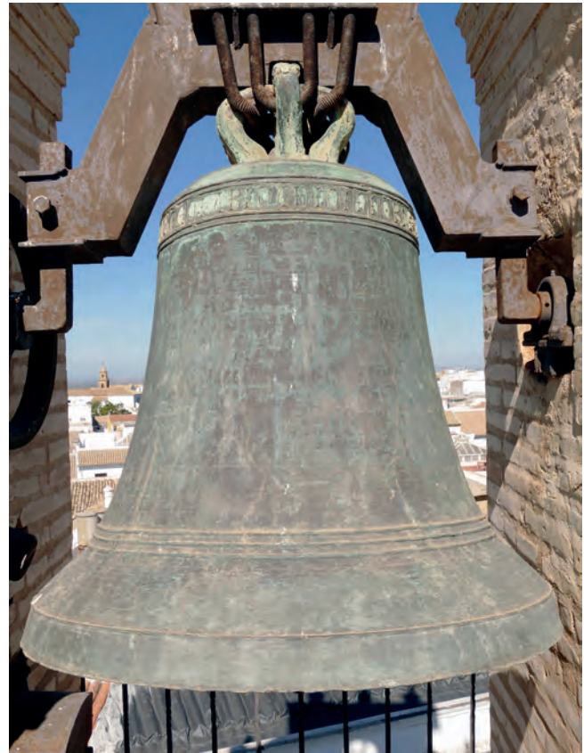
6. VISTA MERIDIONAL Y TRASERA DE LA CAMPANA ORIENTAL DEL CONVENTO CARMELITA DE SAN PEDRO.

En realidad, lo que aquí pretendemos es relacionar estos acontecimientos con el dato recogido por ciertos autores que aluden en sus escritos al asunto de las campanas de la iglesia mayor de Osuna. Hecho en el que, aunque no son especialmente específicos con los detalles, también creemos que deben estar refiriéndose a una única, idéntica e importante cuestión, como veremos.