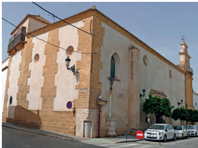
1. VISTA PANORÁMICA ACTUAL DEL CONVENTO CARMELITA DE SAN PEDRO DE OSUNA, JUNTO A LA PLAZA JUAN XXIII, EN LA CONFLUENCIA DE LAS CALLES CRISTO CON PINTOR RODRÍGUEZ JALDÓN.