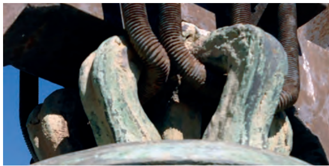
11. DETALLE DE LAS ASAS DE LA CAMPANA ORIENTAL DE SAN PEDRO. SE APRECIAN CUATRO DE ELLAS Y EL VÁSTAGO CENTRAL EN EL QUE TODAS SE APOYAN, ASÍ COMO EL SISTEMA RECIENTE DE CABLES DE ACERO QUE LO SUJETAN AL YUGO MODERNO.

de las matrices epigráficas, particularmente cuando había que sustituir campanas muy deterioradas que querían copiar fielmente los modelos precedentes. Así, también parece probado que los bronces con forma de esquilon, buscan desde inicios del Renacimiento adaptar la forma a resultados más proporcionados. En ellos, la relación anchura/altura buscaba un acabado menos desajustado que en los tipos medievales, donde venía primando siempre una mayor dimensión de la magnitud vertical, hasta relaciones bastante más exageradas, conforme el bronce fuese más antiguo. Ese carácter está presente en los casos de San Pedro, donde encontramos una correspondencia ligeramente desigual que los hace más altos que anchos (figs. 5-6).