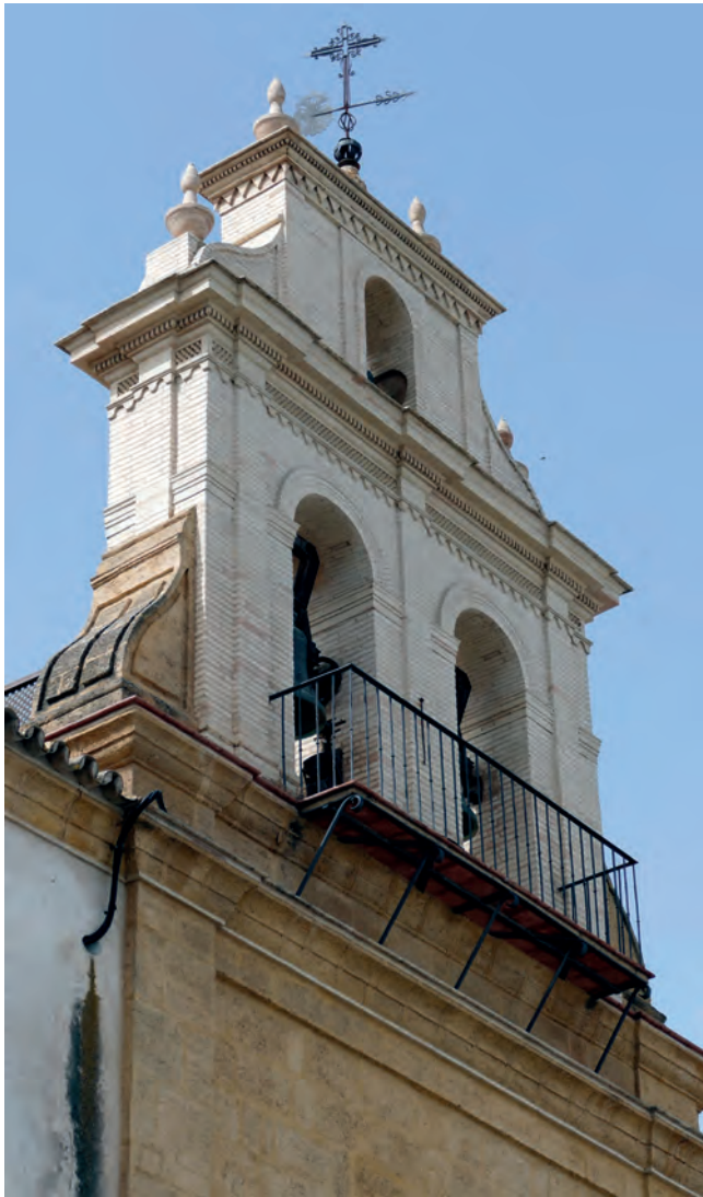
3. ESPADAÑA DEL CONVENTO DE SAN PEDRO, DONDE SE SITUAN LAS CAMPANAS GÓTICAS ESTUDIADAS, TRAS EL BALCÓN DE CERRAJERÍA QUE ABRE A CALLE RODRÍGUEZ JALDÓN.

de Córdoba, la gran metrópolis de la antigua Bética romana, pero que había conservado parte de su vigencia aún en la octava centuria de nuestra era. Este itinerario (De Santiago 1971: 56 ss.), que se diferenciaba del que se dirigió hacia Sevilla, a la búsqueda de la antigua capital de Lusitania, Mérida, debió seguir en parte el viejo camino de desde la comarca de Algeciras había unido esa zona costera con Astigi (Écija) y Corduba , desde tiempos republicanos romanos, si no antes (Sillières, 1990: 429-430), pasando directamente por la antigua Urso o por sus inmediaciones. La Osuna de entonces no pudo quedar al margen de ese movimiento militar, facilitado por un trazado estratégico muy definido, que dejaba muy próxima a la vieja población colonial hispanorromana, por lo que tampoco debió mantenerse aislada de aquellas primeras conquistas. Incluso el protagonismo que, en época medieval, tendría que desempeñar la futura villa sevillana habría dependido de su mayor o menor resistencia ante los invasores.