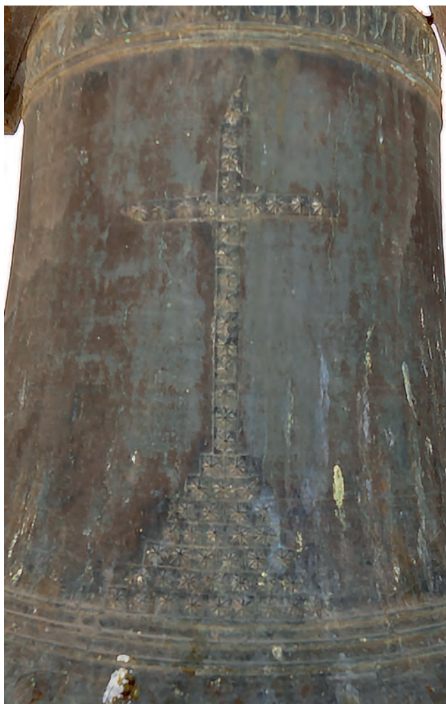
8. CALVARIO CON RELIEVE ANEPIGRAFO DE LA CARA PRINCIPAL EN LA CAMPANA ORIENTAL DE SAN PEDRO.

alejadas de otras producciones morfológicas, como fueron los bronce con formas más rechonchas y perfiles más rectos (romanas), que eran de paredes más delgadas y, habitualmente, más grandes (Alonso y Sánchez 1997: 40 ss.). Pese a todo, las formas no son buen indicativo de la cronología que puede corresponder a cada bronce, ya que fue común el uso de ambas tipologías de campanas durante mucho tiempo; por lo que, como veremos, la presencia de inscripciones en las mismas, al igual que la iconografía de sus caras, acabará siendo mucho más trascendental.