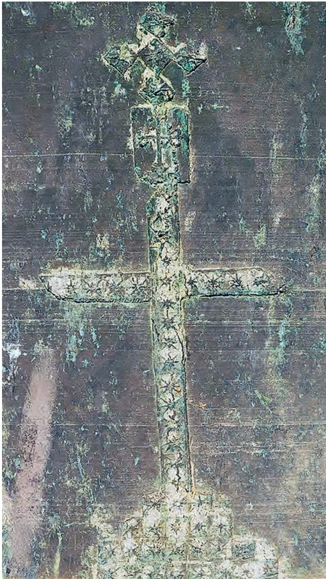
7. CALVARIO EN RELIEVE, BAJO ESCUDO CALATRAVO, CORONADO CON CRUZ GRIEGA. CAMPANA ORIENTAL DE SAN PEDRO, CARA DEL REVERSO.

presencia en ellas de inscripciones en relieve con letra gótica y contenido de carácter religioso. Pero, lo más importante, la presencia en una de ellas de un calvario en relieve, donde se insertó un escudo con el símbolo de la cruz de calatrava (figs. 5 y 7).