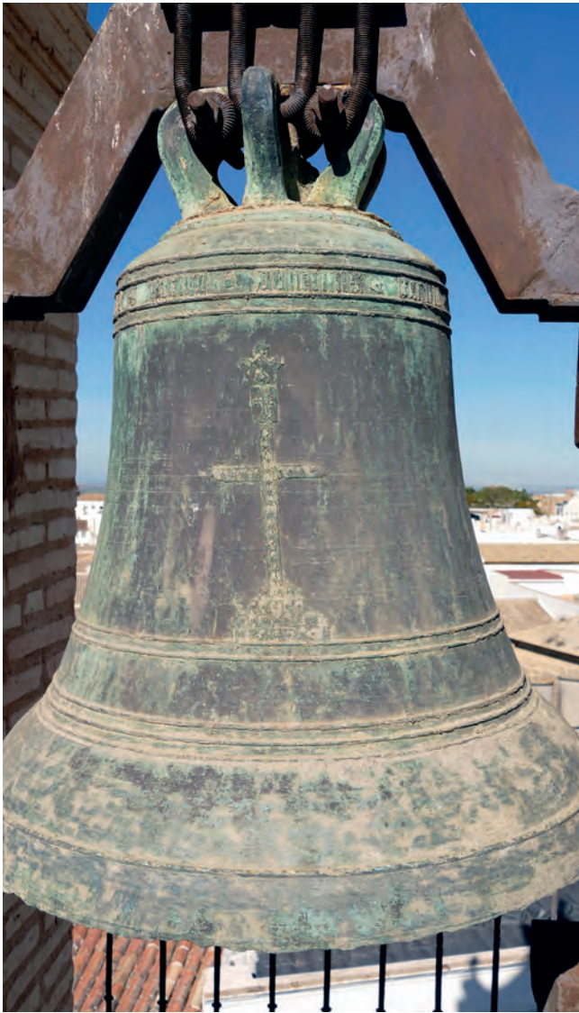
5. REVERSO DE LA CAMPANA GÓTICA ESQUILONADA OCCIDENTAL QUE CUELGA DE LA ESPADAÑA DE SAN PEDRO. VISTA DESDE EL SUR.