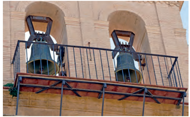
4. DETALLE DE LAS DOS CAMPANAS PRINCIPALES DE SAN PEDRO, DESDE EL NORTE, DONDE QUIZÁS SE APRECIE LA LIGERÍSIMA VARIACIÓN DIMENSIONAL ENTRE AMBAS. TAMBIÉN SON VISIBLES LOS YUGOS MODERNOS DE HIERRO QUE LAS SOSTIENEN.

Esa circunstancia geográfica, por sí sola, tampoco permite deducir la auténtica relevancia que pudiera haber tenido la Osuna de entonces. Complementariamente, por lo que se desprende del concilio de Elvira, si ello le asegurara alguna preponderancia, no es difícil que tal circunstancia proyectara la importancia de la antigua población sevillana hasta el siglo VIII, que es cuando se precipita la conquista islámica de la villa. Ello, quizás explique algo el papel que pudo desempeñar nuestra ciudad en tiempos de al-Andalus.