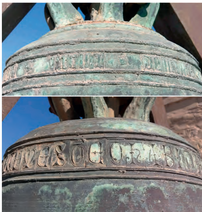
9. CAMPANAS DE SAN PEDRO. DETALLE PARCIAL DE LOS RELIEVES EPIGRÁFICOS DESARROLLADOS EN SUS TERCIOS POR LAS CARAS MERIDIONALES DE LOS BRONCES OESTE Y ESTE, RESPECTIVAMENTE. ARRIBA, SEGMENTO * PLENA * DOMINUS EN GÓTICA MINÚSCULA DE LA PRIMERA LEYENDA. ABAJO, FRAGMENTO ... FACTUMESTHABITA... EN GÓTICA MAYÚSCULA DEL SEGUNDO BRONCE.

Entre doble cordón en relieve (arriba y abajo), situados bajo el hombro, en lo que se suele denominar tercio del bronce, hay una leyenda latina escrita en letra gótica minúscula,