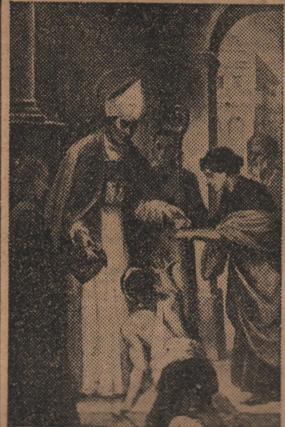
lucios cuadros de reconocidas firmas, como también todos los ornamentos, muebles y enseres del Colegio.

Las mencionadas autoridades regresan satisfechísimas de su viaje. El general Orgaz agradeció mucho el obsequio de Valencia y tuvo palabras muy halagadoras para nuestra ciudad. Por otra parte, tanto el señor gobernador como el señor alcalde fueron recibidos por el Jalifa, quien les hizo gracia de una condecoración como recuerdo de esta visita. Durante los días que han permanecido en Africa han recibido constantes atenciones.