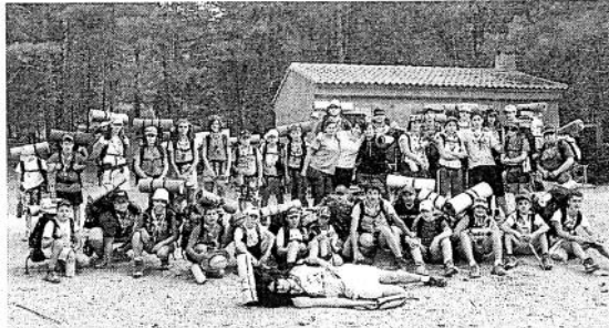
CAMPAMENTO. Grupo de J únior s de Almussafes.

El campamento de J únior s MD de Almussafes en Guadalajara ha estado marcado por el sobresalto causado por la caída de un árbol situado en la zona de tiendas. El árbol que medía más de 30 metros se precipitó sin causar daños ni materiales ni personales pero la responsable solicitó la evacuación del grupo.