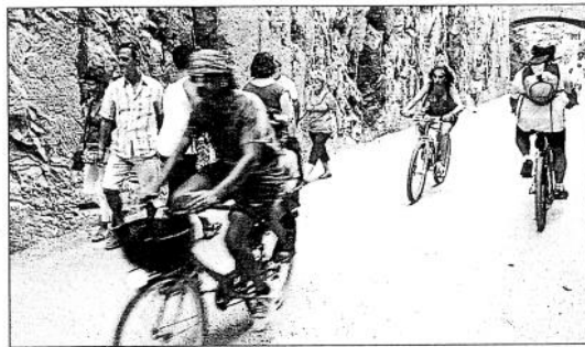
El mantenimiento de las vías verdes corren también a cargo de un turista responsable con el medio ambiente.