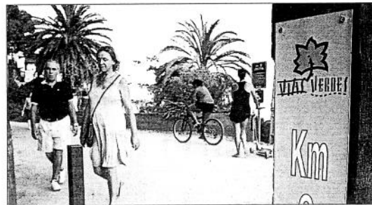
Las dos vías verdes de Castellón son una opción de ocio de muy fácil acceso y respetuosa con el entorno.